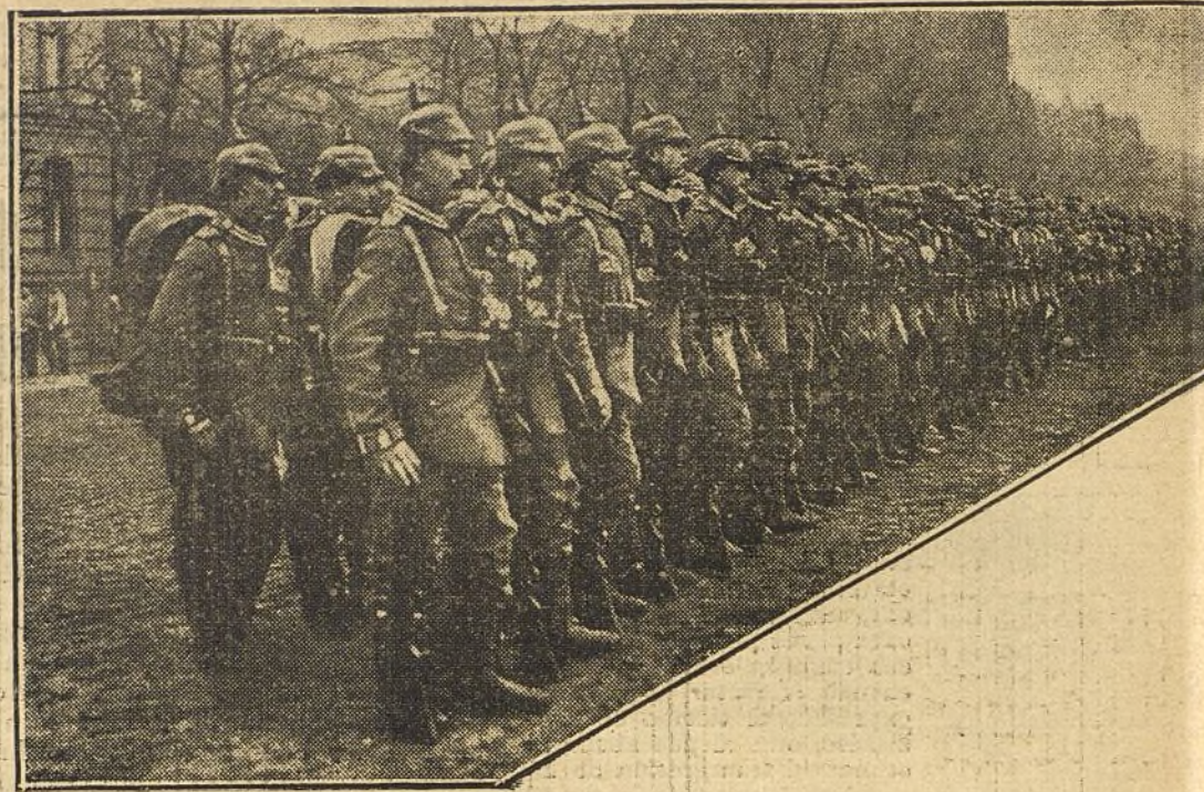
LA GUERRA EUROPEA.—Una compañía de infantería alemana, formada en Berlín antes de la revista preliminar de la marcha a la línea de fuego.