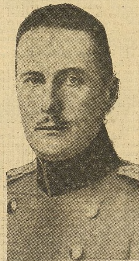
El duque Alberto de Wuttemberg, general del Cuerpo de ejército alemán que combate en Iprés.

se ha convertido en una espantapájaros, que la fiera corrupta es un ratoncillo amestrado a la palabra.