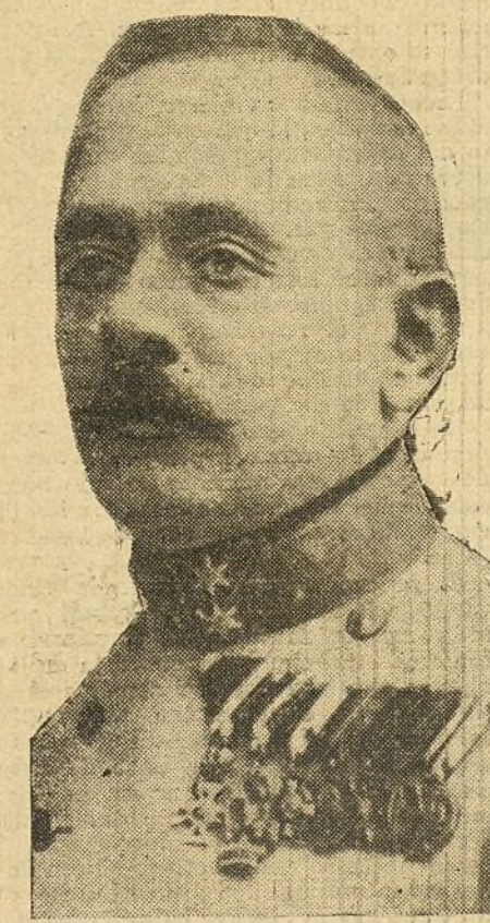
El general Boroevic, general del tercer Cuerpo de ejército austriaco, que combate en Ivangorod.

Boquita del collar de perlas, ¿qué te pasa que no dejas verlas? Boquita-brasa, boquita-fresa, ¿por qué tu cenicienta color? ¡Eres pavesa del amor!