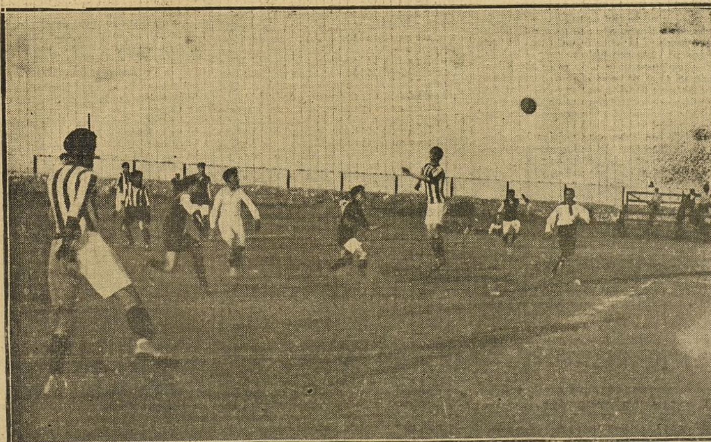
PARTIDO DE ‘FOOT-BALL’ EN SANTANDER.—Momento interesante del jugado por el Ariñ-Sport contra el Racing de Santander.