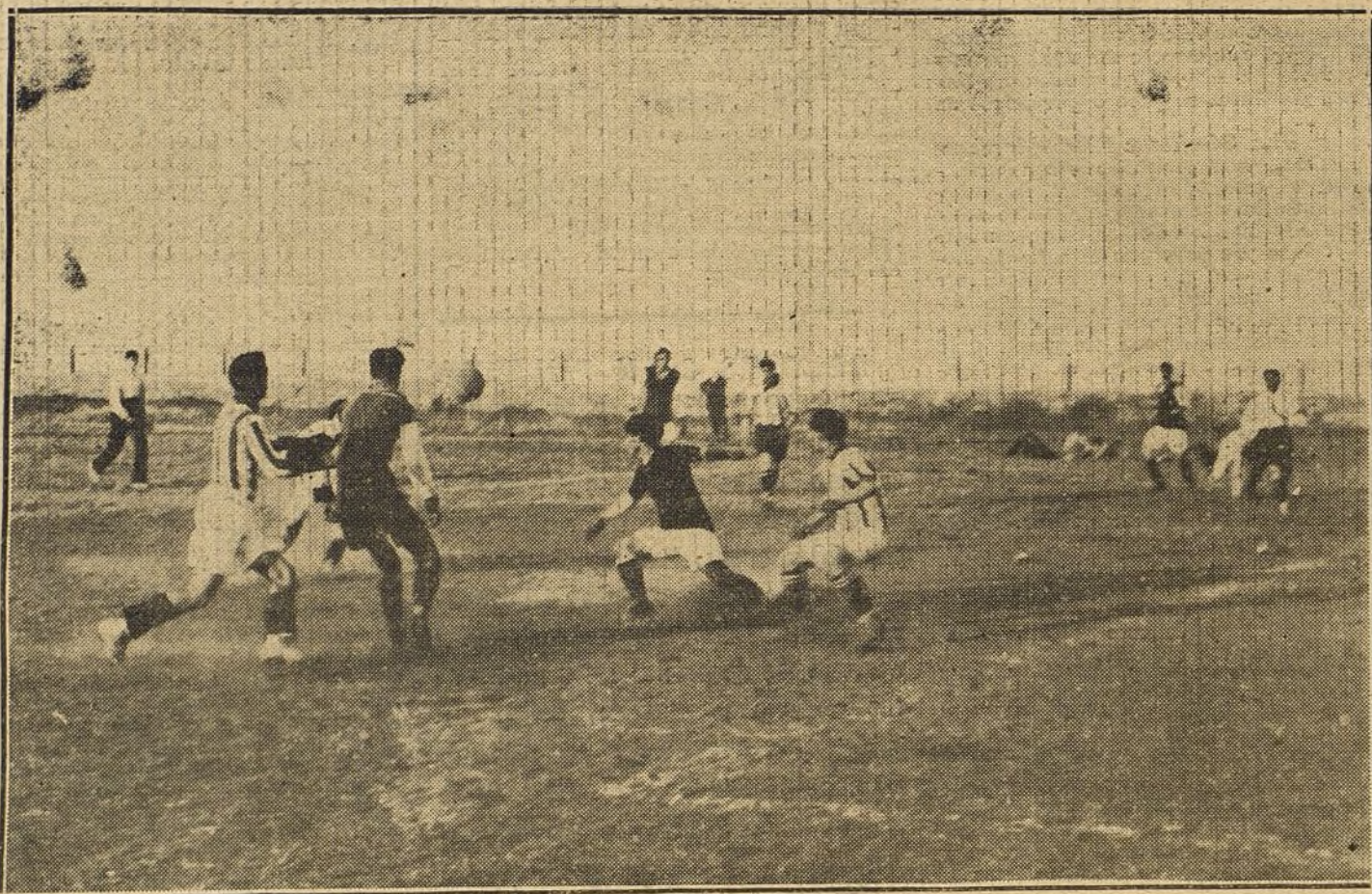
PARTIDO DE «FOOT-BALL» EN SANTANDER.—Una jugada interesante del partido jugado por los primeros equipos del Ariñ-Sport y el Racing de Santander.

El «Explorador» se separó, dirigiéndose hacia Puntales para después tomar la vuelta y entrar en la bahía. El «España» y el «Asia» siguieron rectos su camino al impulso de los remos de los jóvenes exploradores, que trabajaron con verdadero ahínco y como veteranos en estas luchas, riñéndose viaje a las ocho de la noche y llegando al mismo tiempo las tres em-