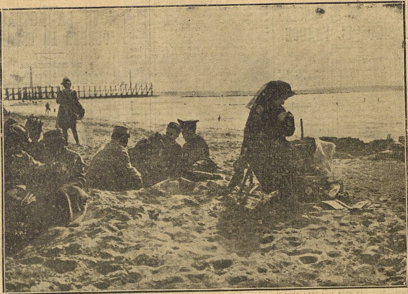
LA GUERRA EN FRANCIA.—Una playa francesa en el verano de 1915.

A S. M. el Rey se le prepara un entusiasta recibimiento, pues el pueblo de Bilbao quiere testimoniarle su agradecimiento por la cooperación que prestó para solucionar el conflicto bancario.