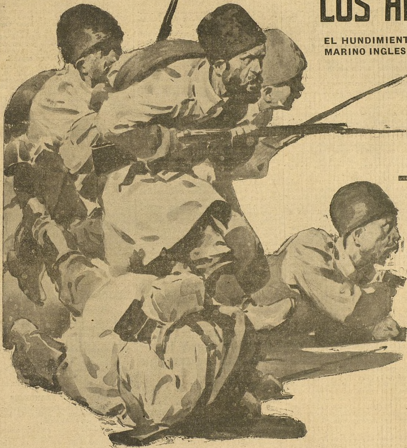
Soldados rusos defendiendo una posición

EL HUNDIMIENTO DEL «ARABIC».—UN SUBMARINO INGLES PERDIDO.—FIESTAS CON MOTIVO DEL CUMPLEAÑOS DEL EMPERADOR FRANCISCO JOSE.—NUEVO EMPRESITO DE GUERRA.—UN TELEGRAMA DEL KAISER A VON INDENBURG.—FELICITACIONES POR LA TOMA DE KOVNO.—NUEVO ACUERDO CHINOJAPONES.—LOS BARCOS ESPAÑOLES