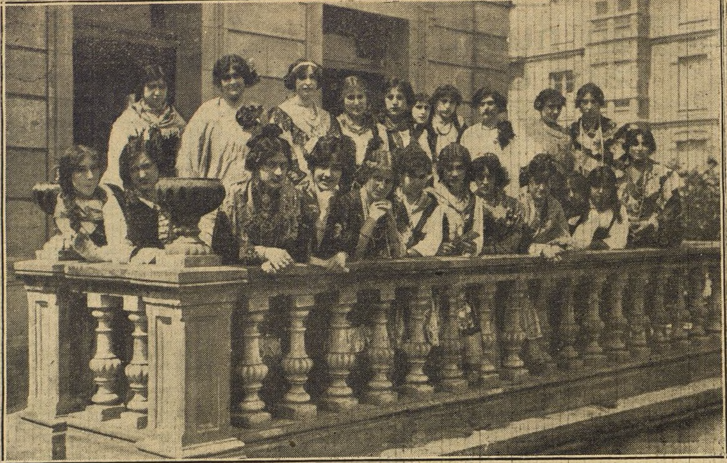
LAS FIESTAS DE TORRELAVERGA. —Grupo de hermosas señoritas de la localidad, que han tomado parte en la retreta organizada por los socios del Casino de Recreo como final de los festejos.

Llegó a decir el procurador de la República que le extrañaba «bremenara que hubiera germanofilos en los pueblos españoles fronterizos, precisamente en esos pueblos que viven del su francés. Metióse después más adentro, pretendiendo llegar como la punta de un puñal hasta el corazón del tema, y aseguró que en España éramos francofilos o germanofilos según el dinero fuera francés o alemán.