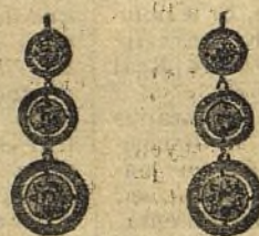
Pendientes número 200/47

Tres brillantes sobre platino, ptas. 550.