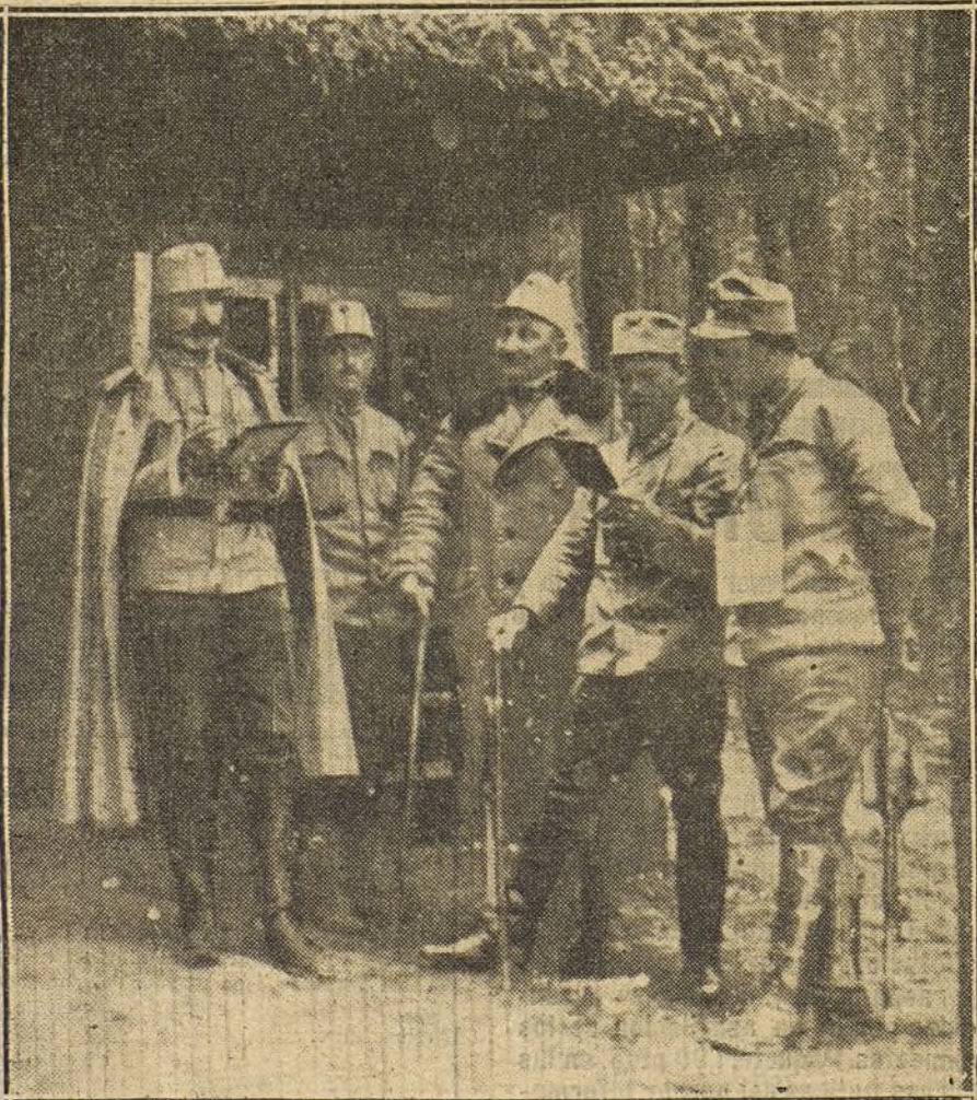
LA GUERRA EN ORIENTE. —Oficiales austriacos en una avanzada de la frontera rusa recibiendo órdenes para un ataque.