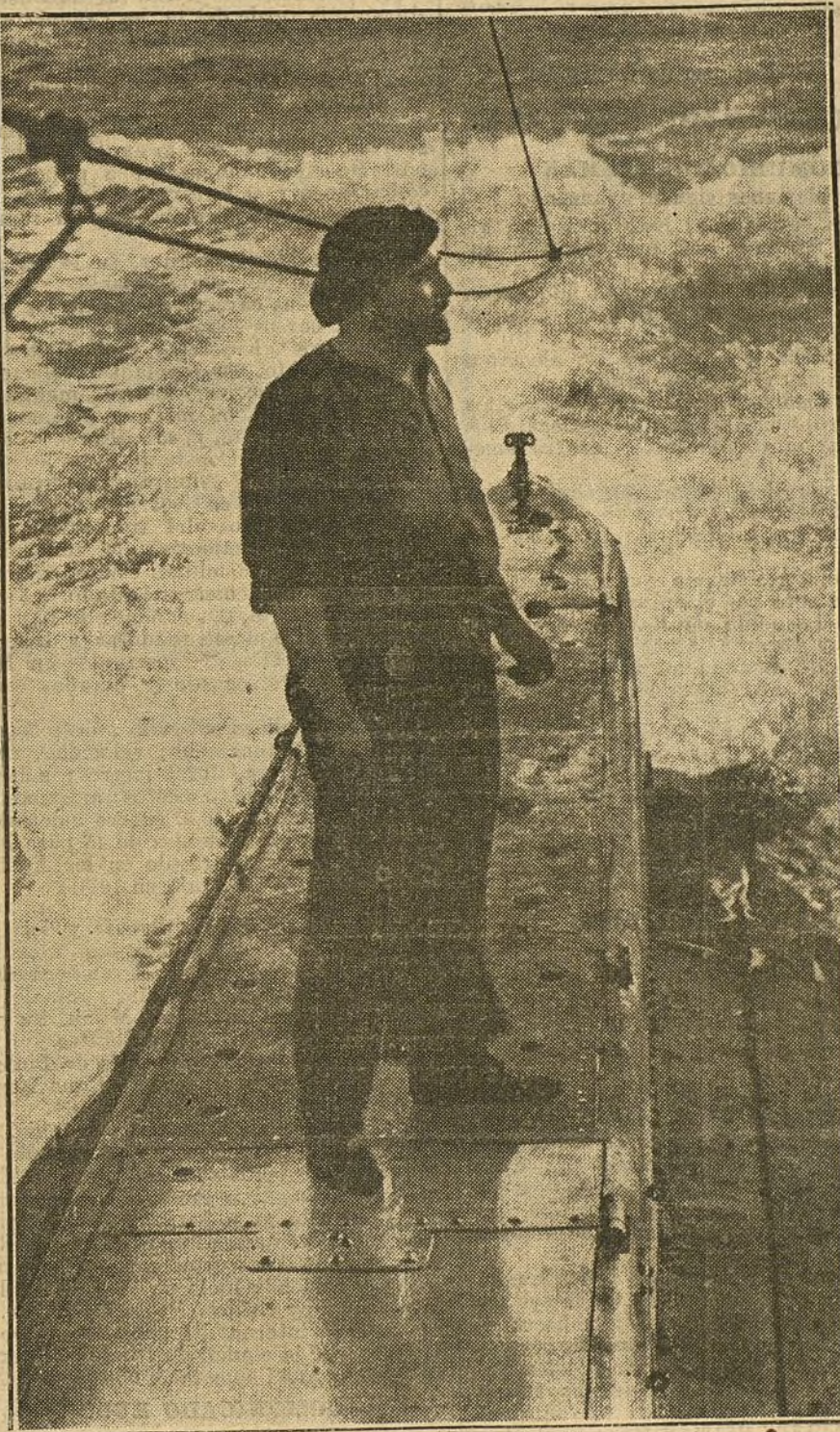
Uno de los heroicos tripulantes del submarino inglés «E-14», que opera en los Dardanelos.

La actividad de las Sociedades anónimas da una buena medida del vigor económico del país; sus balances económicos y sus pagos o repartos de dividendos hablan en este sentido un lenguaje que no puede ser mal interpretado. Estos datos demuestran los recursos no sospechados, y extraordinarios del país y de su capacidad productora. Esta resistencia económica contribuye principalmente a dar a los alemanes esa sensación de seguridad, que tan importante es también en asuntos militares y cuya importancia no debieran los adversarios, por precaución, menospreciar.»