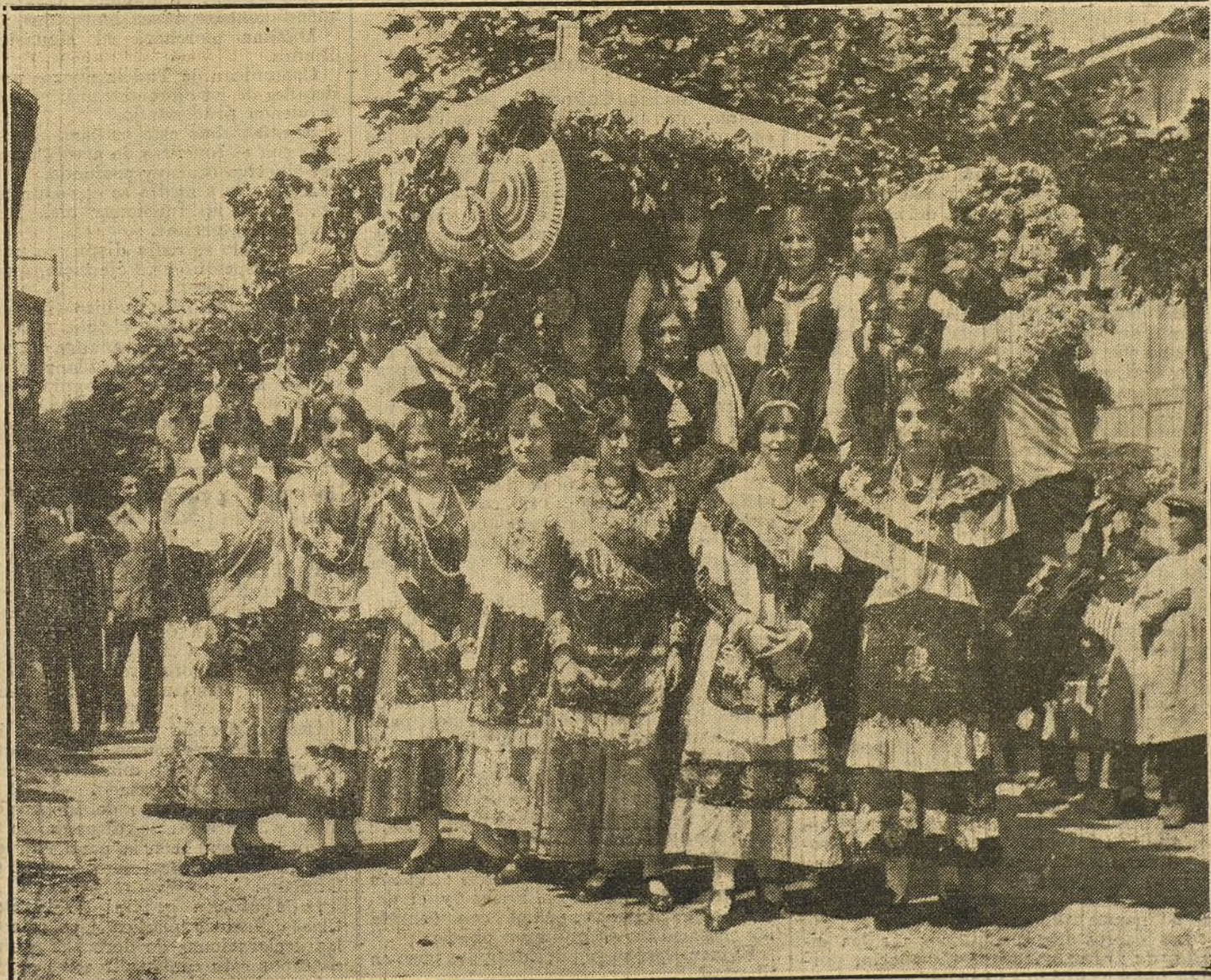
LAS FIESTAS DE TORRELAVEGA.—«Góndola», artística carroza que ha figurado en la retreta.