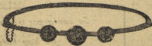
Brasero número 208/85

Brillantes de primera calidad en elegantes monturas de oro de ley 18 quilates, con platino.