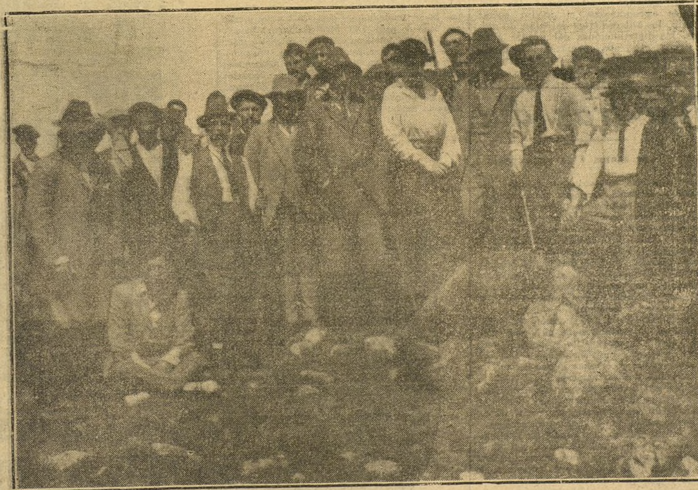
LA CACERIA REGIA DE SAJA.—Grupo de cazadores que acompañaron al Rey en la cacería de osos verificada en los montes de Saja (Santander). En la fotografía aparece uno de los osos muertos por S. M. el Rey.