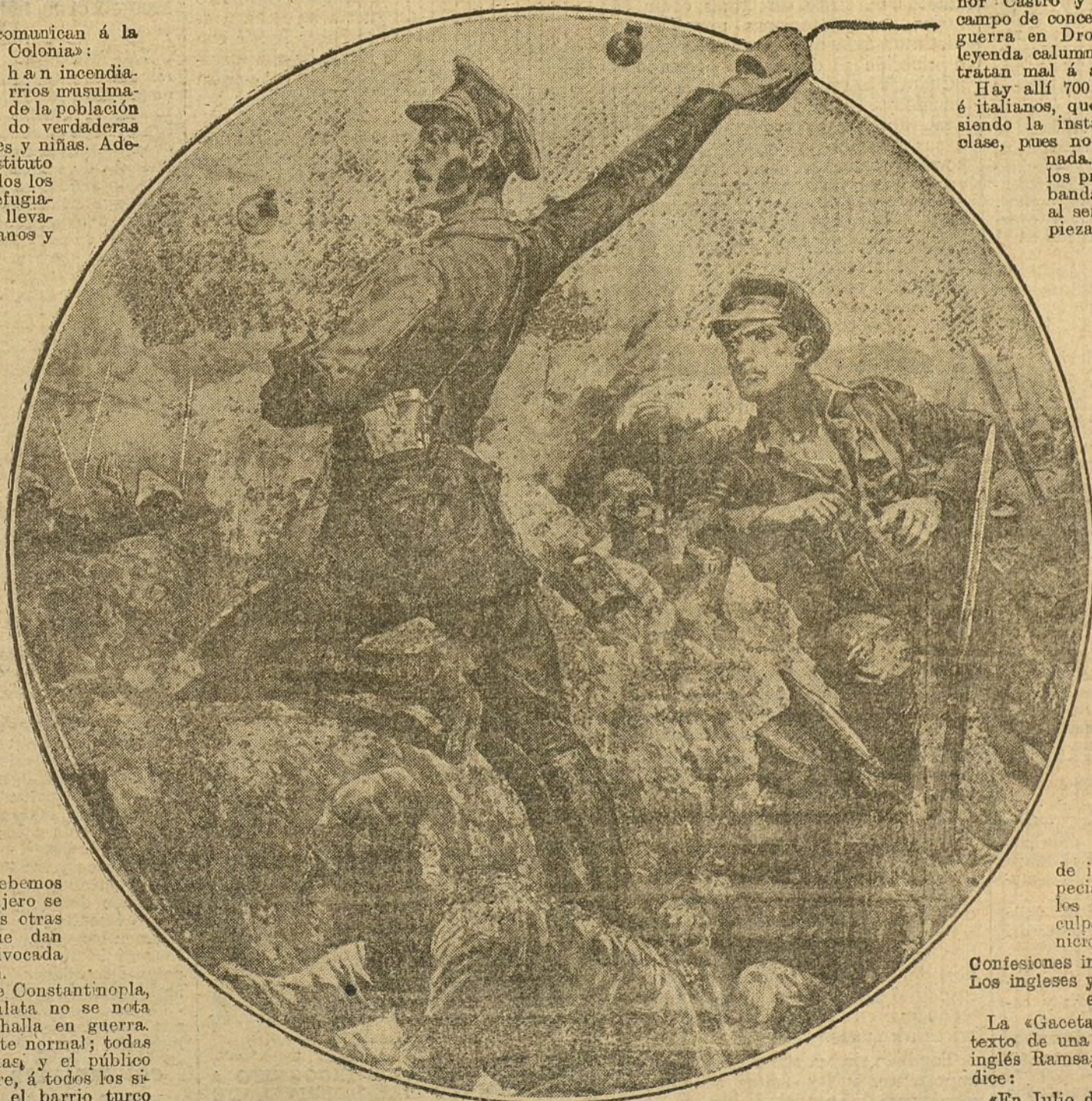
LA LUCHA EN LOS DARDANELOS.—Soldados ingleses defendiendo con bombas de mano una trinchera atacada por las fuerzas turcas en la península de Gallipoli.

«En Julio de 1914 sir Edward Grey hubiera debido tratar diplomáticamente las proposiciones alemanas. Si no lo hizo fue porque ya no estaba en libertad de apartarse de la guerra cuando ésta estallase.