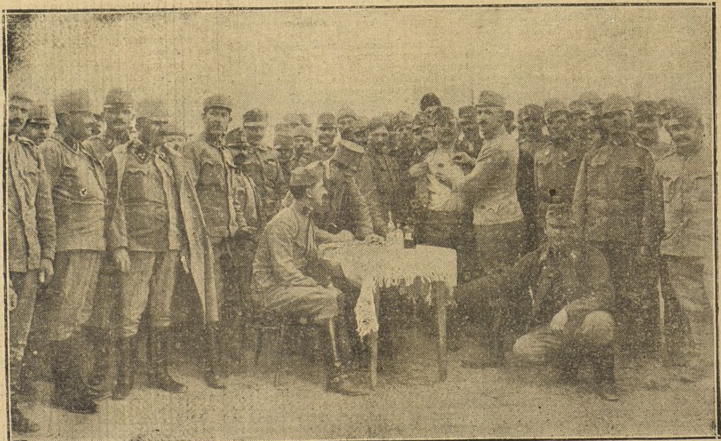
ADEMAS DE LA GUERRA.—Soldados austriacos vacunándose contra el tífus y el cólera, en un campamento de la Polonia rusa.

—La Asociación de los Exploradores persigue un objetivo bien distinto al que usted se imagina. Los jefes é instructores que á ella pertenecen, son consejeros más bien que maestros. Su misión es dirigir la voluntad del muchacho, orientar sus aficiones, descubrir sus actitudes, fijar su atención y formar su carácter. ¿Comprende? Los pueblos más adelantados son aquellos cuyos ciudadanos conocen y practican á conciencia sus deberes. No es preciso que todos sean hombres-cumbres, ni mentalidades poderosas.