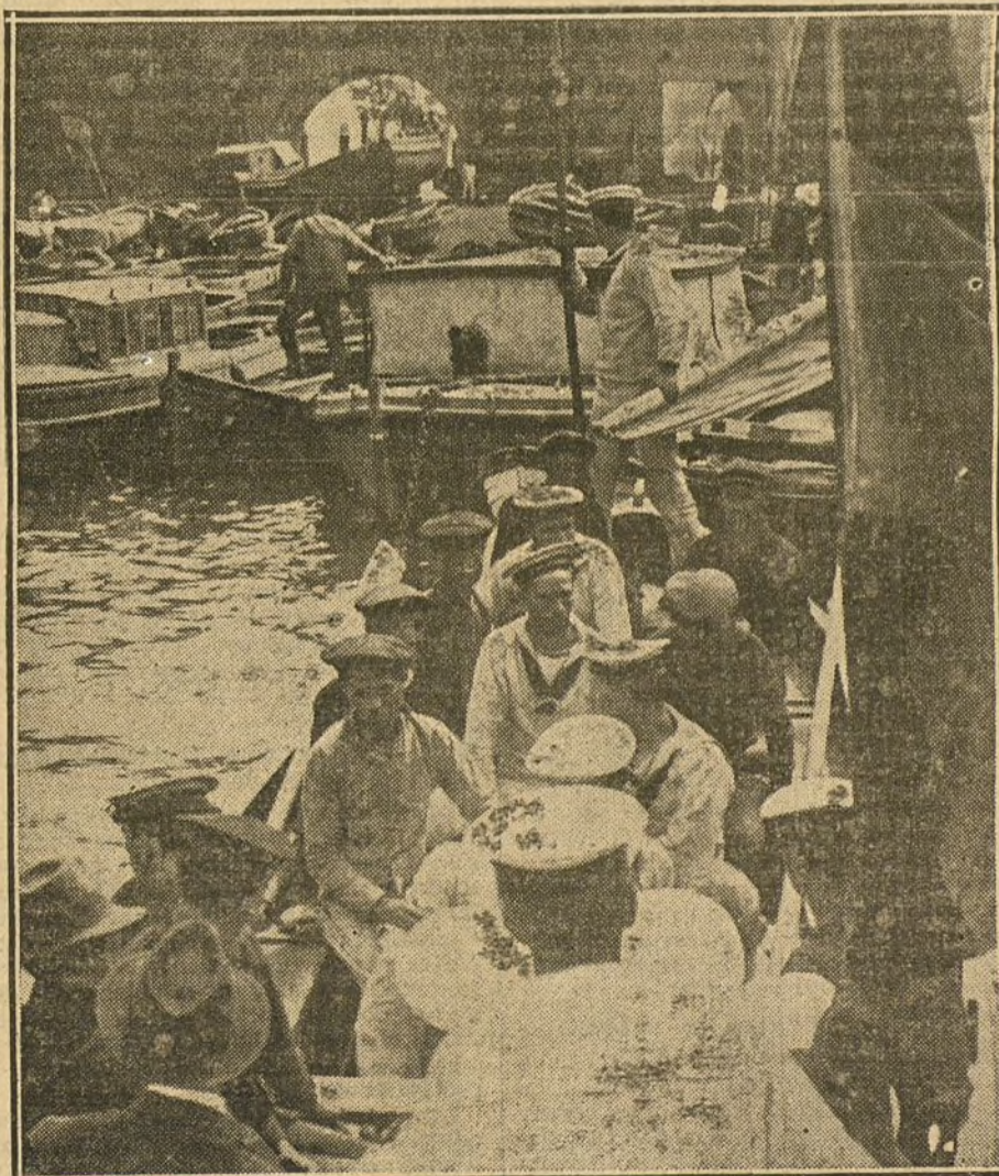
RESCATE DE CAUTIVOS.—Tripulantes y pasajeros chinos e ingleses del vapor inglés «César», que encalló hace tres meses en la bahía de Almarza (campo moro), y que gracias a las gestiones de nuestro comisario general han sido puestos en libertad.