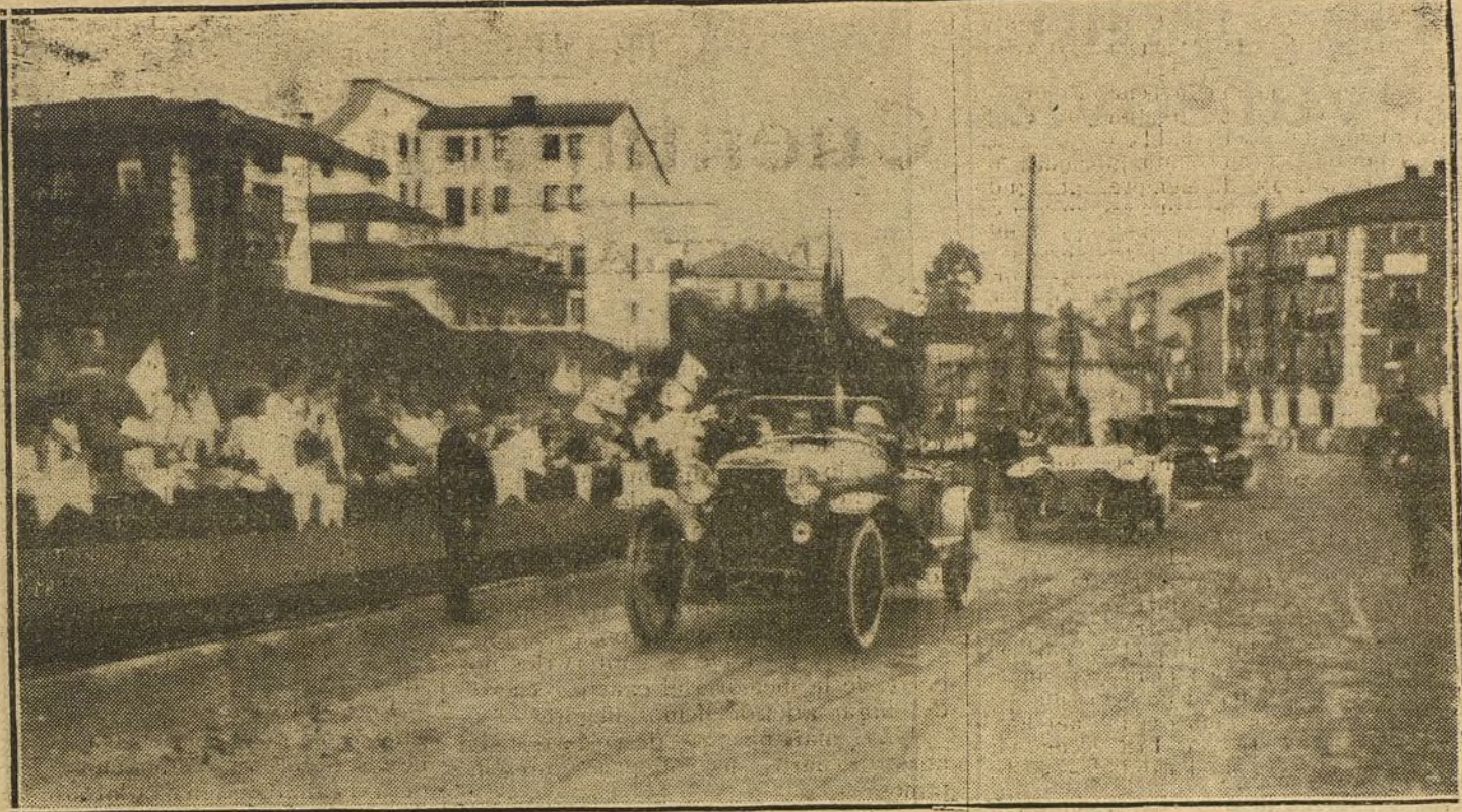
LOS REYES EN GUERNICA.—Enthusiasta recibimiento tributado a SS. MM.

—Buena se le prepara al alcalde de Madrid! —¿Alguna zanaquilla? —No, señor. Un conflicto de los más terribles que puede haberse. —¿A ver! ¿A ver! —Figúrese usted que un periódico de la noche ha puesto en labios del alcalde frases tan duras como estas: «Los panaderos tienen razón». «El sobrepeso del pan sirve para sobornar a los guardias municipales, a los inspectores y a los diez tenientes de alcalde...» —¿Qué atrocidad! —Y los tenientes de alcalde han convenido sorprenderse en dos grupos. —¿Para qué? —¿Qué sé yo! Quizá sea un grupo para desafiar al alcalde y el otro para llevarle a los Tribunales. —Dios mío, en qué conflicto se ve metido Pelayo por su mala cabeza. —La crisis agrícola ha alcanzado caracteres alarmantes en algunos pueblos. —Eso dicen los periódicos. —Y es verdad, además. Las representaciones de aquellos pueblos se han dirigido al Gobierno para que ven de remediar la gravedad del asunto. —¿Qué ha hecho el Gobierno? —Pero, hombre de Dios, ¿qué va a hacer el Gobierno en esta crisis? Nada. ¿No ve usted que está muy ocupado con los contratos de artistas, bailarinas, músicos y dependencia para el teatro Real, del cual va a ser empresario el Estado? —¿Todo eso es música? —Lo que es música para el Gobierno es la crisis agrícola. —Por lo que se ve, Jacinto Benavente fué objeto de estruendosas ovaciones al terminar el discurso