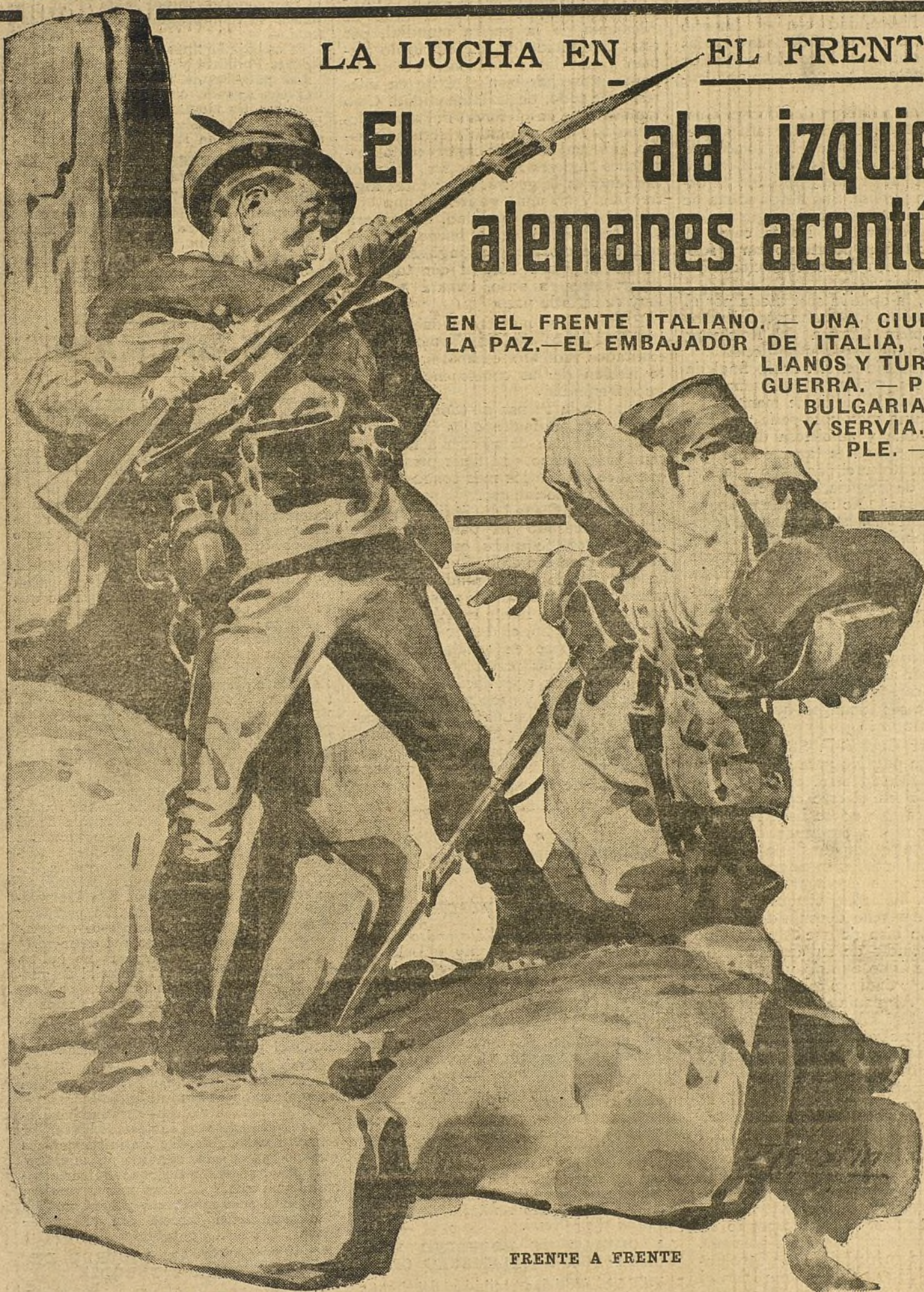
FRENTE A FRENTE

EN EL FRENTE ITALIANO. — UNA CIUDAD AMENAZADA. — EL PAPA Y LA PAZ. — EL EMBAJADOR DE ITALIA, SR. TITTONI, EN VICHY. — ITALIANOS Y TURCOS. — LOS BALKANES ANTE LA GUERRA. — PREPARATIVOS MILITARES EN BULGARIA. — LA AMENAZA A RUMANIA Y SERVIA. — CONTESTACION A LA MULTIPLE. — NOTICIAS DE GIBRALTAR. — OTRAS NOTICIAS