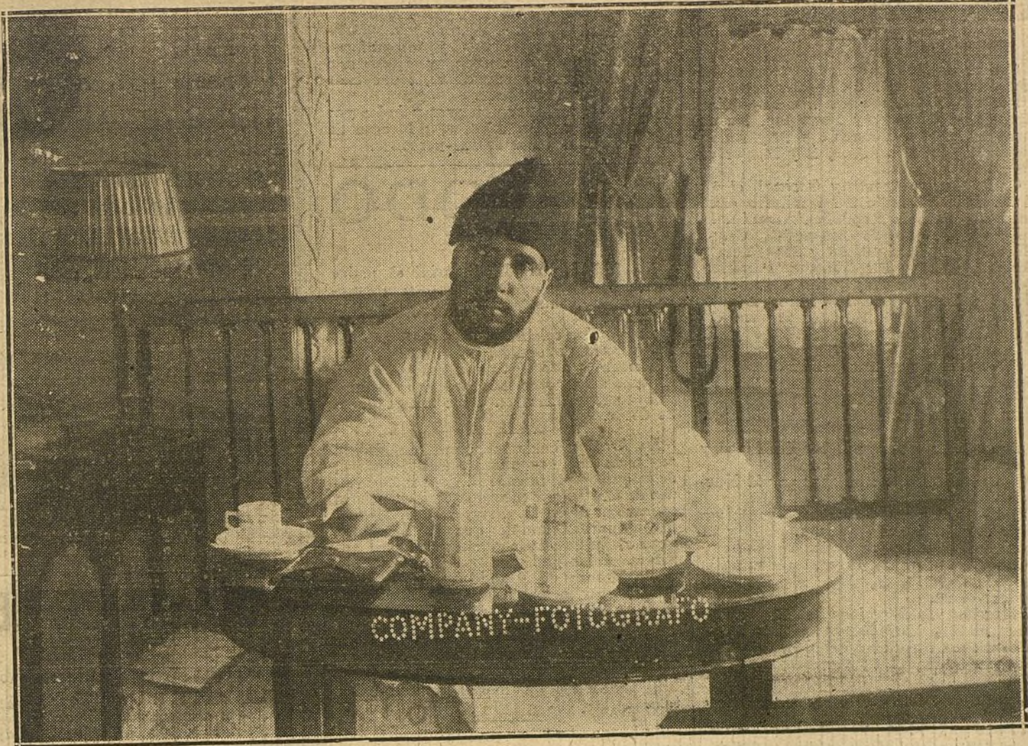
MULEY HAFID en su cuarto del Palace Hotel.

Mis pies están elevados, tan elevados, que mi mano no encuentra mano amiga que asir, ni mis ojos pueden olvidarse en otros ojos.