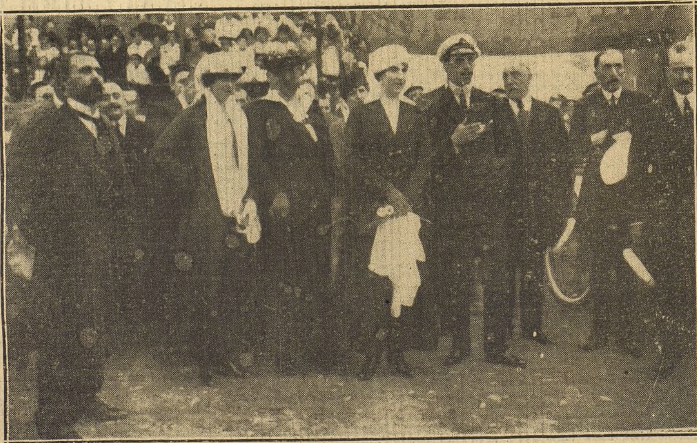
LOS REYES EN GUERNICA.—La familia Real saliendo de la fábrica de pistolas. (Fot. VIDAL.)

Con gran asombro de Su Majestad lo hablamos de sus poemas, algunos de los