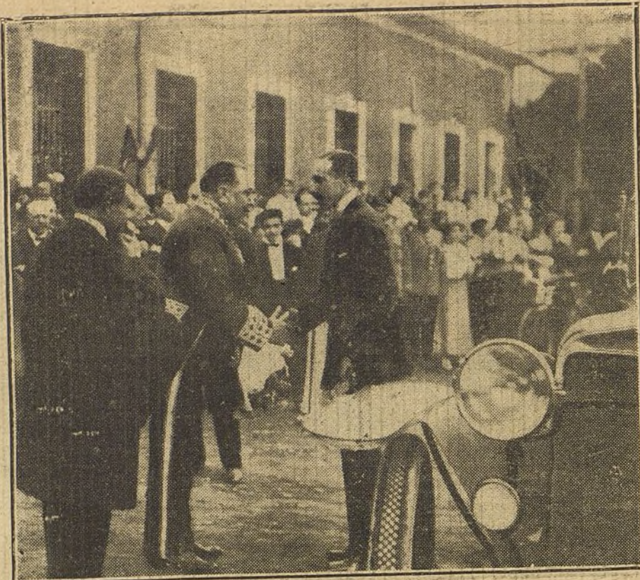
LOS REYES EN GUERNICA.—El alcalde de Guernica saludando á S. M. el Rey.

—Esto vale la pena!—murmuro sonriendo—. Esto hay que leerlo detenidamente.—Y con el regodeo del que se reserva un placer retardando su voluptuosidad, meto las manos en los bolsillos de mi ulster de viaje, saco mi petaquilla de goma, llena de riquísimo tabaco turco, pipa y el encendedor automático; comienzo á cargar y descargar chirimboles; los devuelvo á mis bolsillos, menos la pipa, á la que di tres fuertes chupadas y man-