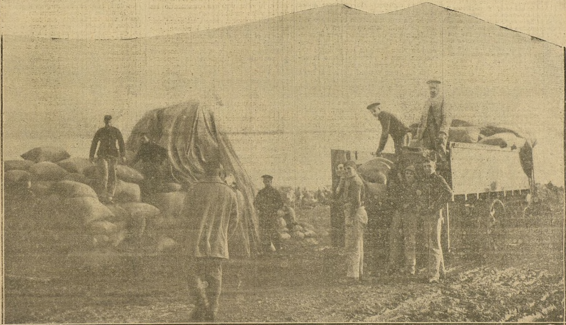
Soldados ingleses descargando carros de aprovisionamientos, en un campamento de Bélgica.

ALEMANIA Y LOS ESTADOS UNIDOS.—ARTICULO CONCILIADOR.—EL PLEITO DEL «ARABIC».—LOS APROVISIONAMIENTOS DEL EJERCITO RUSO.—EN LOS ALREDEDORES DE GRODNO.—LA ACTITUD DE LOS BALKANES.—EL ACUERDO TURCO-BULGARO.—LA GUERRA ECONOMICA.—PREPARATIVOS MILITARES.—LAS VÍCTIMAS DE LA AVIACION.—NOTICIAS DE ULTIMA HORA