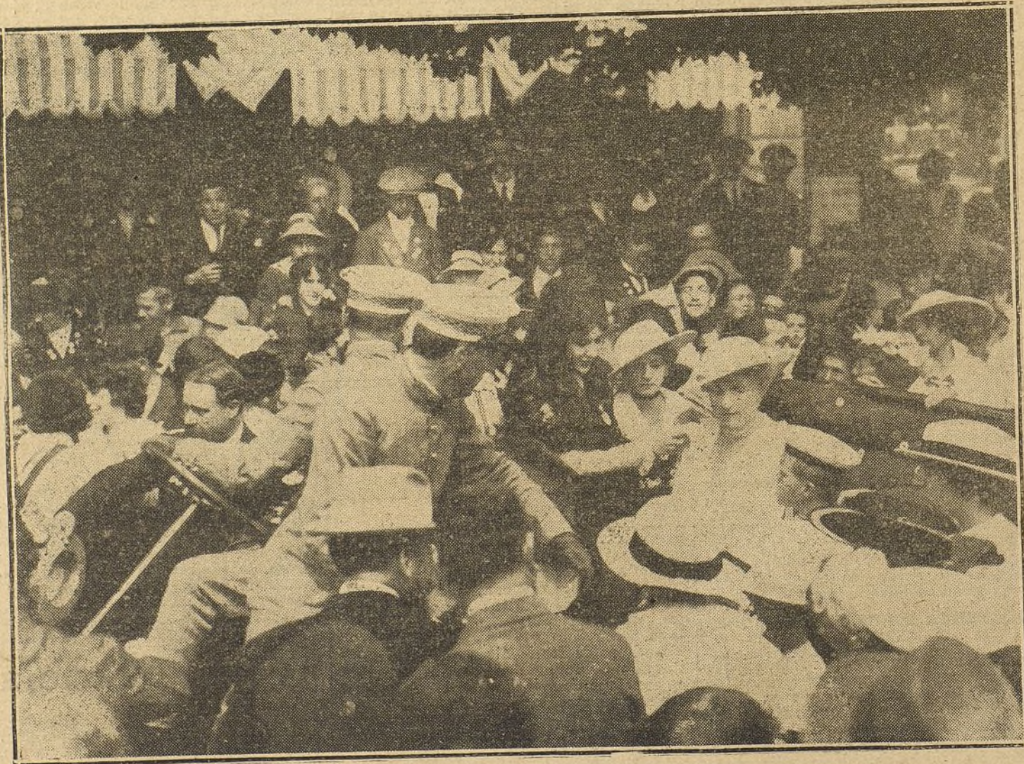
LA FIESTA DE LA FLOR EN SANTANDER.—S. M. la Reina y el Príncipe de Asturias aclamados por el pueblo. La Argentinista prendiendo flores en el traje de S. A.

Se habla de protestar y de presentar reclamaciones por los grandes perjuicios que causa a la navegación la manera de proceder de los ingleses.