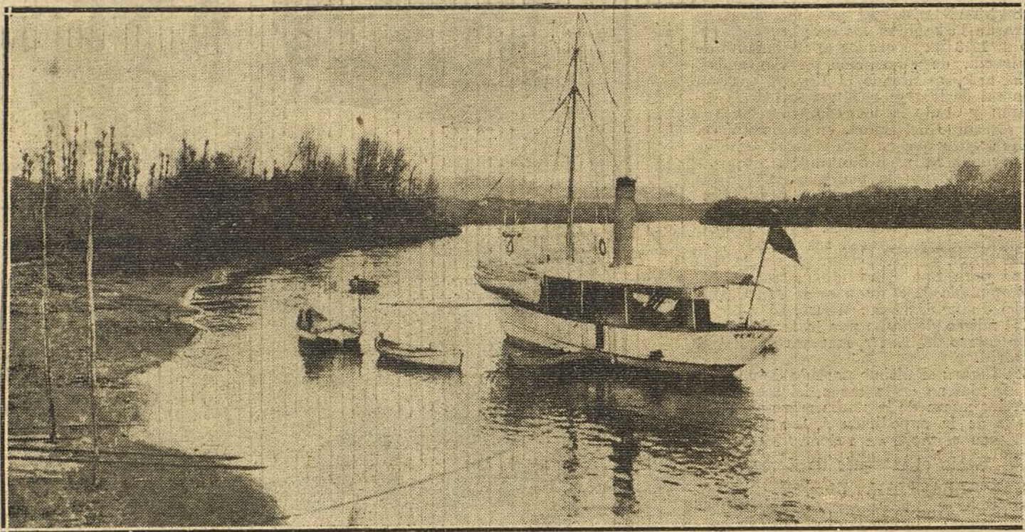
PANORAMAS ESPAÑOLES.—Vista de las márgenes del río Miño desde la ciudad de Tuy.