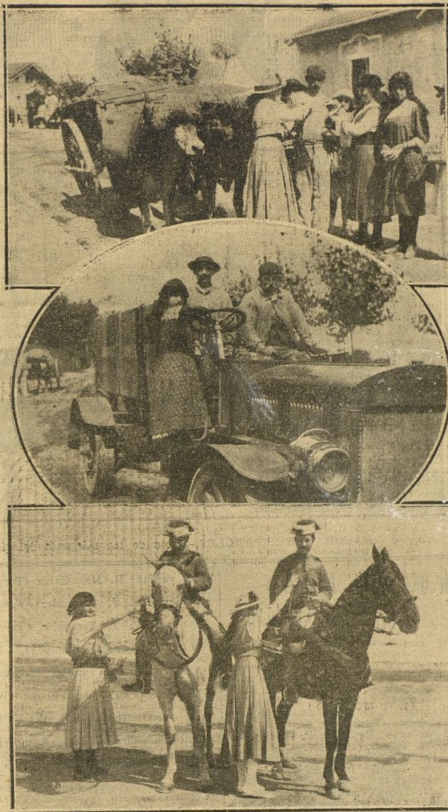
LA FIESTA DE LA FLOR EN SANTANDER. — Señoritas postulando por casafueras de la población. Tres curiosos aspectos de la Fiesta.

que sigue recibiendo peticiones de viticultores y vinicultores respecto a la exportación de nuestros vinos.