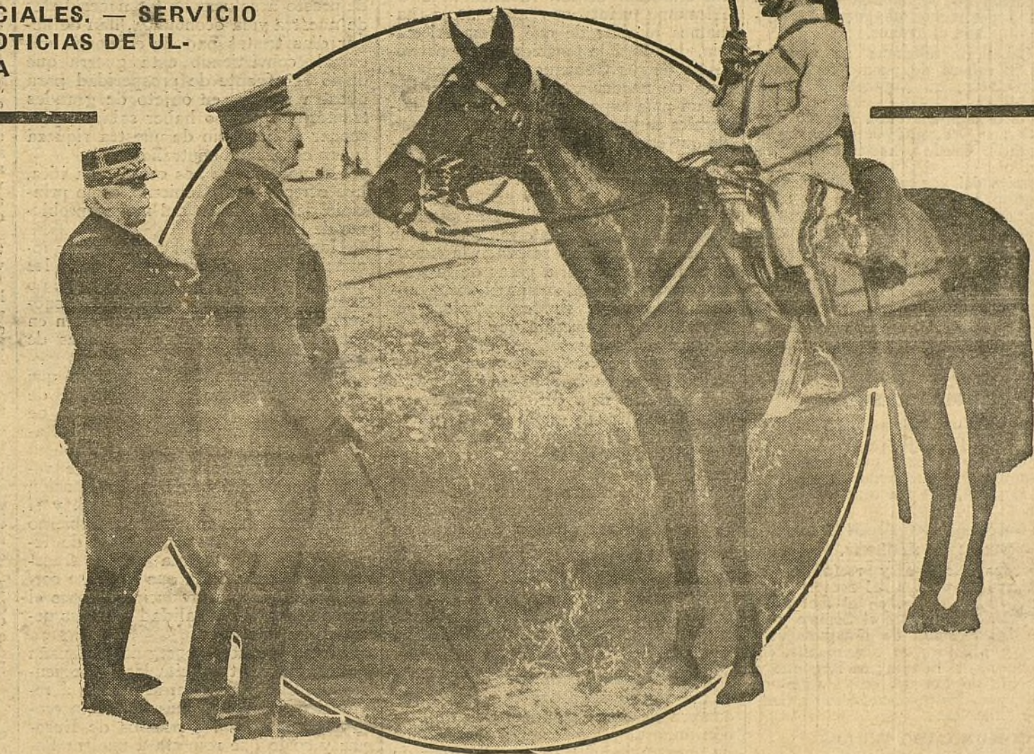
Lord Kitchener y el generalísimo francés Joffre revistando las tropas en la línea de fuego del Norte de Francia.

«Hace medio año nos reunimos ya bajo la impresión de una gran angustia, y dijimos al Gobierno en sesiones secretas lo que no pudimos decir en público. El pueblo quiere enmendar su conducta, y nos envía aquí con la orden de decirle al Go-