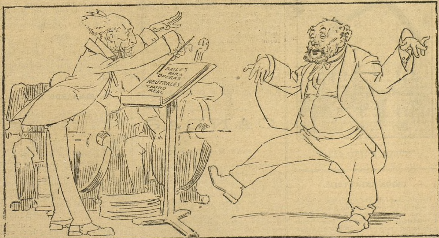
LOS PRIMEROS ENSAYOS DEL REAL

NUMERO DEL TELEFONO DE LA ADMINISTRACION DE «LA TRIBUNA» (PLAZA DE CANALEJAS, 6): 5.551