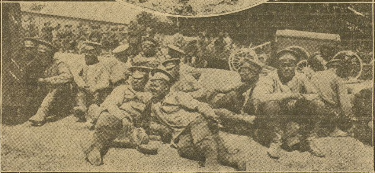
LOS ULTIMOS COMBATES EN LA GALITZIA.—De arriba abajo: trinchera rusa destruida después de un violento encuentro; traslado del rancho para los prisioneros; soldados rusos prisioneros de los austriacos refugiados en un campamento provisional.