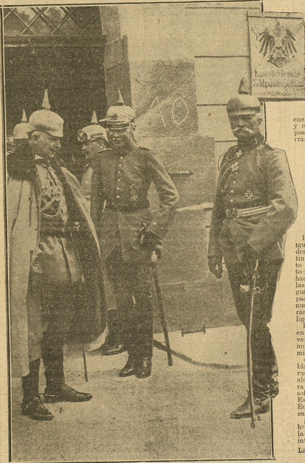
El Emperador Guillermo con el heroico general Mackensen, uno de los audillos que han dirigido el avance alemán en Oriente.

Con ayuda de un simple cálculo aritmético se pueden fijar los datos de las