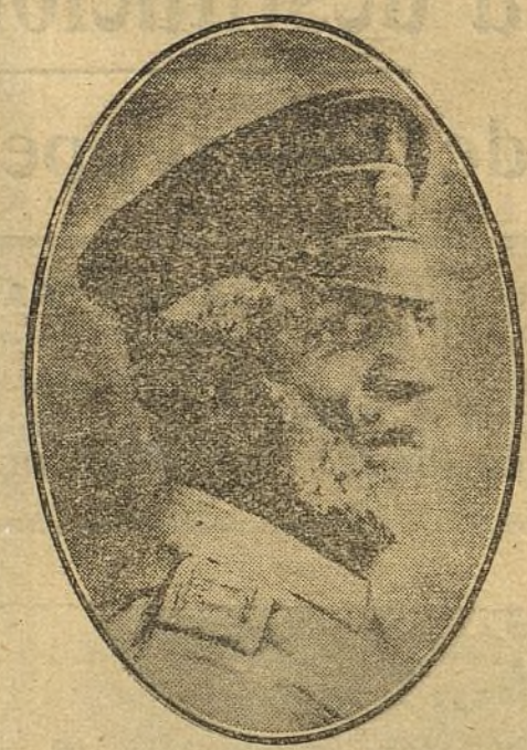
El generalísimo ruso, Gran Duque Nicolás, en un momento de su vida.

Ante los ojos de toda Rusia, Vuestra Alteza ha dado pruebas, durante la guerra, de un valor inquebrantable, que hizo nacer profunda confianza y los votos ardien-