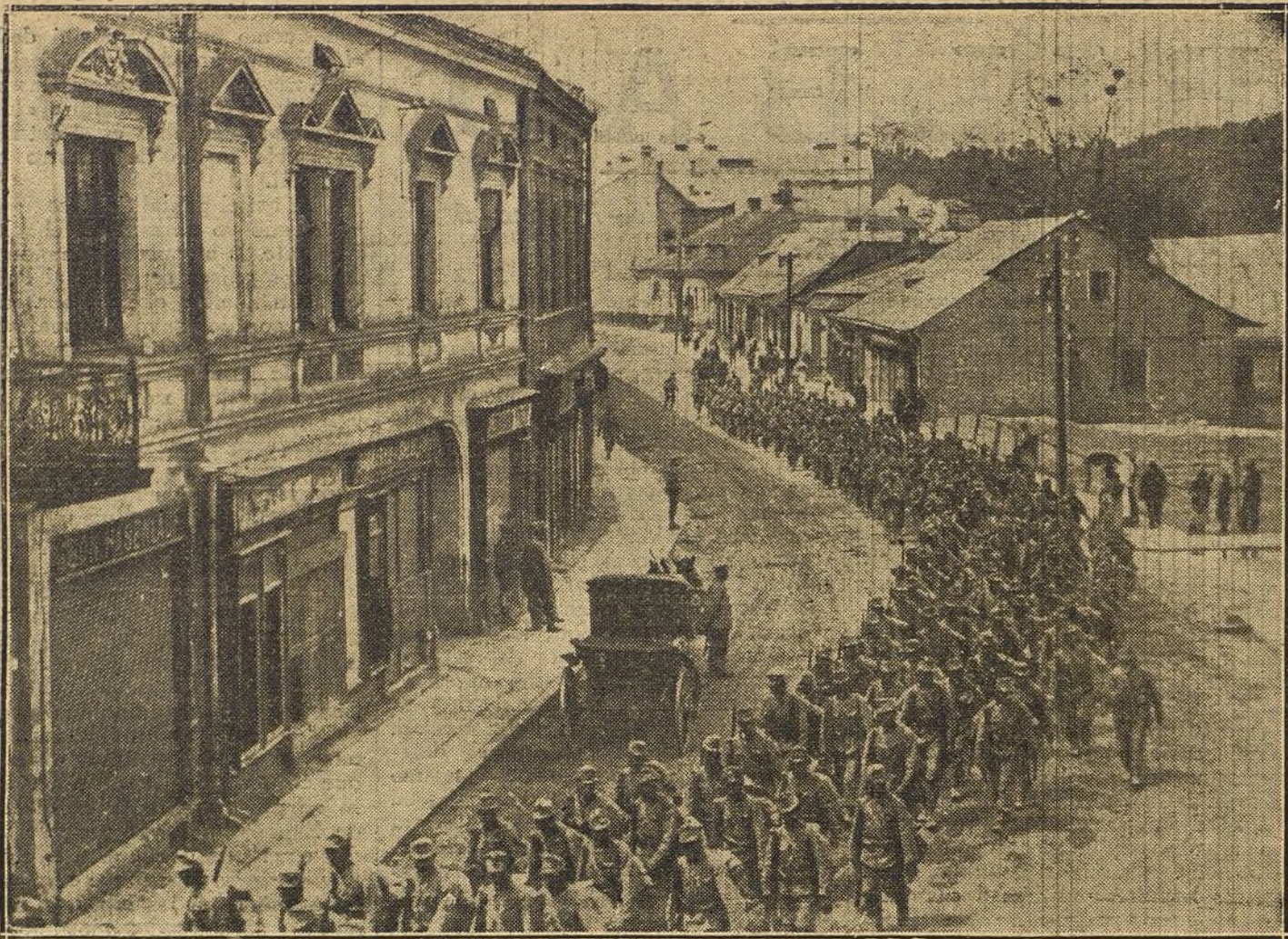
LA GUERRA EN ORIENTE.—Desfile de un regimiento austriaco por las calles de Przemyśl después de la reconquista de dicha plaza.

Finalmente, se adhiere á esta opinión también el conocido Manual del Derecho internacional francés Bonfils-Fauchille, el cual, en su reciente edición publicada al comienzo de la guerra actual, presenta entre los «medios de combate prohibidos» la incorporación de salvajes á ejércitos civilizados ó el empleo de tropas auxiliares que desconozcan las leyes de la guerra (9). Ciertamente cree Bonfils que esta regla tendrá en Europa poca aplicación; pero, por desgracia, la ac-