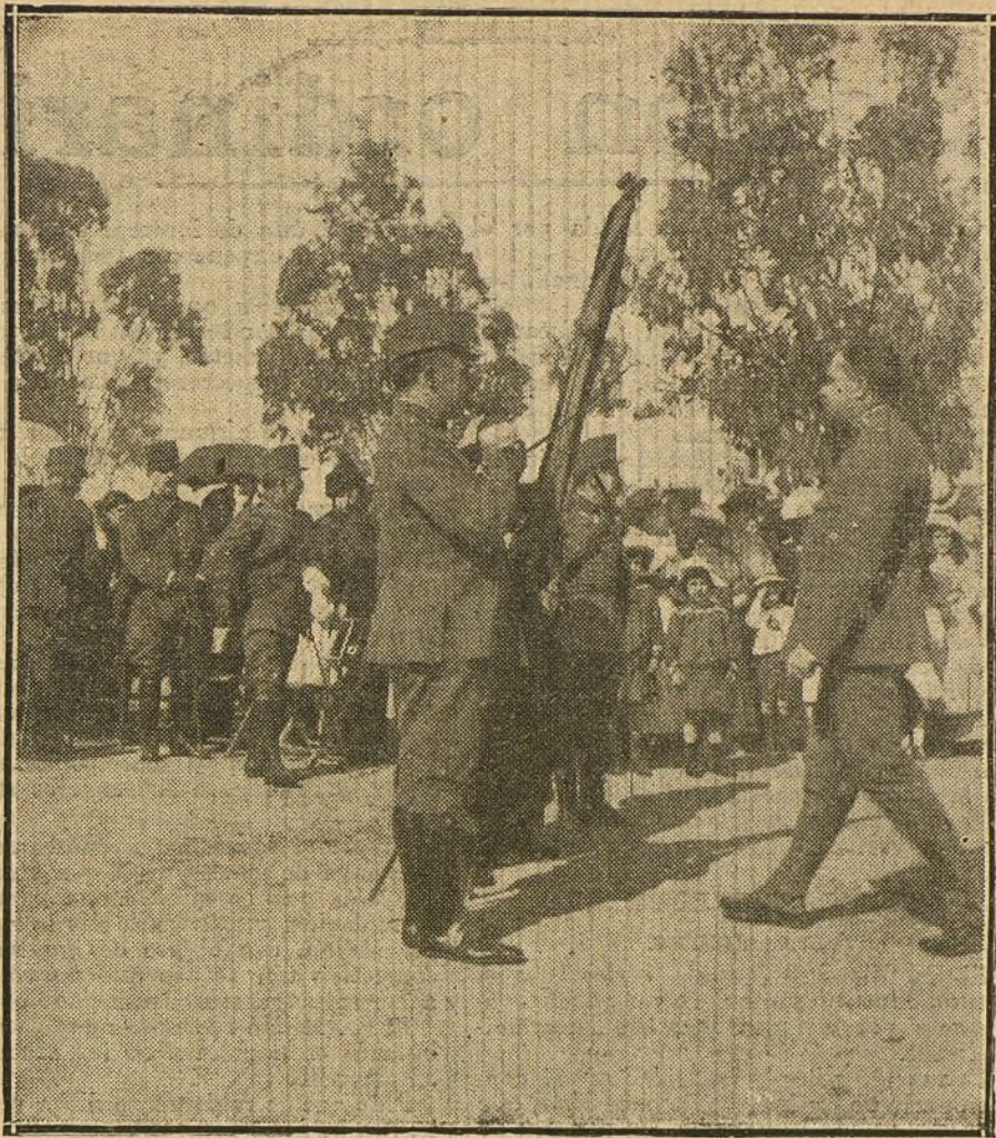
LA JURA DE LA BANDERA EN CACERES.—Soldados del cupo de instrucción recientemente incorporados a filas jurando la bandera.

Muy interesantes resultan las observaciones tácticas sobre Dixmuiden, tomo I, página 151, en las que se dice textualmente: «Dixmuiden resulta difícil de tomar