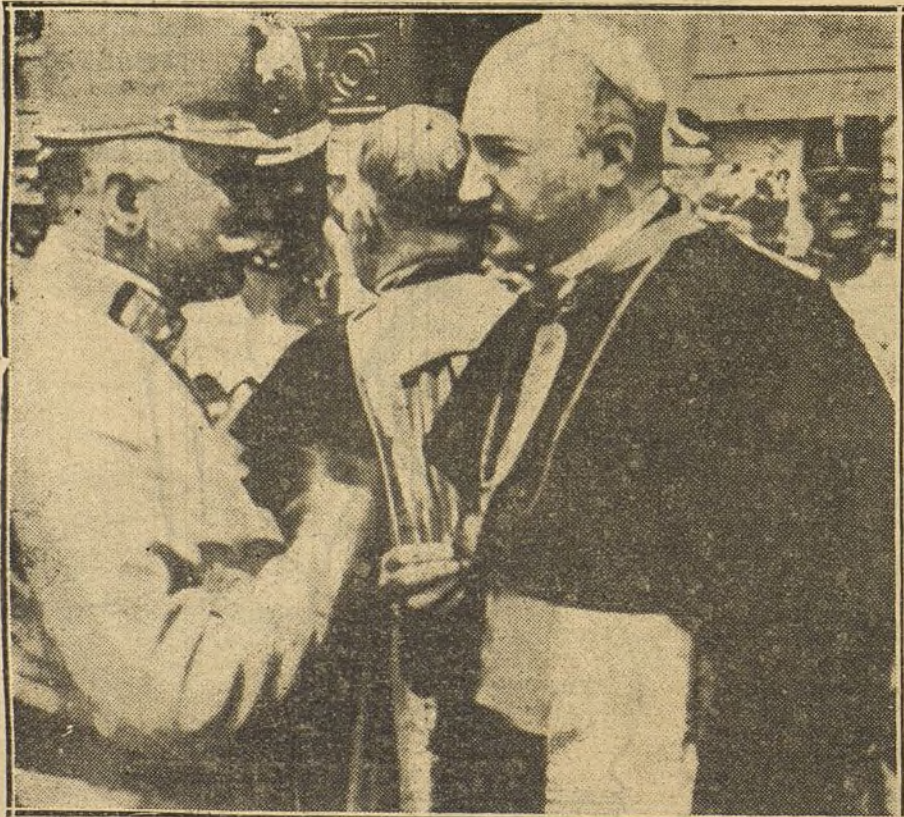
LA GUERRA EN ORIENTE.—El arzobispo católico de Lemberg conversando con el jefe del Estado Mayor austriaco poco después de la victoria de las tropas austro-húngaras.

¿No hay en el siglo XX ningún inglés que piense de esta manera? Aún permanecen callados: que se oiga también su voz