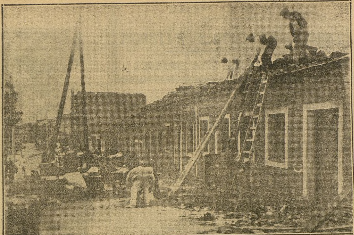
EL HUNDIMIENTO DE HOY EN LA CALLE DE BRAVO MURILLO.—Obreros y vecinos de las casas donde ha ocurrido el suceso desalojando el mobiliario.

Los visitantes recorrieron toda la fábrica, interesándose mucho el Rey por la prosperidad de la industria española.