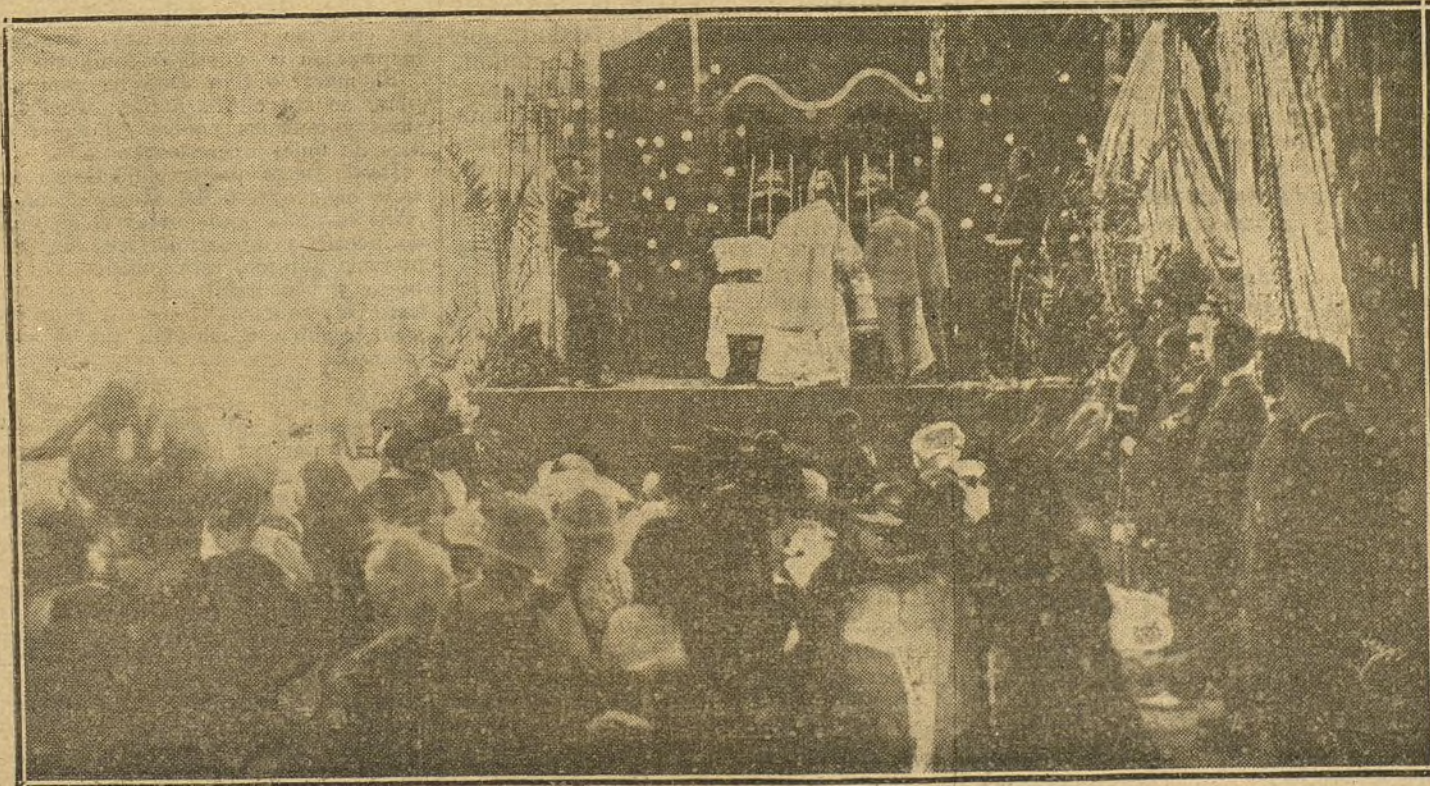
EN MONTE BARRIO DE LA SALUD.—Misa de campaña celebrada con motivo de las fiestas.