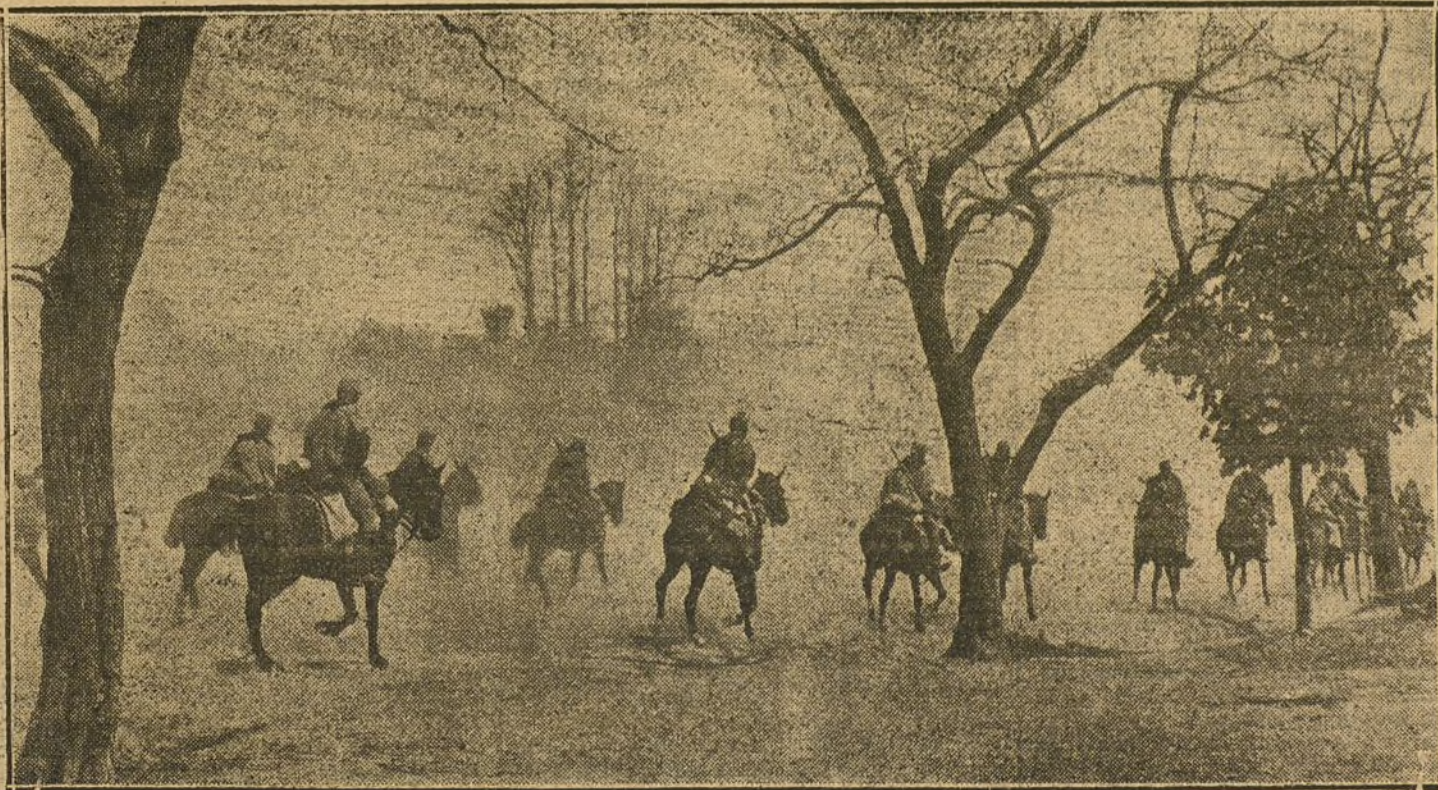
Avance de la Caballería austriaca en el Tirol.

«El ejército del general Hindenburg progresa victoriosamente en la batalla