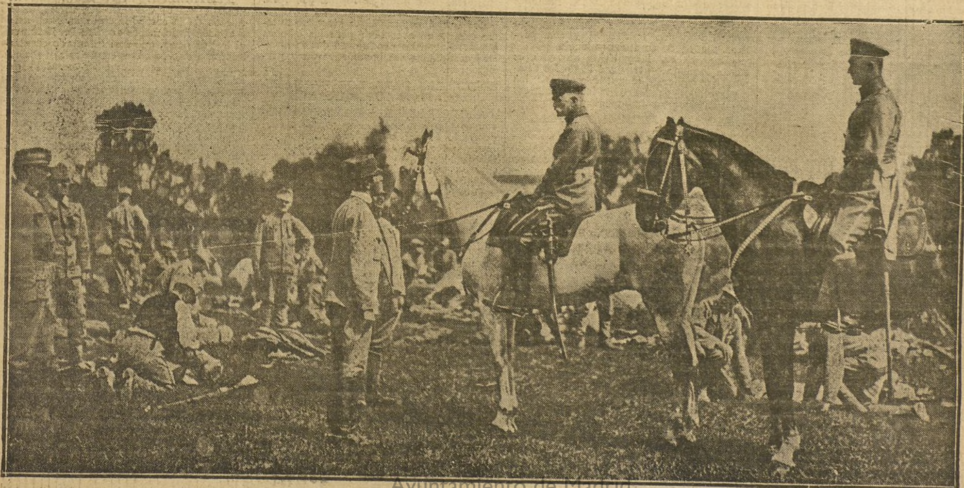
El feldmariscal von Mackensen revistando las tropas de un campamento austrohúngaro.

drá reanudar ninguna ofensiva de importancia. Inglaterra tiene el deber, en vista del esfuerzo hecho por su aliada Rusia, de examinar sus propios recursos y tomar medidas que le permitan lo más pronto posible entrar en la lucha con todo su peso. Es muy probable que los acon-