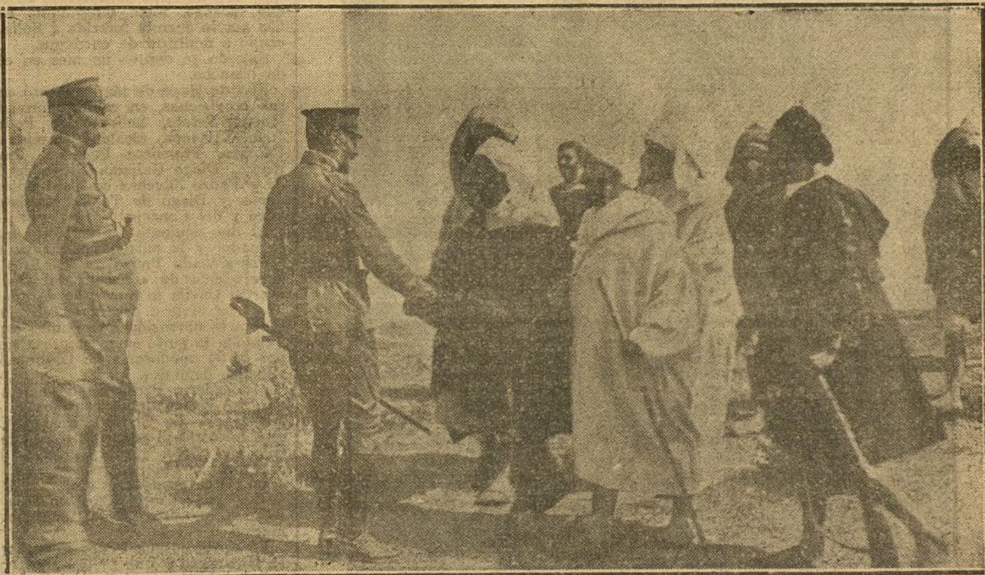
LA SUMISION DE LOS CABILEÑOS DE BIUTZ.—El comandante general de Ceuta, Sr. Milán del Bosch, saludando á los jefes de las cabilas que han aceptado la paz, en las afueras de la posición avanzada de Cudia-Federico.

NUMERO DEL TELEFONO DE LA REDACCION Y TALLERES DE «LA TRIBUNA» (JARDINES, 4, 6 Y 8): 4.444