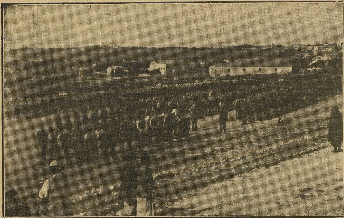
LOS TURCOS EN LA GUERRA.—Soldados de la octava división turca, en Jerusalén, dirigidos por oficiales alemanes.

que Su Magestad sea informado de la verdad de todo ello, é como Príncipe agradecido hos dé el premio é el galardón de tan gran servicio é aumento de sus rentas, como espero en Nuestro Señor de vuestra ida haréis.