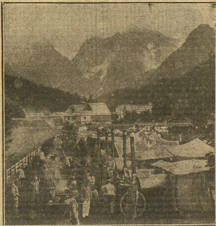
EN EL FRENTE ITALIANO.—Una fábrica de pan en un campamento del ejército austro-húngaro.