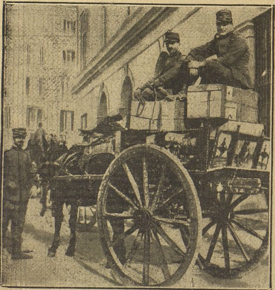
LOS ITALIANOS EN LA GUERRA.—Tropa italiana conduciendo municiones al frente de...

Item: Que sabéis cuánto servicio a Su Magestad se hace con saber secreto é fin del Desaguadero de la dicha laguna, si llega a la mar del Norte, como porque es una de las cosas de más importancia que por acá hay, y que más acortará el camino de estos reynos a España, y aun para el efecto de la especería, que en la buena ventura de Su Magestad tengo esperanza de ver muy pronto descubierta; por la parte que vais, tenéis mucho cuidado, por todas las vías é maneras que pudieses, sobre el secreto é fin de todo ello, mirando a qué parte sale, é en qué rumbo é parte, é cuántos grados tiende; lo qual, con toda brevedad, me haréis dello saber, para