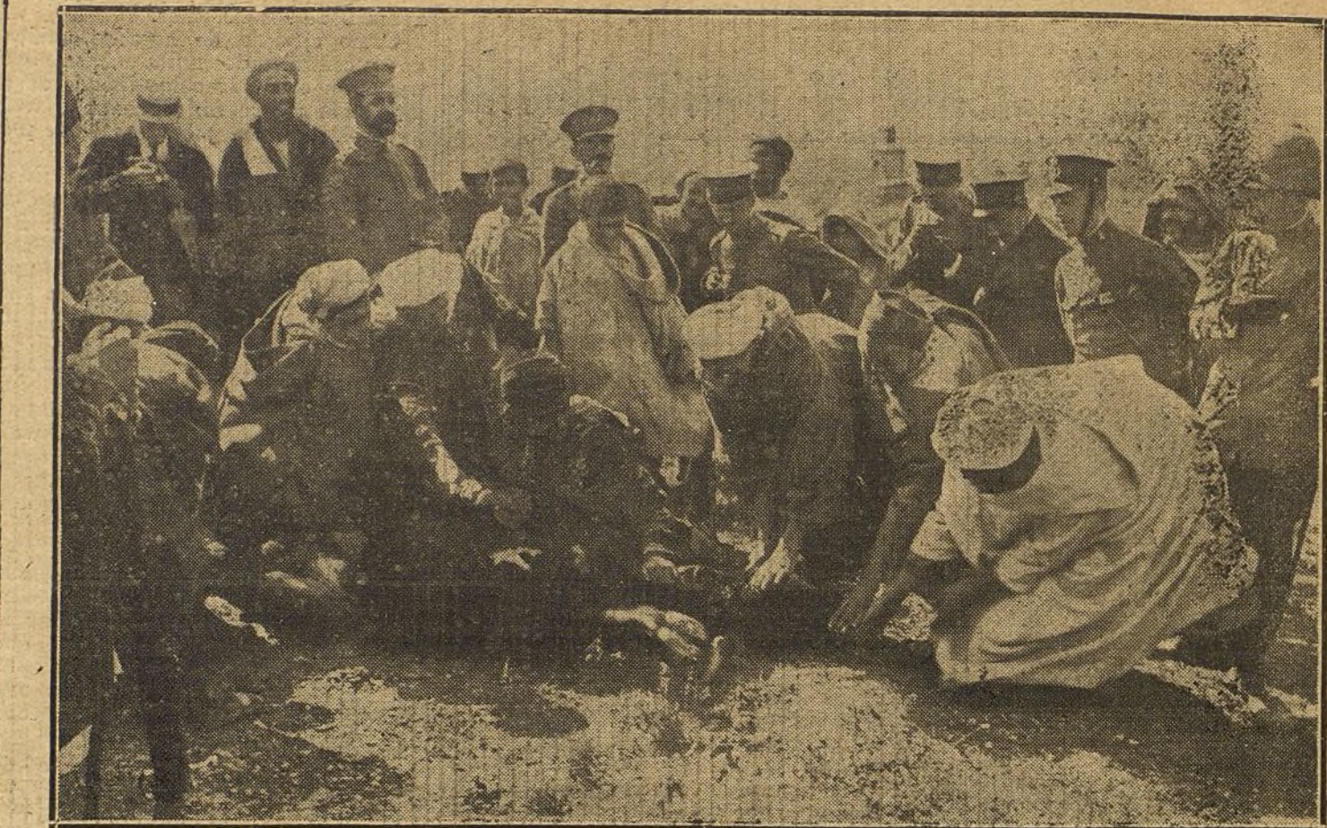
NUESTRA POLITICA EN MARRUECOS.—Sacrificio de una res, símbolo de sumisión, con que los jefes de las tribus fronterizas a Tetuán celebraron la paz y su reconocimiento a las autoridades militares españolas