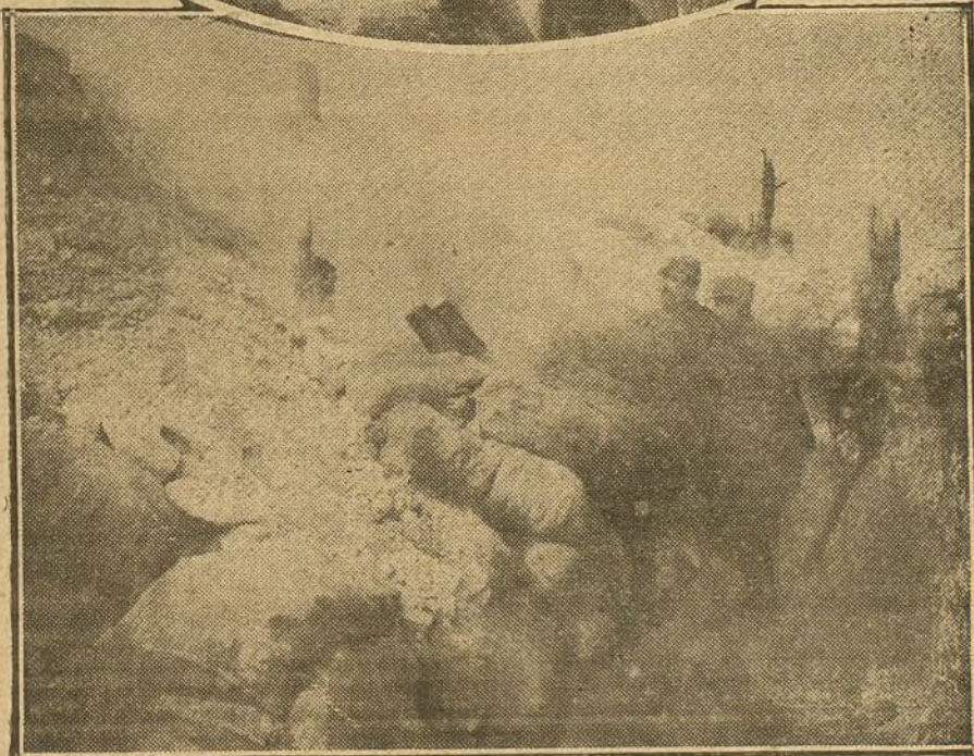
En el óvalo, soldados franceses cargando un barreno de dinamita para el lanzamiento de proyectiles. Debajo, el momento de la explosión.

preparación se concede alguna vez en ceremonia pública, la dirección de la aeronáutica militar estará fuera de concurso.