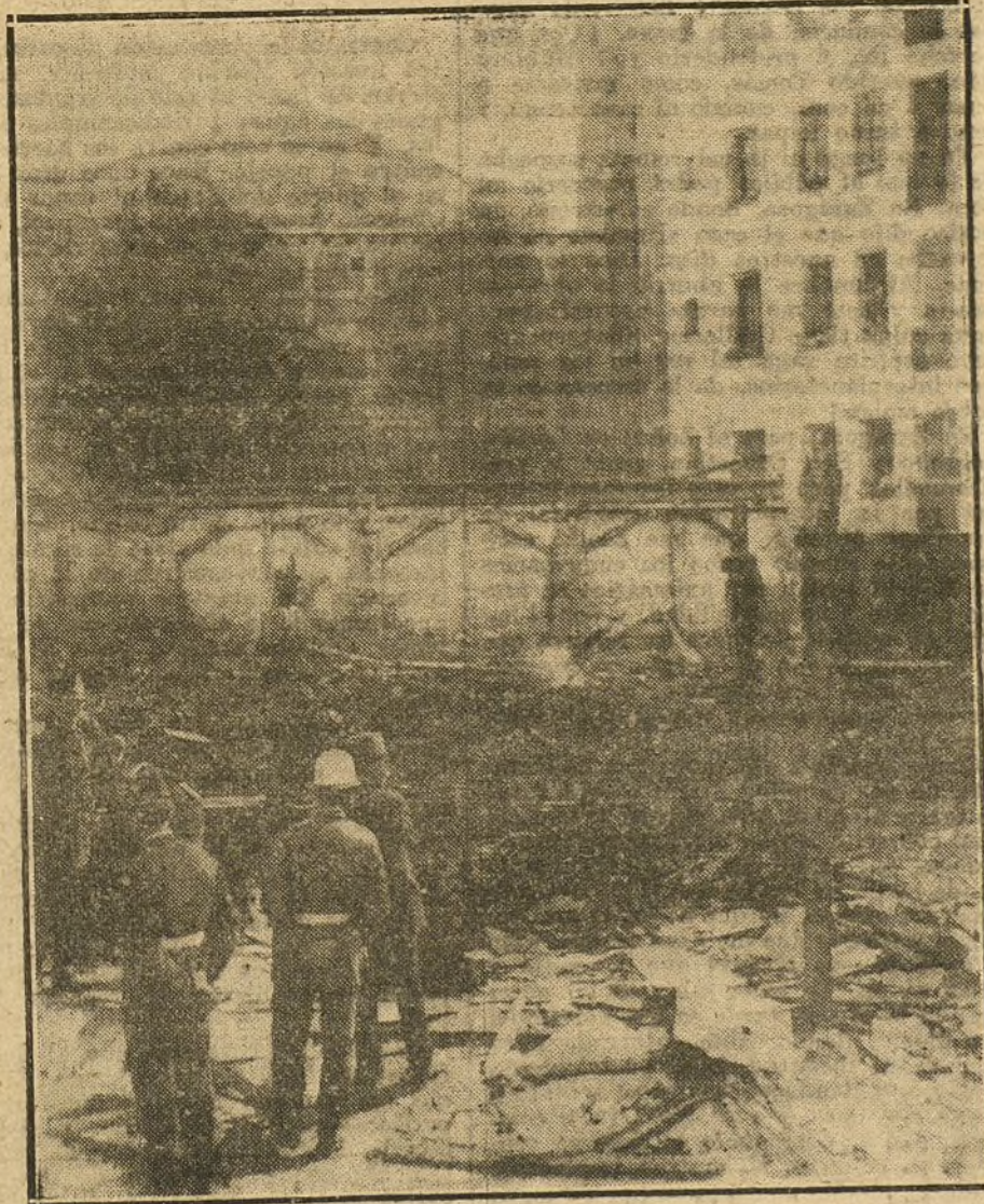
EL INCENDIO DE ESTA MADRUGADA.—Aspecto de las casas de la calle de la Unidad, que se han incendiado esta madrugada, durante la extinción del siniestro.

PARA TODO LO REFERENTE A PUBLICIDAD FRANCESA EN «LA TRIBUNA», DIRIGIRSE A NUESTRA AGENCIA EN PARIS: 22, RUE VIVIER, 22