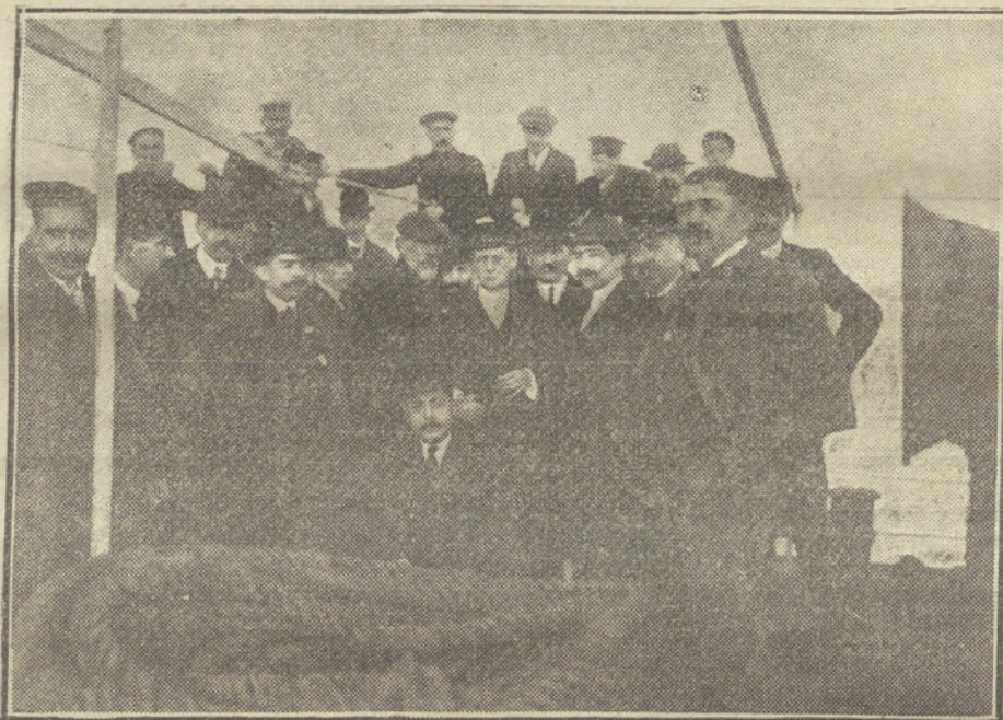
Don Joaquín Dicenta recibiendo el saludo de la Junta directiva de la Asociación de la Prensa y de varios periodistas de La Coruña á bordo del vapor "Dolores".

Ayer se recaudaron por pases de libre circulación de carruajes, 1.900 pesetas, con destino á la Asociación Matritense de Caridad, y 400 pesetas para el Ayuntamiento, por alquiler de sillas.