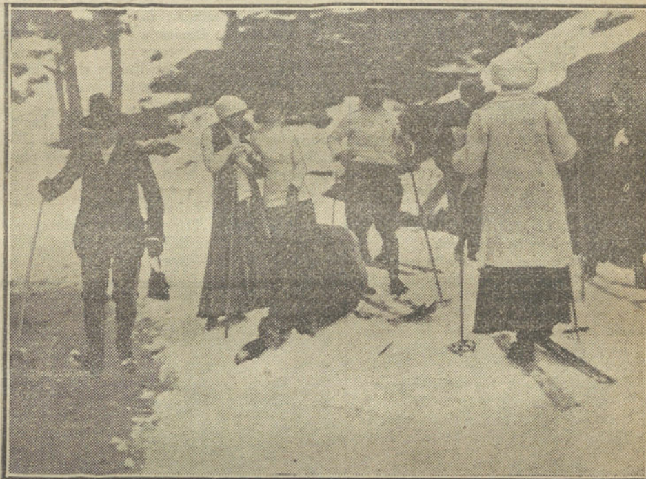
Camino del lugar donde se verificaron los concursos.

Al descender el Monarca del tren conversó breve instante con el Sr. Canalejas, dirigiéndose luego á saludar al marqués de la Vega de Inclán, con quien estuvo hablando durante algunos instantes. Acto continuo abandonó la estación del Norte, dirigiéndose á Palacio,