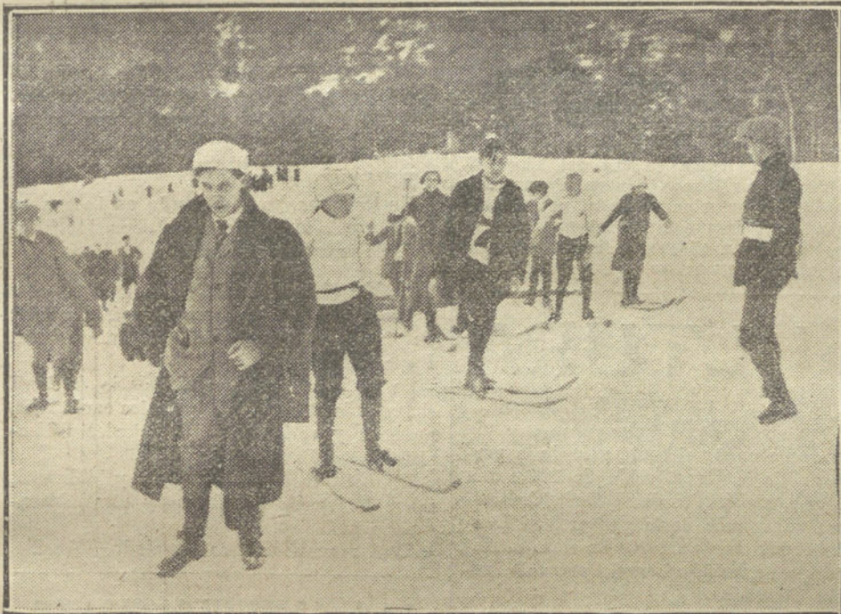
En la pradera.