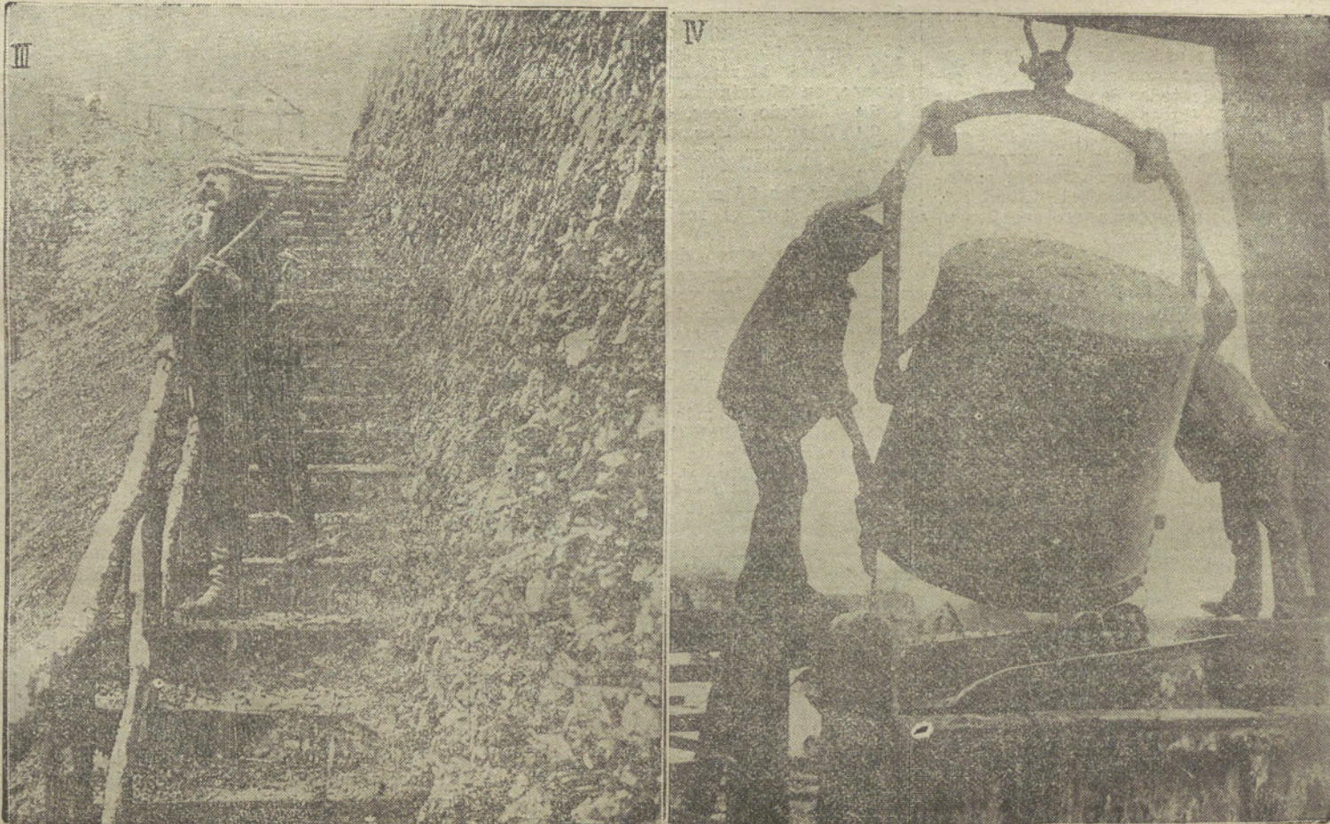
EL CONFLICTO DE MINEROS INGLESES.—Bajando á la mina KENT.—Extracción del mineral