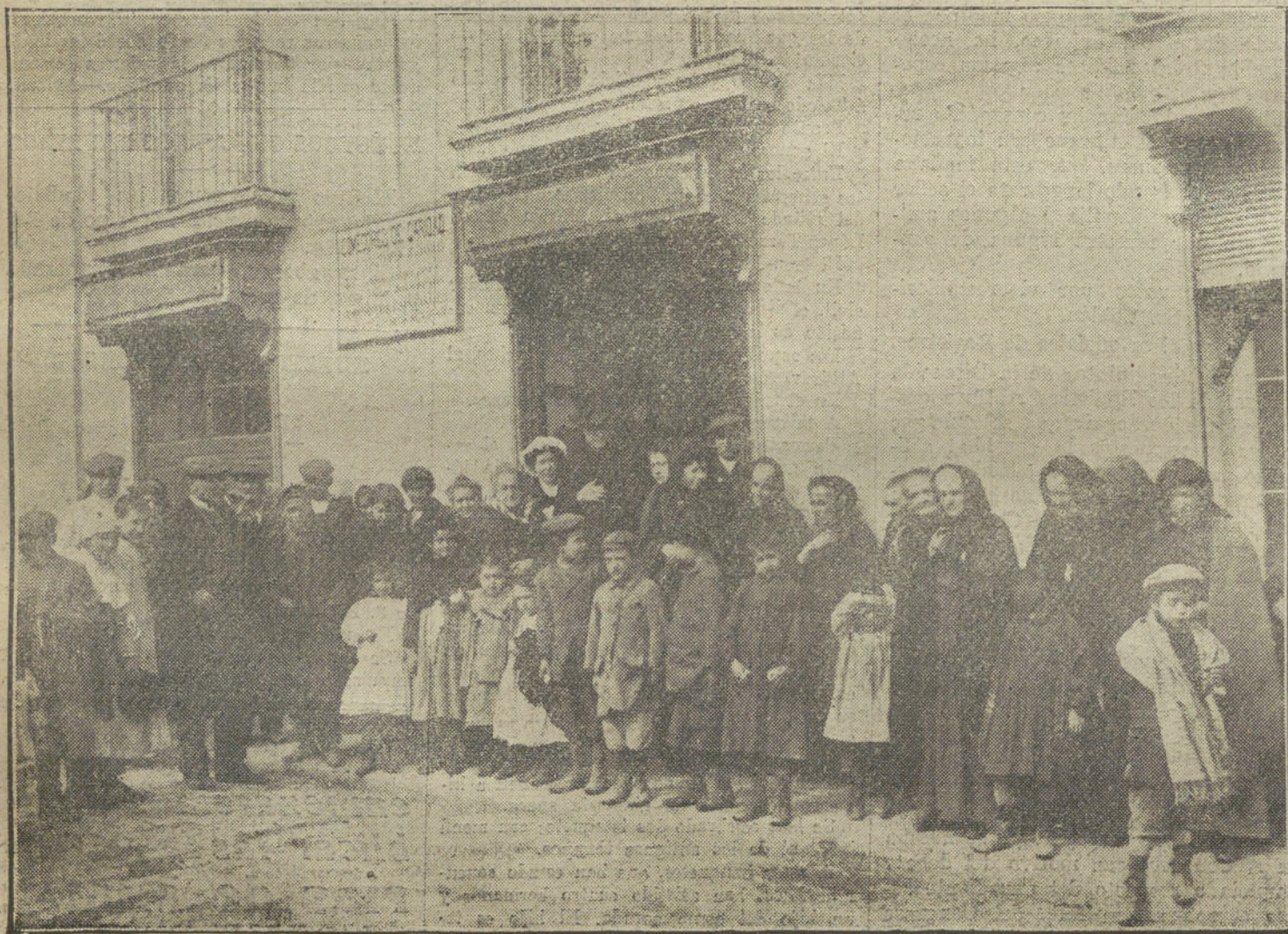
LOS POBRES ESPERANDO LA HORA DE COMER

Pronto se reúnen cerca de setenta personas, y aquella multitud callada, sobre cuyos semblantes amarillentos la pena modeló idéntico gesto de resignación y de paz, brinda al observador un raro interés. Las mujeres, sobre todo, son viejas, son tristes, con frentes bombeadas, surcadas de arrugas, narices aguilénas y labios delgados y firmes, como endurecidos por la quietud de la desilusión; arde en sus pupilas una juvenil vivacidad que contrarresta la pesadumbre blanca de los cabellos. Visten de negro, el color favorito de la viudez y del dolor, y sus débiles pies caminan sin ruido: las manos, de dedos sarmentosos, propenden á cruzarse sobre el pecho, devotas y apacibles bajo los mantos; los rostros cubiertos de palidez, inclinados al suelo devotamente, reflejan bien la expresión, á la vez mística y enérgica, de la raza. ¡Oh! ¿Cuántas novelas sangrantes de amor, de fortuna, de gloria, quizás, habrá allí?... Y, aquellos niños, nacidos en la derrota, ¿no serán vencidos prematuros llamados á repetir la historia de do-