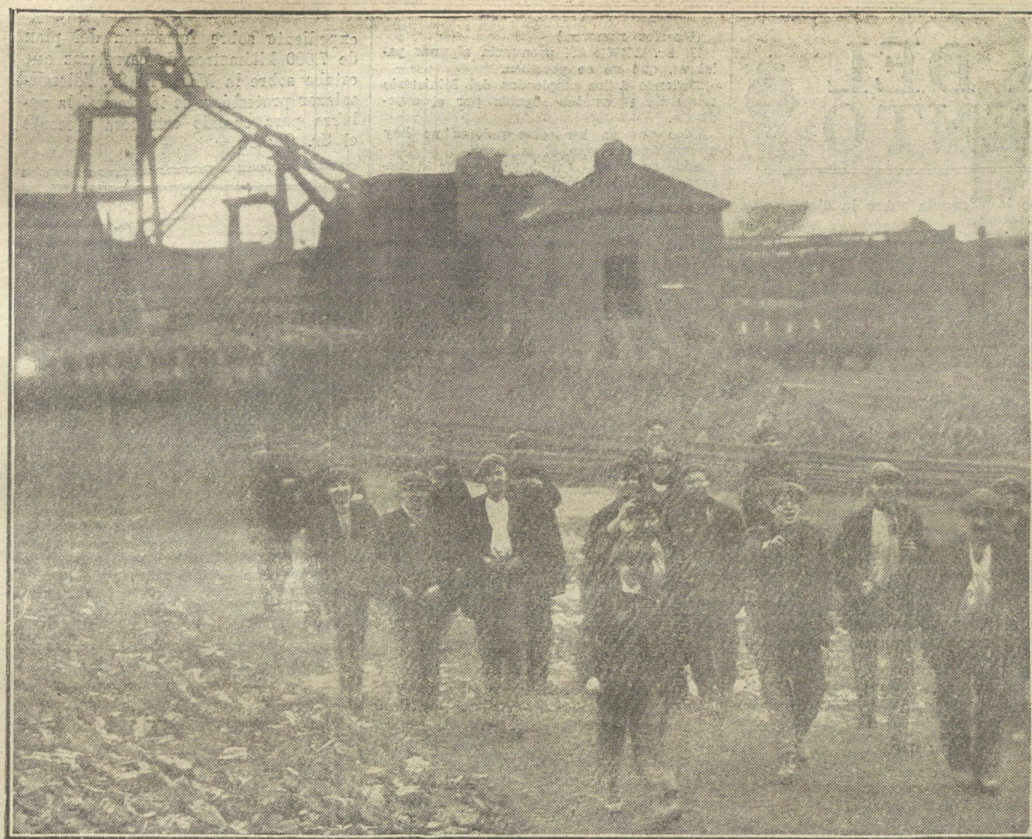
LA HUELGA INGLESA.—Los obreros abandonando el trabajo.