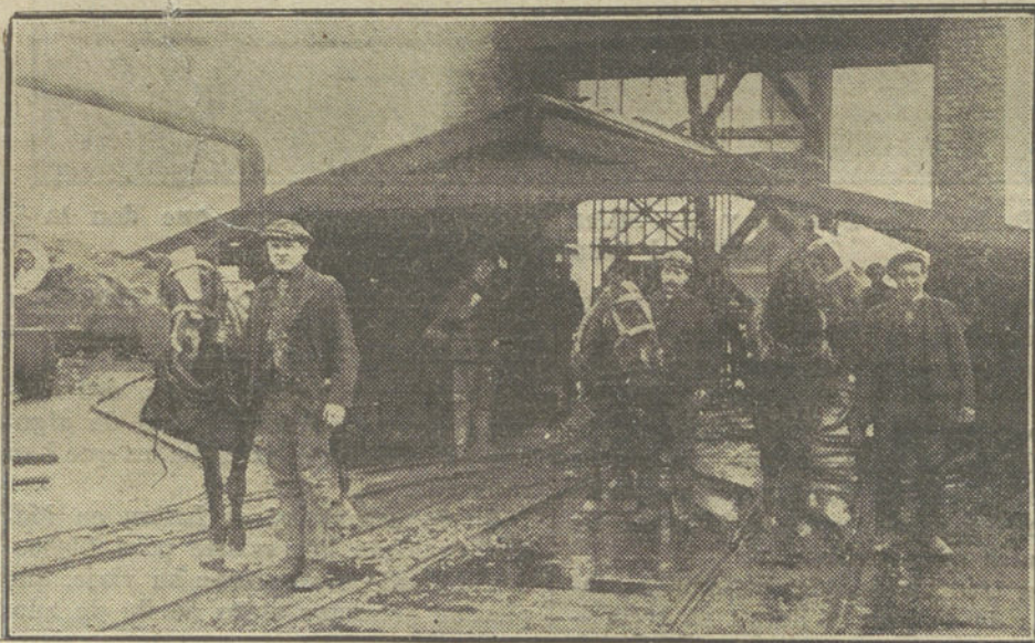
LA HUELGA INGLESA. —En la boca de la mina. Los obreros sacan á la superficie los carros y los caballos del trabajo.