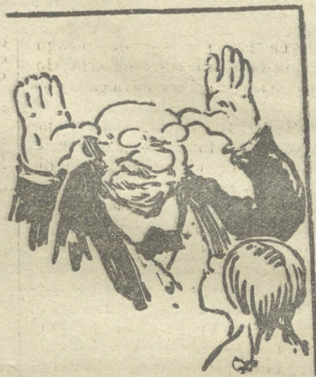
LA CARICATURA EXTRANJERA

expediente sobre formación del plan de 7.000 kilómetros de carreteras que estaba sobre la Mesa. El Sr. Allende Salazar protestó, y se le reservó la palabra para cuando estuviera presente el Sr. Gasset.