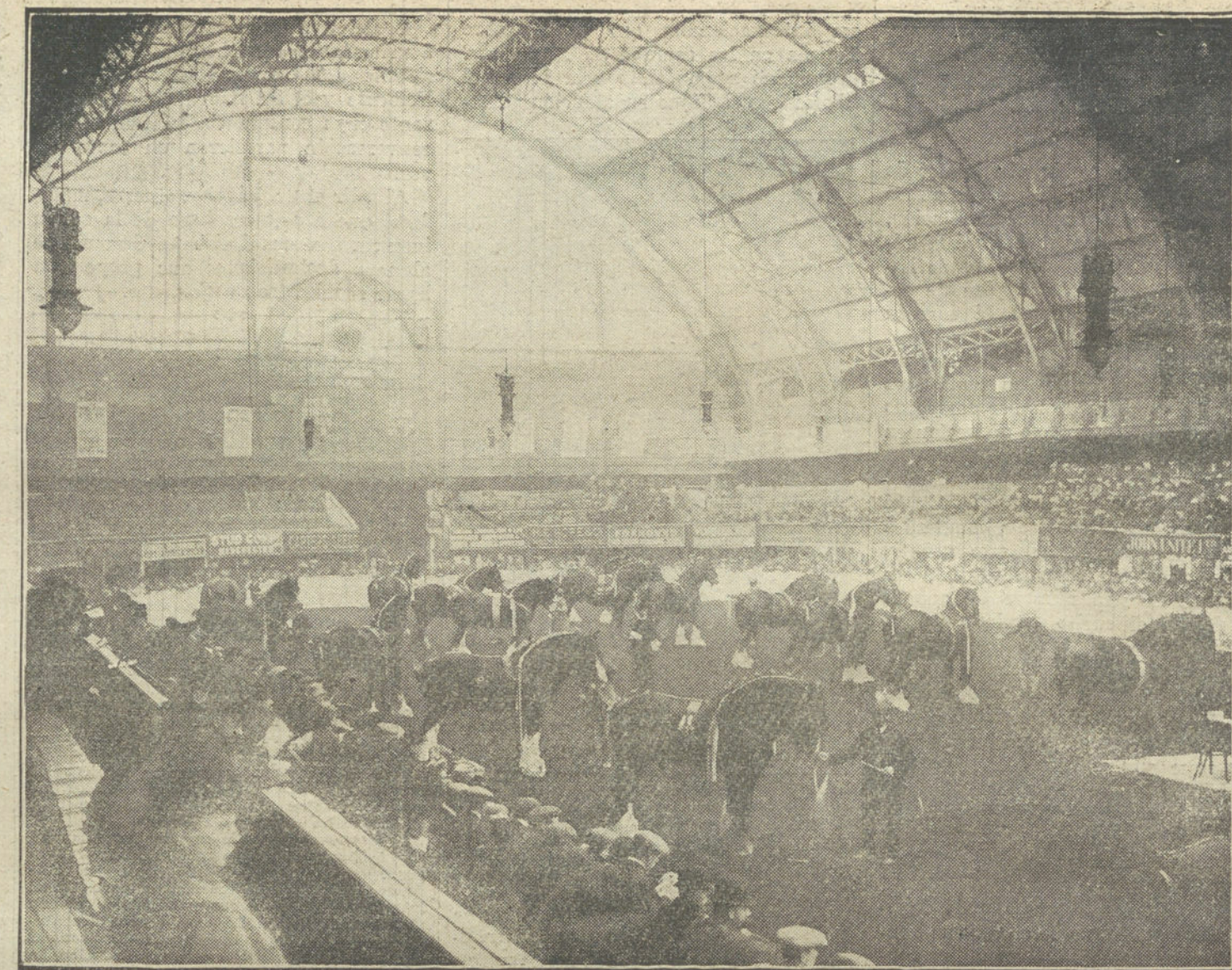
Gran concurso de sementales en el Hall de Agricultura en Londres. El Jurado enseñando los ejemplares presentados.

—Lo importante—concluye—es dar trabajo, porque quien trabaja nunca es pobre. Yo le escucho complacido, y sus entusias-