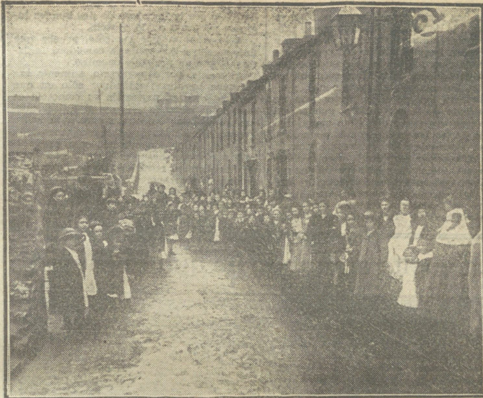
LA HUELGA INGLESA. —Mujeres é hijos de mineros. Las verdaderas víctimas de la huelga.

Hoy han marchado á Madrid, los comisionados de los Ayuntamientos de Coruña y Oza, que van á solicitar ciertas mejoras — Alejandro.