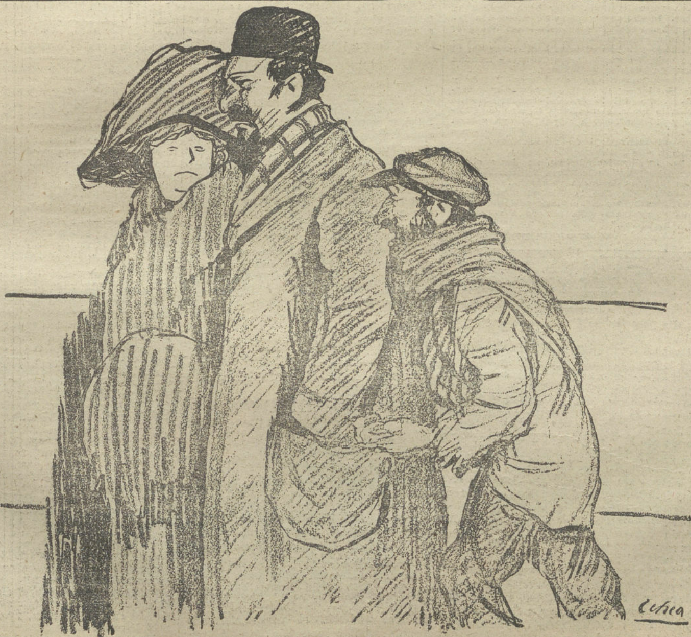
—Tengan compasión de este pobre huelguista inglés, que ha venido de Londres á pie y sin dinero. (Dib. Echea.)

PARIS (10 mañana) del 4. De Casablanca comunican que el general Moinier salió ayer domingo para Fez, pasando por Rabat y Mesquinez, al dirigirse á la capital del imperio jerifiano.—Hallet.