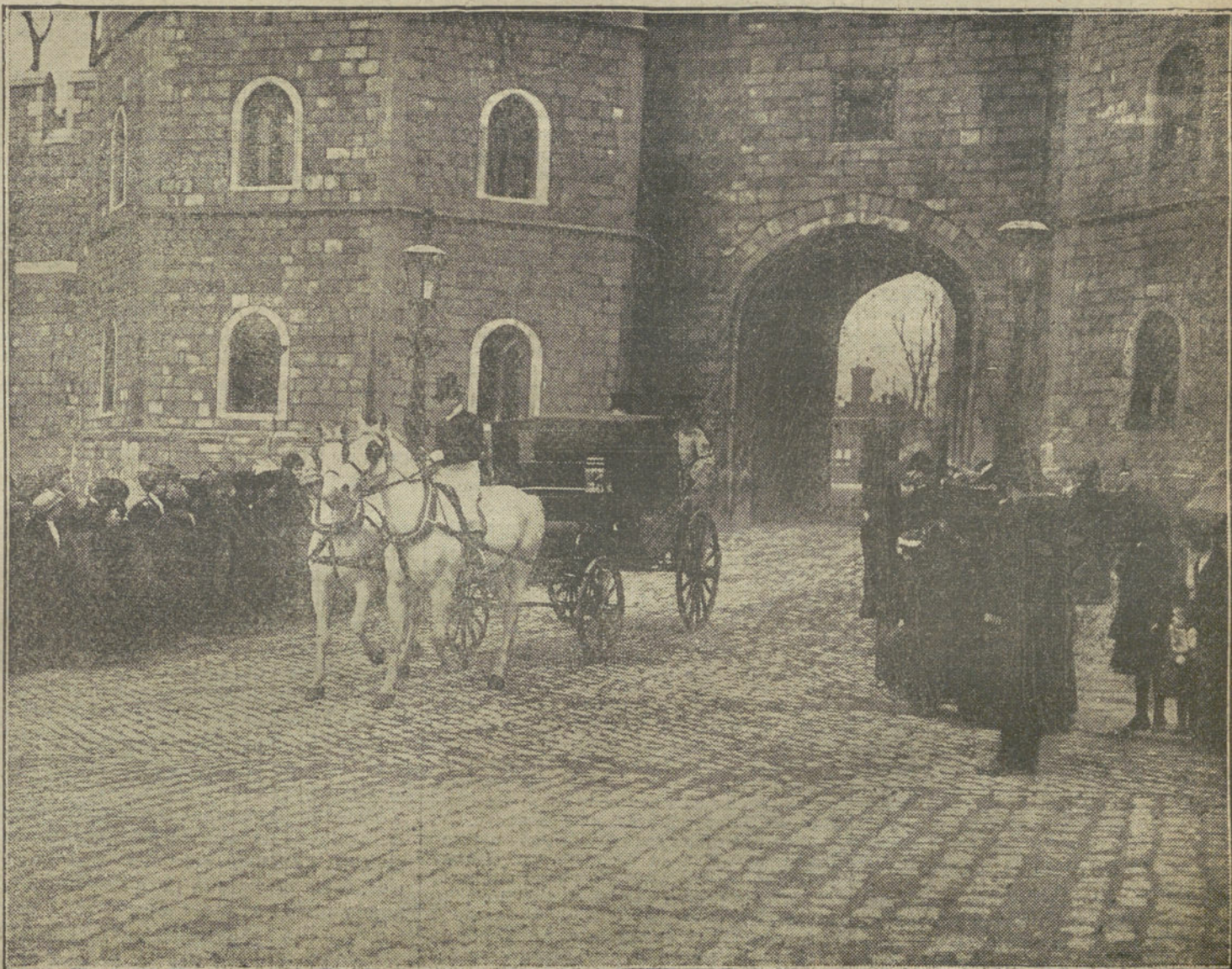
FUNERALES DEL DUQUE DE FIFE.—Los Reyes de Inglaterra saliendo de la capilla real después de la ceremonia.