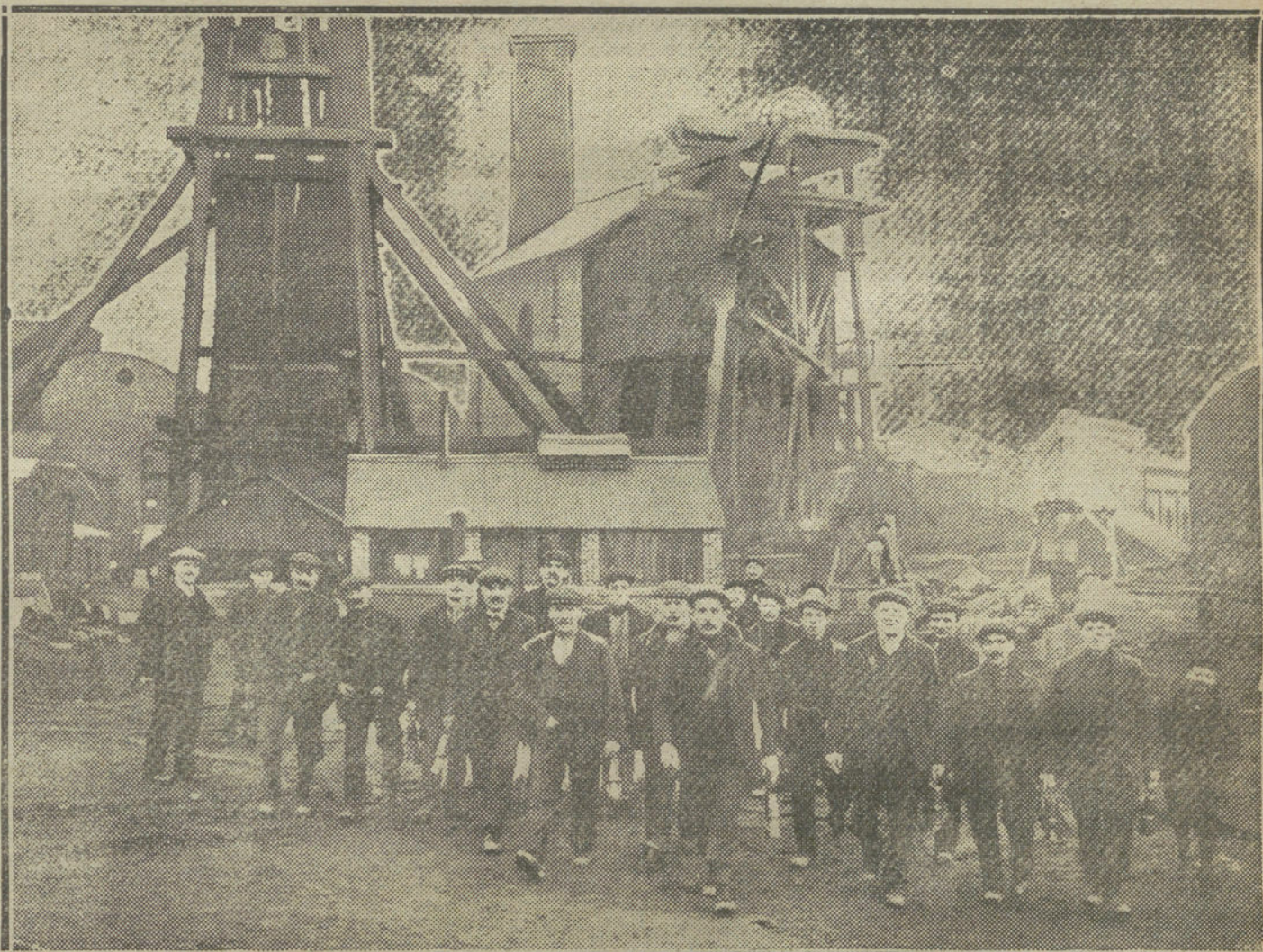
LA HUELGA INGLESA.—Los trabajadores de la mina DECAMTH, la más importante de Escocia, abandonando el trabajo.

Sospéchase que se trata de un atentado, pues se encontraron algunas piedras sobre la vía, que se cree fueron causa del descarrilamiento.—Hallet.