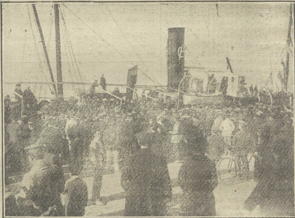
Llegada al puerto de Almería del vapor "Vicente Sanz", que condujo á los licenciados de Melilla.

Otra del mismo, proponiendo la ampliación de la acera de la plaza de San Marcial, trozos comprendidos entre las fincas números 1 al 7 y del 4 al 1.