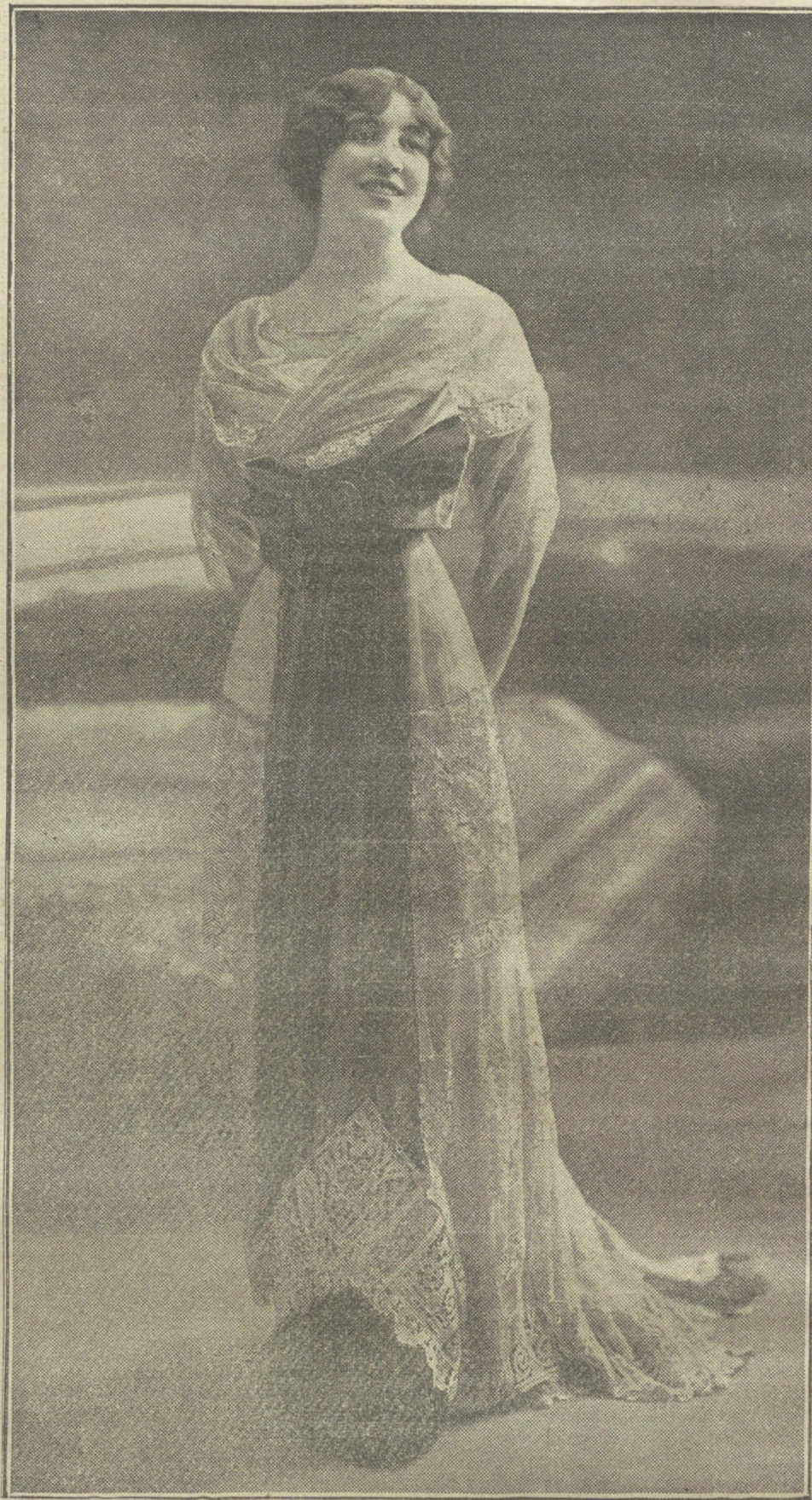
MODELO DE TRAJE DE NOCHE.—Creación Buzenet.—Fot. Talbot. Concesionario Cosmia.

En el mismo número y en el suplemento literario se inserta un artículo que se titula "Carnaval Español", y en el que entre unas cosas graciosísimas se dice: "Para que pueda uno hacerse perfecto cargo, para comprender toda la verdad de cuanto llevo dicho de Zaragoza (adviértase que el escritorzuelo se despacha á su gusto al hablar de la capital aragonesa), sería necesario coger á cada cual y hacerle oír, esa música que pone los nervios en tensión y esos gritos estridentes que hacen temblar las carnes. (¿Qué música y qué gritos serán