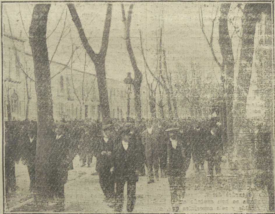
Salida del público que asistió al mitin celebrado en Almería para pedir el establecimiento de un correo diario con Melilla.

Pónese á discusión un dictamen proponiendo la adaptación del personal docente de las Escuelas Aguirre, á las planti-