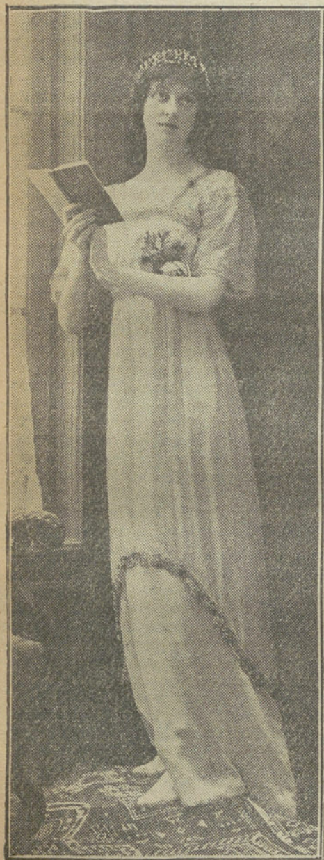
MODELO DE TRAJE DE NOCHE.—Concesionario Cosmia.

El delantal "masónico" es una de las novedades de la temporada. Se confecciona de tul ó gasa bordada con seda de colores vivos y se coloca debajo del busto mismo, sosteniendo un cinturón que armoniza con el delantal.