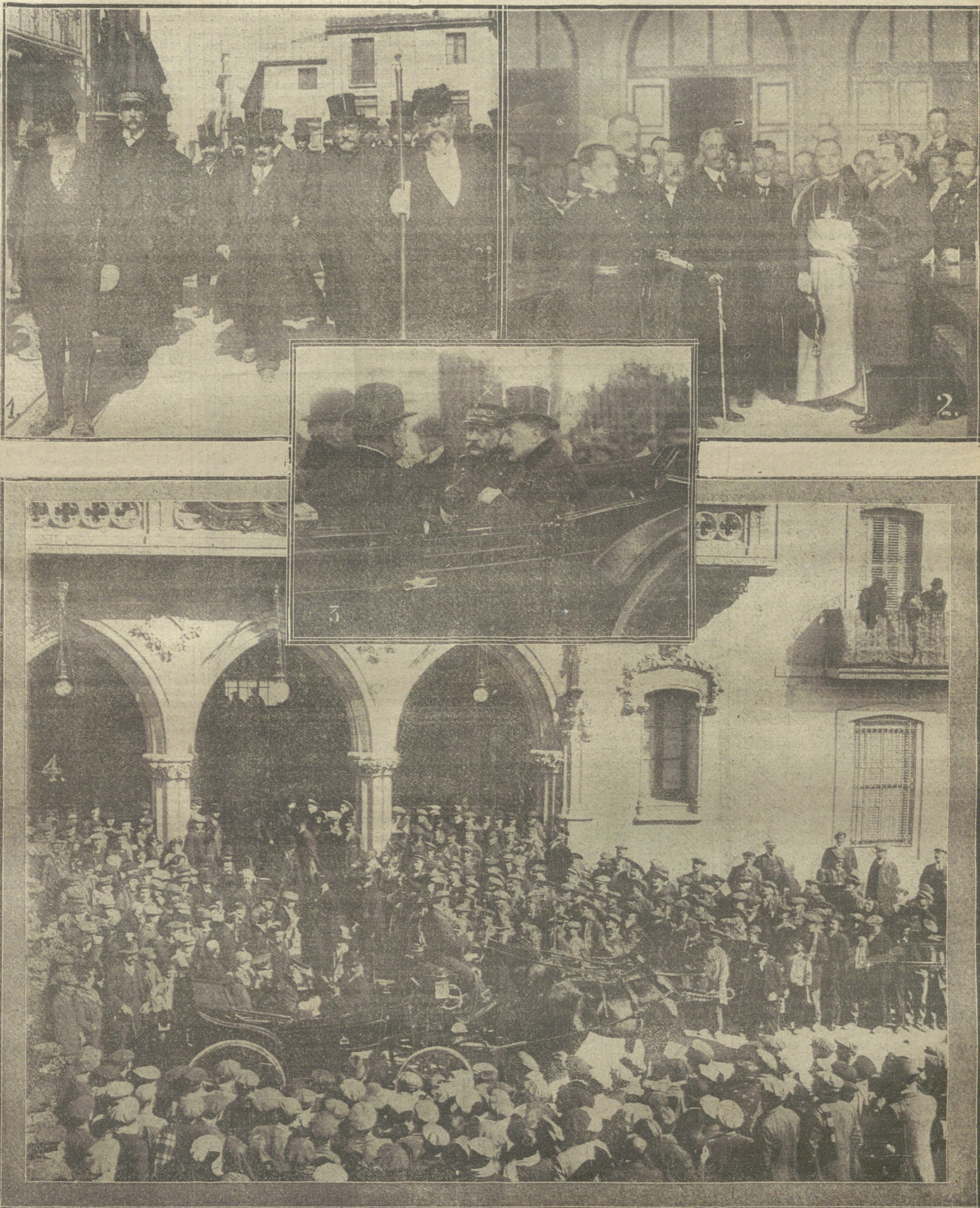
Viaje del ministro de Instrucción pública á Barcelona