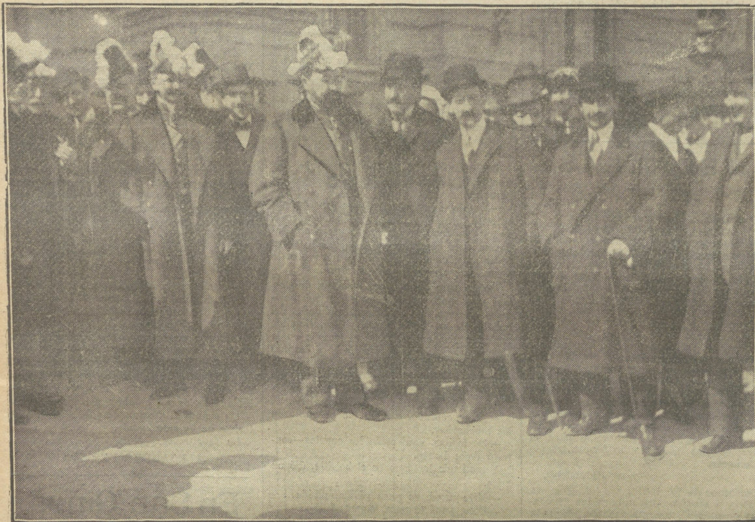
Los nuevos ministros al salir de Palacio, acosados por los queridos compañeros en la Prensa:

Últimas fotografías las publicará mañana "Nuevo Mundo".