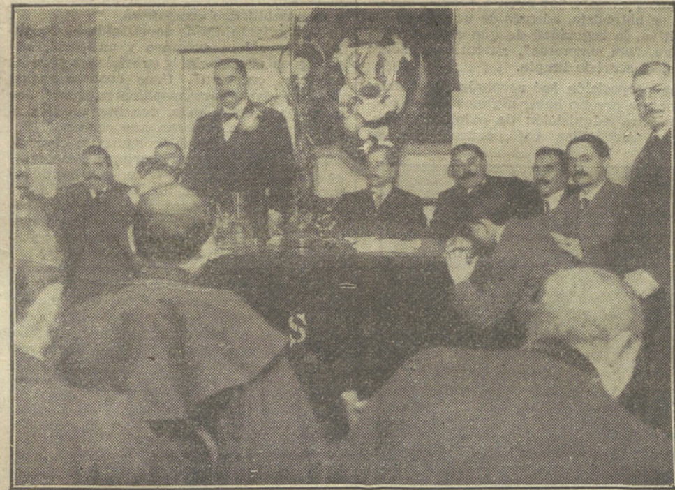
LOS FONDISTAS.—La mesa presidencial de la reunión celebrada ayer.

El colega ha tenido el buen gusto de no molestar la atención de sus lectores con una detallada relación explicatoria y con graciosa gentileza dedica las líneas—pocas—de un "entrefilet", á la cortesía obligada.