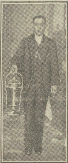
El chico de "La Cafetera".

—¡Qué asco!—exclamamos todos con gesto de repugnancia y acento de justa indignación, recordando que ya otras veces se había repetido el... descuido. Y entre las protestas de los unos y los comentarios