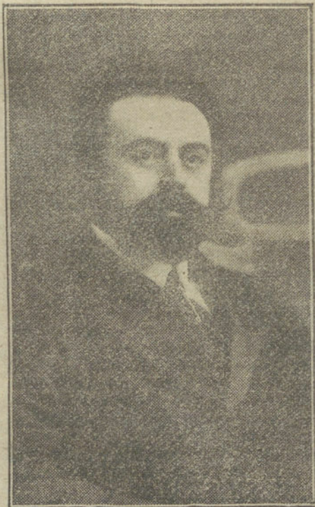
El nuevo ministro de INSTRUCCION PUBLICA, D. SANTIAGO ALBA.

Dentro de los partidos liberales ha pertenecido siempre a la izquierda democrática, guardando, además de la lealtad del político, una íntima amistad para el Sr. Canalejas, que siempre le ha distinguido entre los suyos, y que le eligió para desempeñar la cartera de Marina en el primer Gabinete que formó.