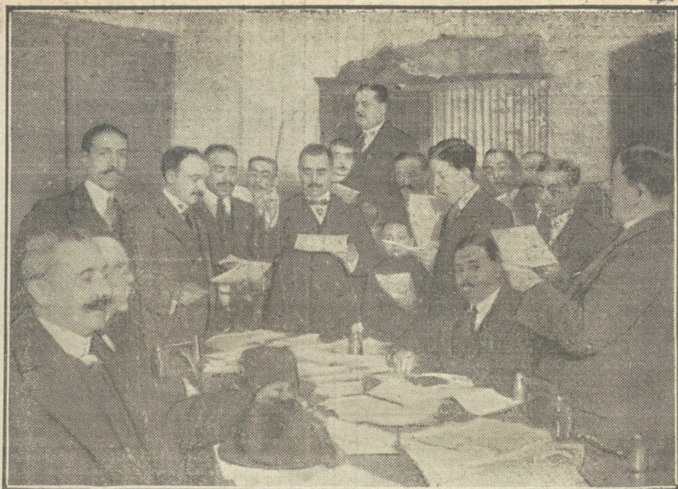
EL ORFEON

Estos amables compañeros de "La Cafetera", gente jovial, en su mayoría, y bulanguera, teniendo en cuenta que "la vida es efímera" y está llena de amarguras, procuran tomarla por el lado que ofrece más alegre aspecto; así es que en cuanto el rudo trajín les permite un rato de expansión le aprovechan y... ya está la zambra armada.