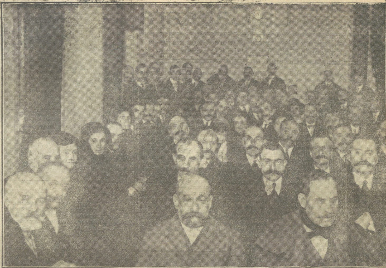
LOS FONDISTAS.—Aspecto del salón durante el acto.

Con tal motivo, la línea ha quedado interrumpida dos horas.—Pozanco.