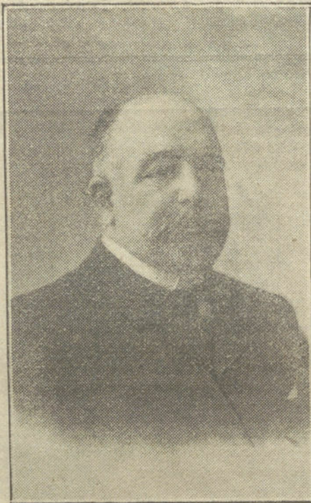
El nuevo ministro de GRACIA Y JUSTICIA DON DIEGO ARIAS DE MIRANDA.

Don Diego Arias de Miranda, que ha jurado hoy el cargo de ministro de Gracia y Justicia, nació en Miranda de Ebro (Burgos), el día 19 de Diciembre de 1845.