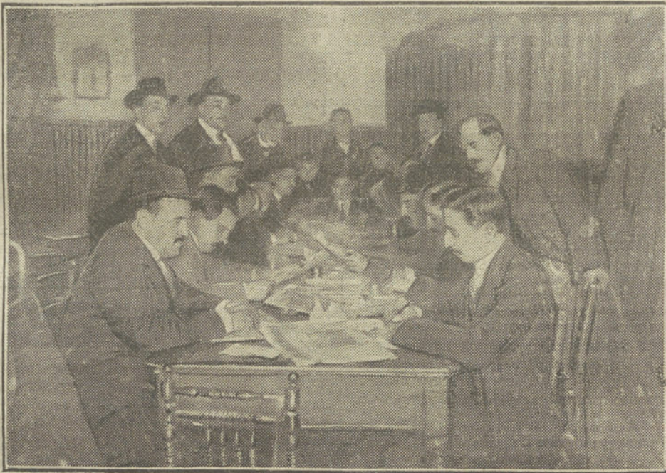
EN PLENA TAREA

irónicos de los otros, alguien lanzó la idea de hacer el café por cuenta propia, con lo que se obtendría, además de una economía positiva, la seguridad de que el café sería bueno, "sin sorpresas", auténtico y, sobre todo, el servicio limpio.