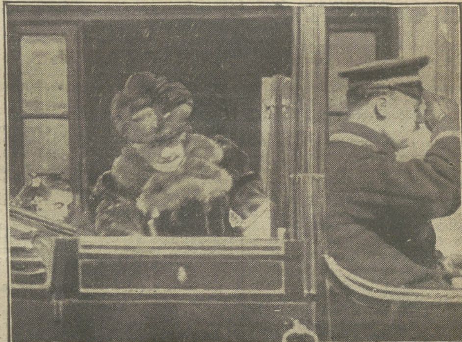
La infanta doña Isabel, á su llegada esta tarde á la estación del Norte.

Inmediatamente el nuevo ministro de Gracia y Justicia hizo un discurso breve, encomiando los méritos del alto personal y reclamando su auxilio para la labor que ha de realizar en el Ministerio.