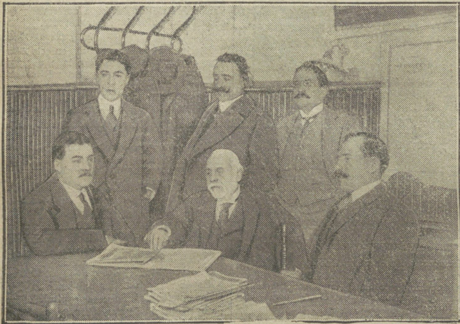
JUNTA DIRECTIVA

—¡Que viene la noticia! Y entonces es que es Trova aquélla. La