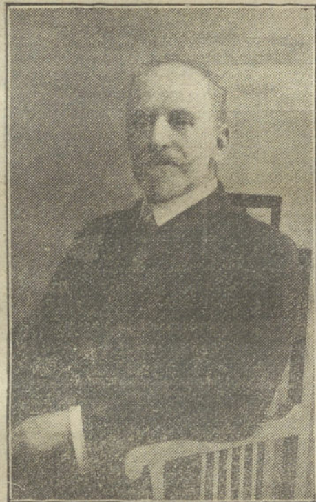
El nuevo ministro de FOMENTO, DON MIGUEL VILLANUEVA.

En la última situación que presidió el señor Moret, fué subsecretario del Ministerio de la Gobernación.