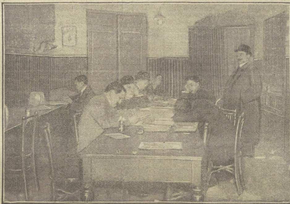
A LAS CUATRO DE LA MAÑANA

Témense nuevos desórdenes, habiendo adoptado las autoridades toda clase de precauciones.—Valvidriera.