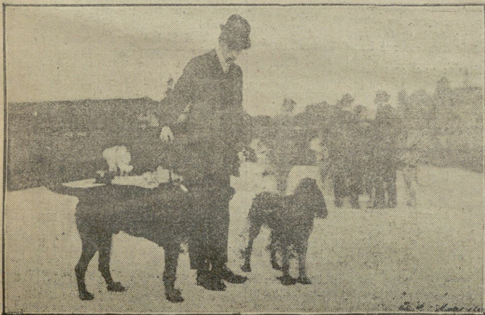
EXPOSICION CANINA EN MANCHESTER.—DOS BUENOS EJEMPLARES.