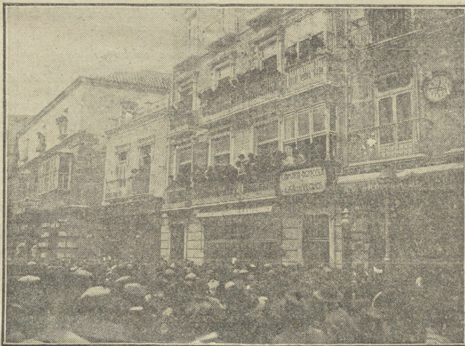
EL MITIN DE CARTAGENA.—EL PUBLICO ANTE EL DOMICILIO DEL SR. GARCIA VASO

Mañana martes concurrirán al juicio de exenciones y clasificación de soldados, los mozos del actual reemplazo, correspondientes á los pueblos de Torrejón de Ardoz, Torres, Valdeaveso, Vadeolmos, Valdeterres, Valdilecha, Valverde, Vallecas, Vellilla de San Antonio, Vidálvaro, Villalvilla y Villar del Olmo.