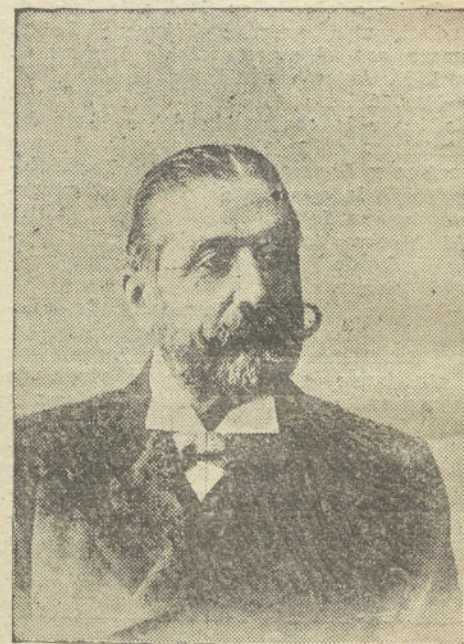
DON DEMETRIO ALONSO CASTRILLO, que hoy ha sido nombrado gobernador civil de Madrid

Acceder á lo solicitado por la Alcaldía de Alcalá de Henares, en lo relativo que se encante el Estado, de los dos trozos de carretera, de Talamanca al paso de nivel del ferro-