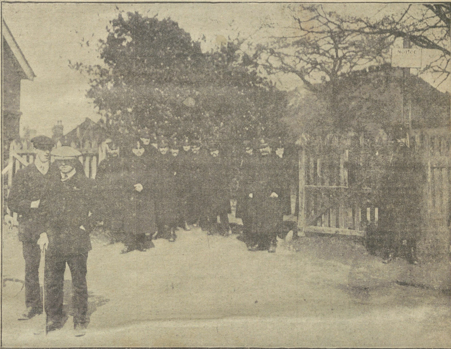
LA HUELGA MINERA.—La policía vigilando un depósito de carbón durante una manifestación obrera en Chidk.