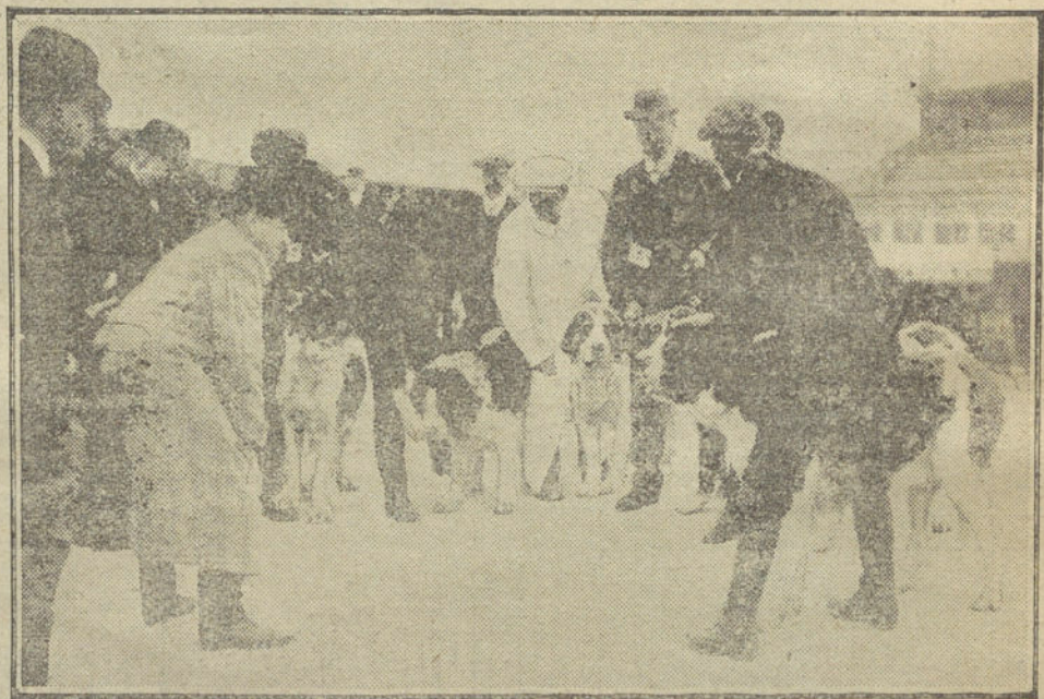
EXPOSICION CANINA EN MANCHESTER.—LOS EXPOSITORES.

Ha sido muy bien acogido el triunfo del general Plaza, que goza de gran arrago y simpatía en el país.—York.