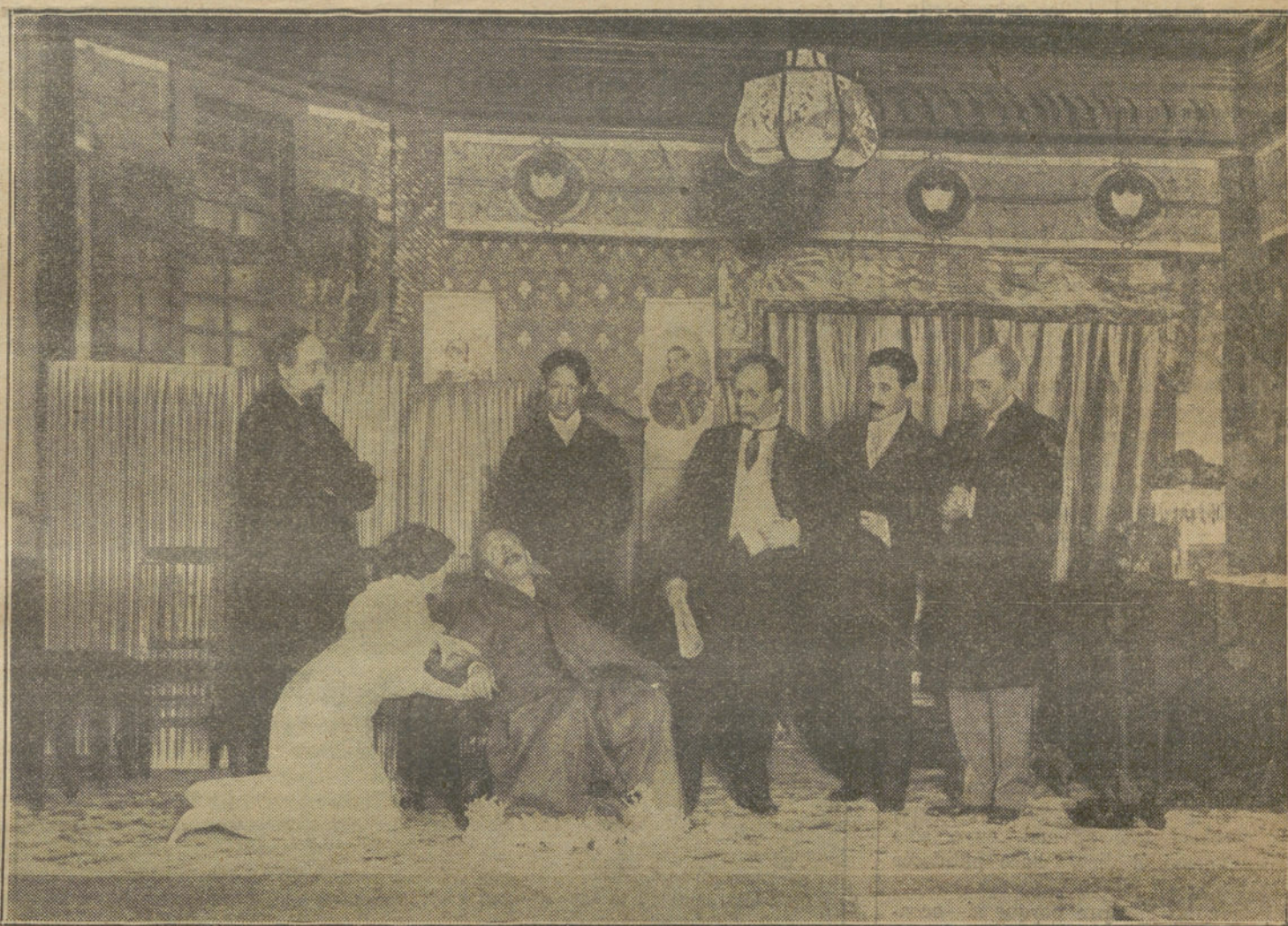
Escena final de la obra "Los hijos del Sol naciente", estrenada anoche en el Teatro Cervantes. (Fot. Enrique).

zoco del Zebuya varios notables santones que recorren las cabilas predicando la guerra contra los franceses, habiéndose formado harkas para impedir el paso de los franceses por Taza.