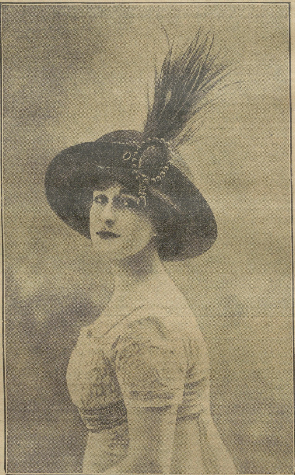
MODELO DE SOMBRERO

tro cutis su acostumbrado y necesario "masaje", una vez que os hayáis cepillado y recogido el cabello, que os disponéis, en fin, á meteros en la cama, coged un baño de pies lleno de agua templada, un jabón suave, un cepillo de uñas y dad á vuestros pies un fuerte y enérgico lavado. Después que lo hayáis hecho varias noches, observaréis que perdéis la rigidez y dureza que casi todo el mundo padece, sobre todo si después del baño os dais unas fricciones con una buena agua de "toilette", bien con agua de colonia, bien con agua de verbena, lo indispensable es que sea buena; la casa de Alvarez Gómez tiene de ambas excelentes producciones, y puedo responder de su eficacia y su bondad.