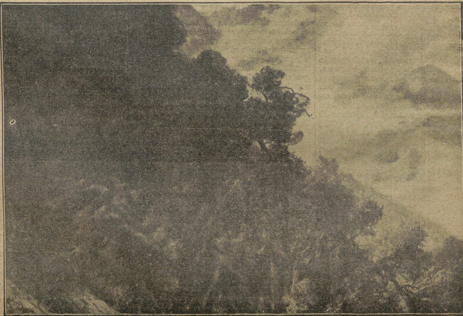
LA PROXIMA EXPOSICION.—"En la Sierra", paisaje de R. STOLZ

lante devolverá golpe por golpe al adversario, respondiendo cumplidamente á sus acusaciones. Añádese que Taft publicará una nota demostrativa de la complicidad de Roosevelt con su ministro de Negocios Extranjeros.