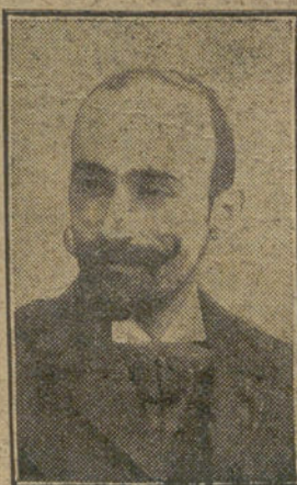
JACINTO BENAVENTE Autor de "Todos somos unos".