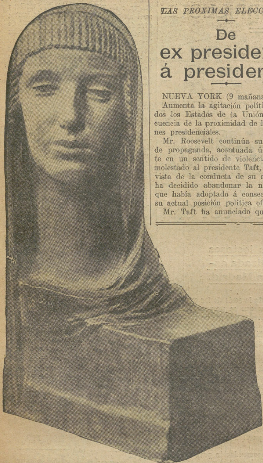
LA PROXIMA EXPOSICION.—"Lo Poesía", escultura de LUCIANO OSLE.

NUEVA YORK (9 mañana) del 27. Aumenta la agitación política en todos los Estados de la Unión á consecuencia de la proximidad de las elecciones presidenciales.