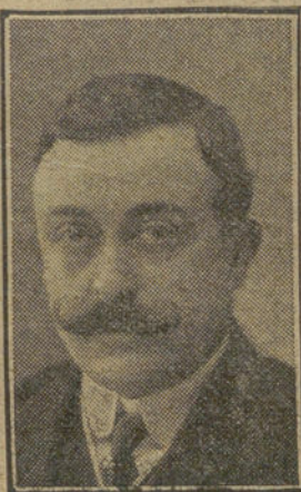
ANTONIO CASERO Autor de "La familia de la Sole".