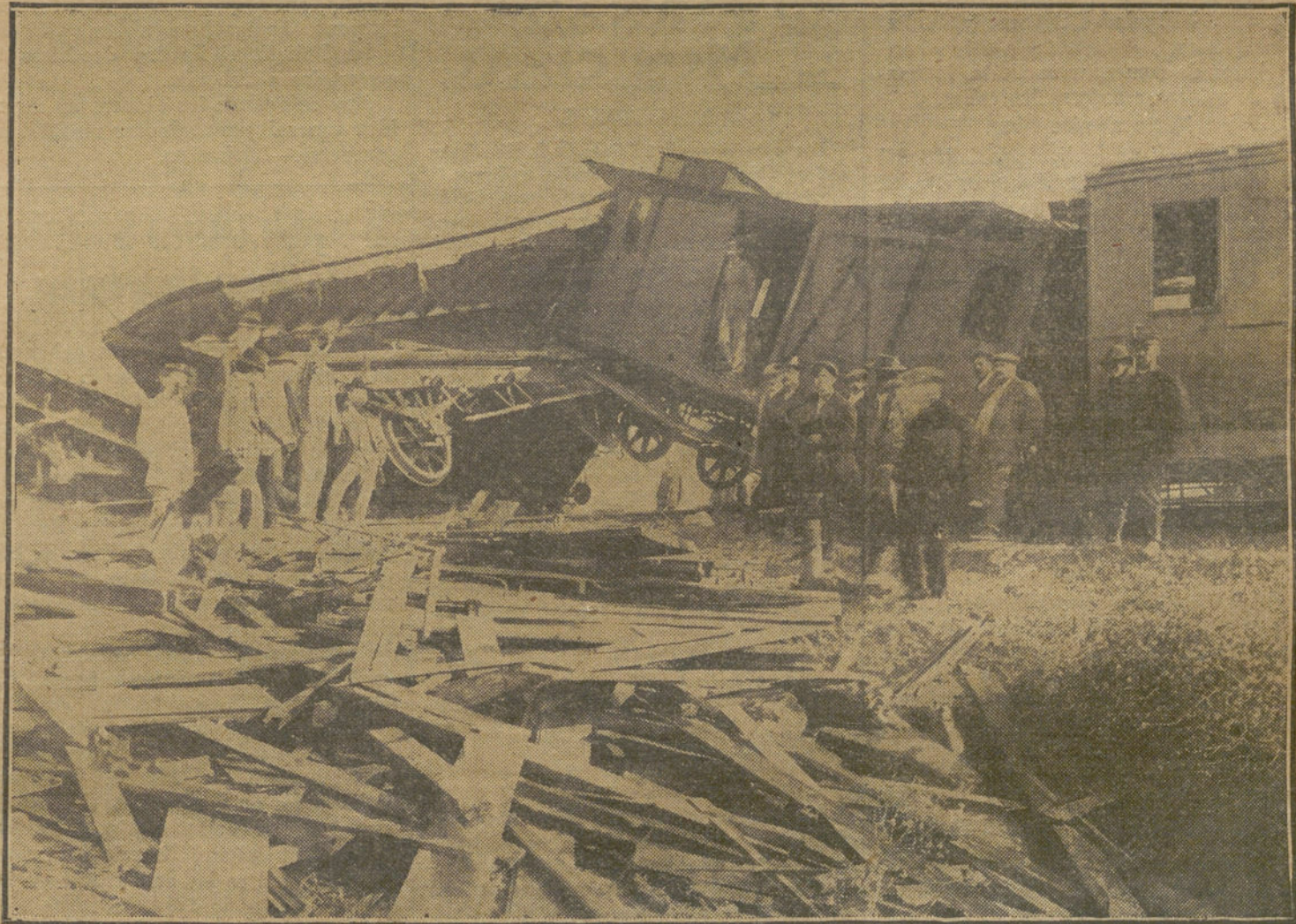
El DESCARRILAMIENTO ocurrido anteayer en VILLAGORDO, del cual resultaron varias víctimas.

"He visto—decía el Sr. Canalejas—, que LA TRIBUNA se desbordó en su número de anoche, hablando de divergencias de criterio en el seno del Gobierno, con respecto á las negociaciones franco-españolas, y en lo que