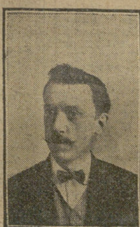
GARCÍA CONDE Autor de "La parada y el relevo de Palacio".