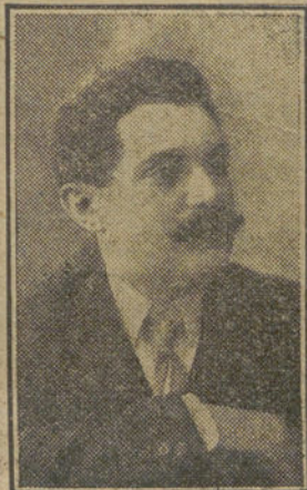
RAFAEL CALLEJA Autor de "La viuda del barberillo".