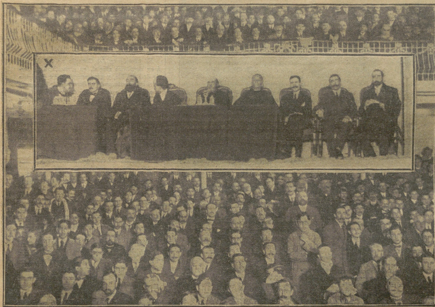
Mitín contra la blasfemia, organizado por la Juventud de Defensa Social en el Teatro del Príncipe Alfonso.—X, Mesa de la presidencia..

A última hora, recibimos fidedignas noticias de que la dueña de la pluma está profundamente apladada de la niña Angeles.