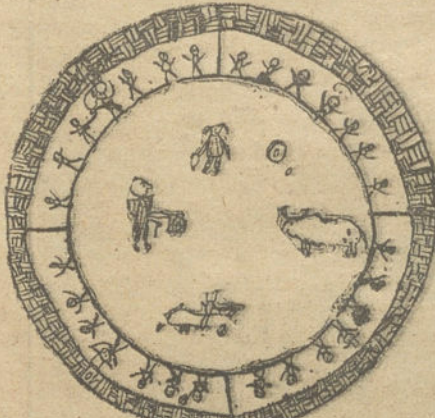
La Plaza de Madrid.—Por Carmen Vicente. (11 años.)

el pobre necio: en el aire, en tierra y en agua, siempre no es más que un ganso. Esto hablo con vosotros, escritores