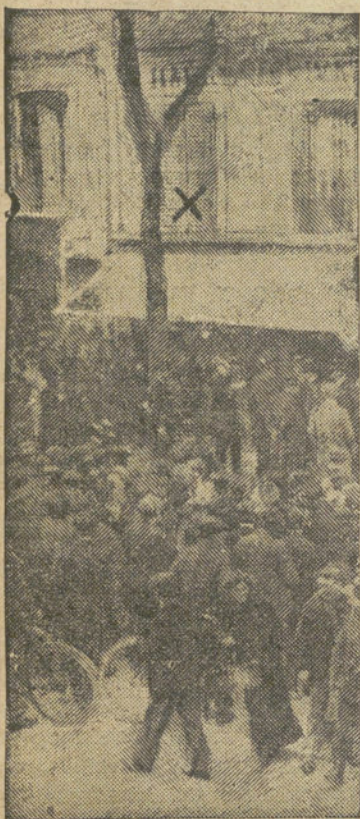
La casa donde fué asesinado JOUIN