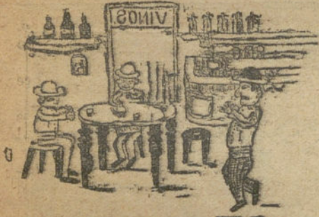
(Viva la alegría!—Por Antonio Gasca. (5 años.)

Transcurre buena parte de la tarde y Pepito no cesa de divertirse con la grata compañía de otros pequeños camaradas; todos ríen celebrando las caídas de unos y otros y antes de las cuatro regresan al chalet, donde una sabrosa merienda es el epílogo de un día lleno de incidentes agradables, pasado al aire libre, entre