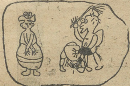
Los azotes.—Por Julito Alerar (10 años.)