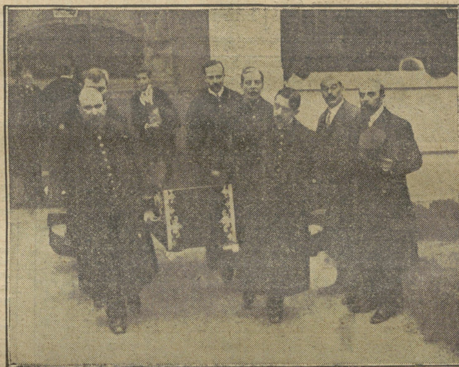
Traslado de los restos de Mendizábal al Mausoleo del Real Panteón de Atocha.

Con objeto de asistir al mitin de Baracaldo, que se ha celebrado hoy inaugurando la serie de trabajos de propaganda organizados por el nuevo partido reformista, salió anoche para Bilbao D. Melquiades Alvarez, jefe del mencionado partido.