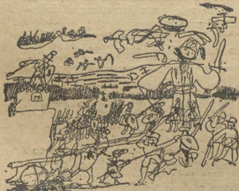
Moros y cristianos.—Por Rodolfo Gil. (10 años.)

Pequeñín, prefiere los juegos higiénicos, como el del balón, a los que se desarrollan en un sitio cerrado. Jugando al aire libre, sintiéndote sano y fuerte, amarás el sol y la vida.