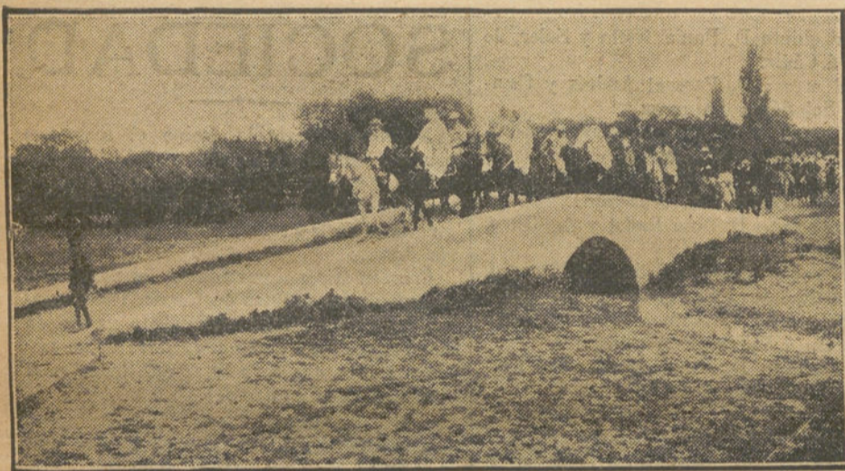
Llegada á Fez del nuevo residente general.

es grande en toda la región y se teme un golpe de mano de los rebeldes.