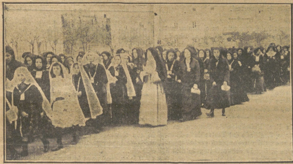
LA PEREGRINACIÓN DE AYER AL ESCORIAL.—Grupo de señoras que tomaron parte en la procesión.

No deje usted de anunciar en LA TRIBUNA. Es la forma de que prospere su negocio.