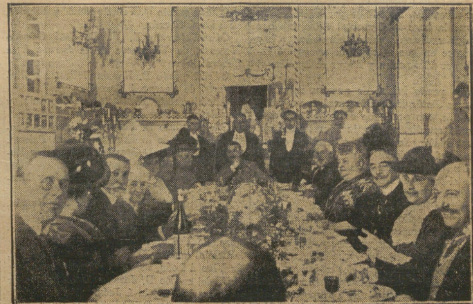
Banquete ofrecido al profesor francés Mr. Merimée, por la condesa de Pardo Bazán.

Yo confieso que siento una gran antipatía hacia este Paul Bourget que va á estrenar hoy "La Crisis" en la Porte-Saint-Martin. Me parece sencillamente un cursi. No creo en él, ni en sus personajes, ni en su público. No creo que Paul Bourget, sea un psicólogo, como no creo que los vecinos del faubor Saint Germain tengan psicología. Paul Bourget, ha sabido introducirse en el gran mundo parisién, halagando la vanidad de una porción de señoras á las que les atribuía un alma complicadísima. Como, además, Paul Bourget se vestía á la inglesa, el gran mundo parisién le recibió con los brazos abiertos. Ganó dinero, se compró un monóculo y entró en la Academia. Llegó á tener un gran público de "snobs", de mujeres de mundo y de vendedoras de "magasin". Las grandes damas se consideraban todas un poco biografiadas en los libros de Paul Bourget y las vendedoras y las horteras leían el novelista de las pasiones distinguidas para hacerse una idea de lo que es la vida aristocrática, como pudieran leer "Los amores del Vizconde" ó "El pecado de la Duquesa". Snobismo, "bluff" ó, para decirlo en castellano, cursilería. Paul