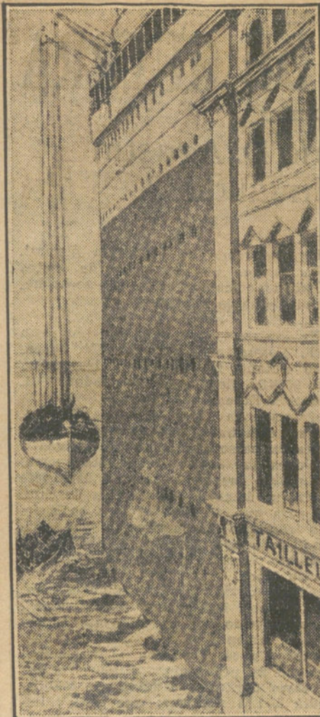
La altura del "Titanic" comparada con una casa de cinco pisos. (Composición para demostrar las dificultades que ofrece el salvamento.)

Con duras frases censuró la campaña del Rif. Seguidamente abogó por la