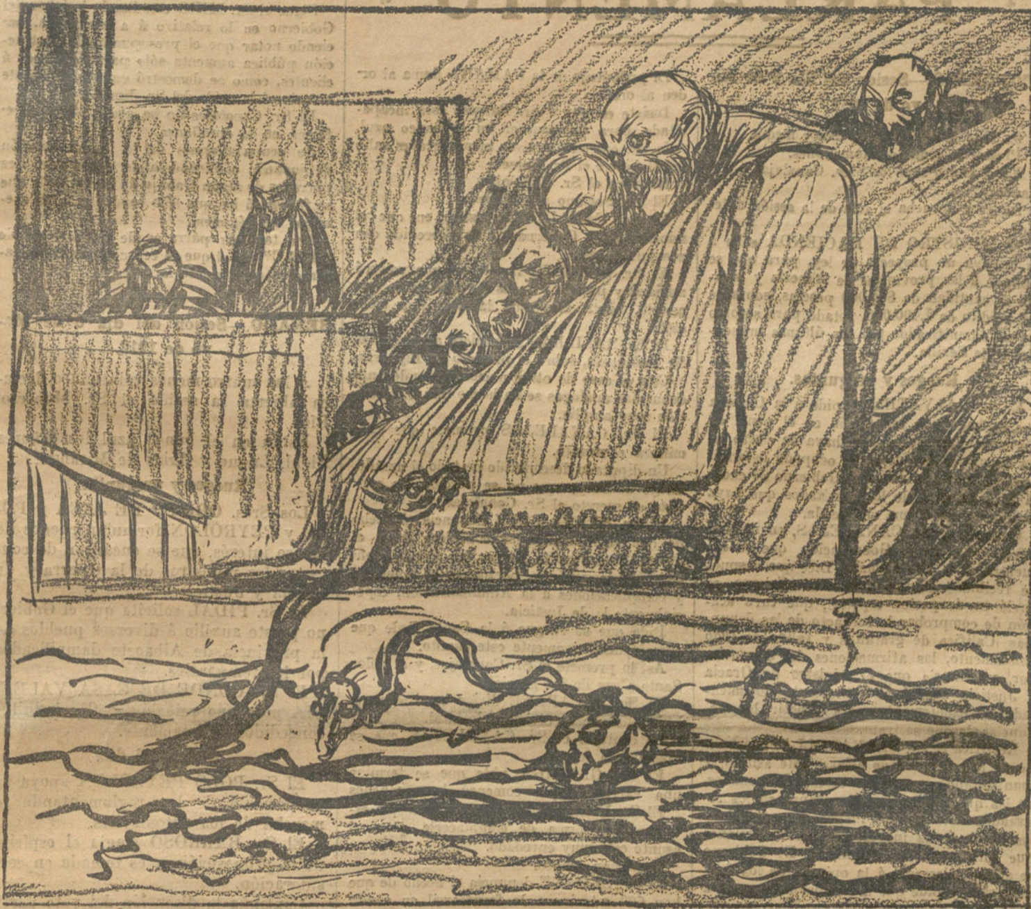
¿Política de pantano? No; de charca.