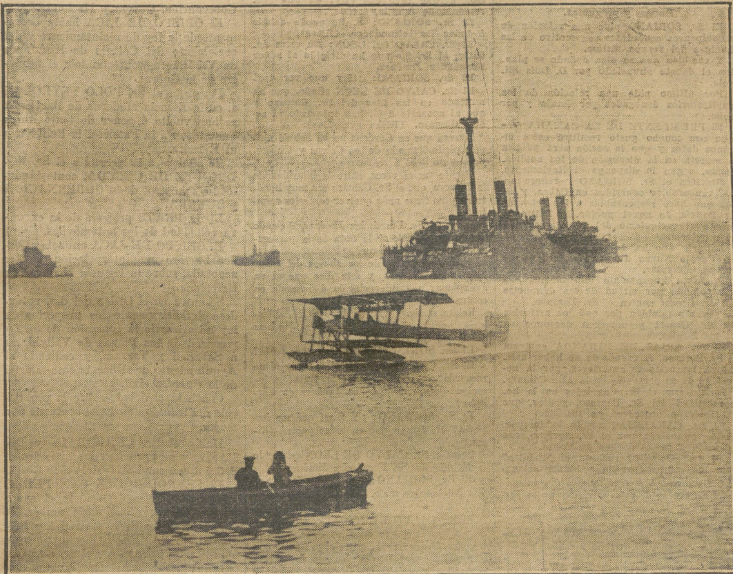
Ensayos del hidroplano inglés, volando de Hibernia a Weymouth, durante las maniobras de la escuadra.