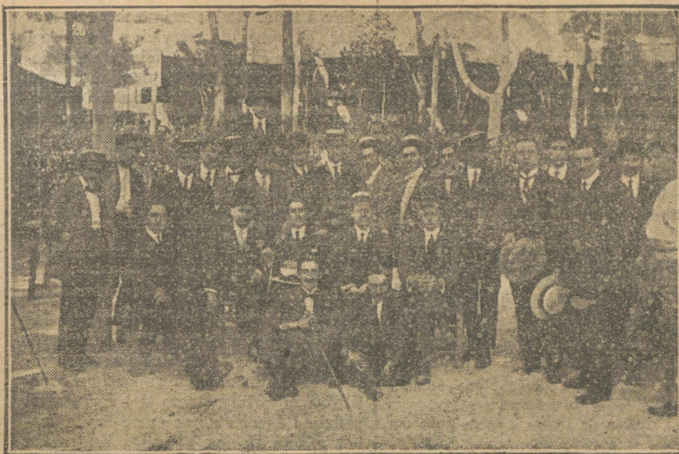
Banquete celebrado anoche por los ingenieros industriales.