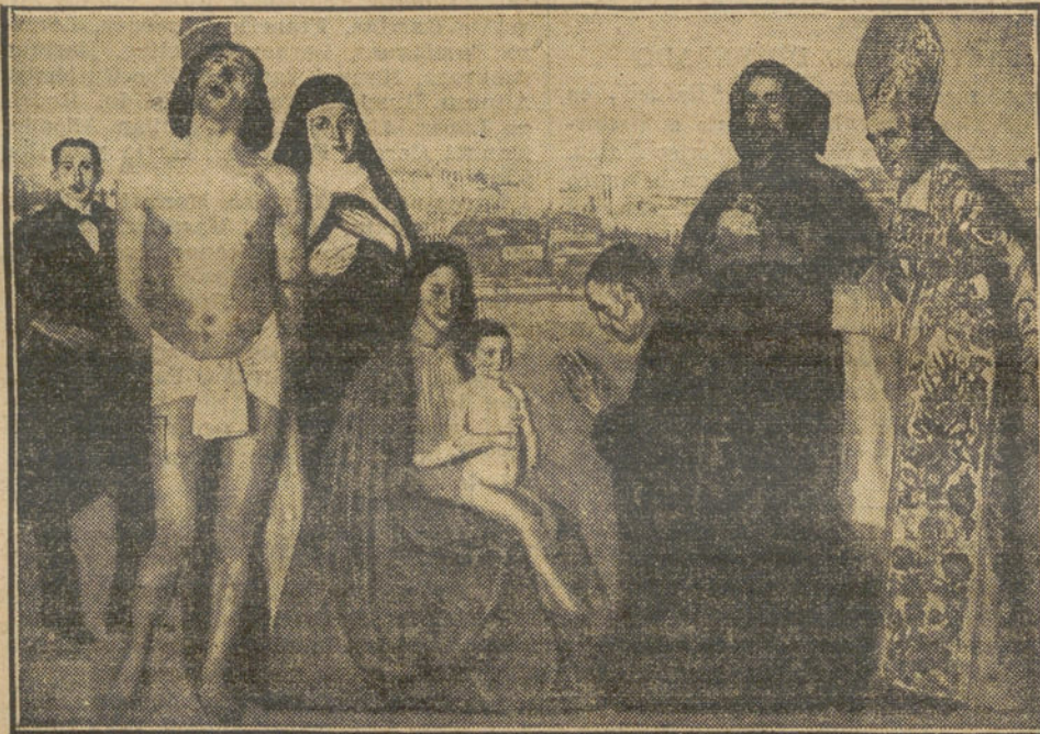
LA PROXIMA EXPOSICION.—"Exvoto", cuadro de Javier Cortés.