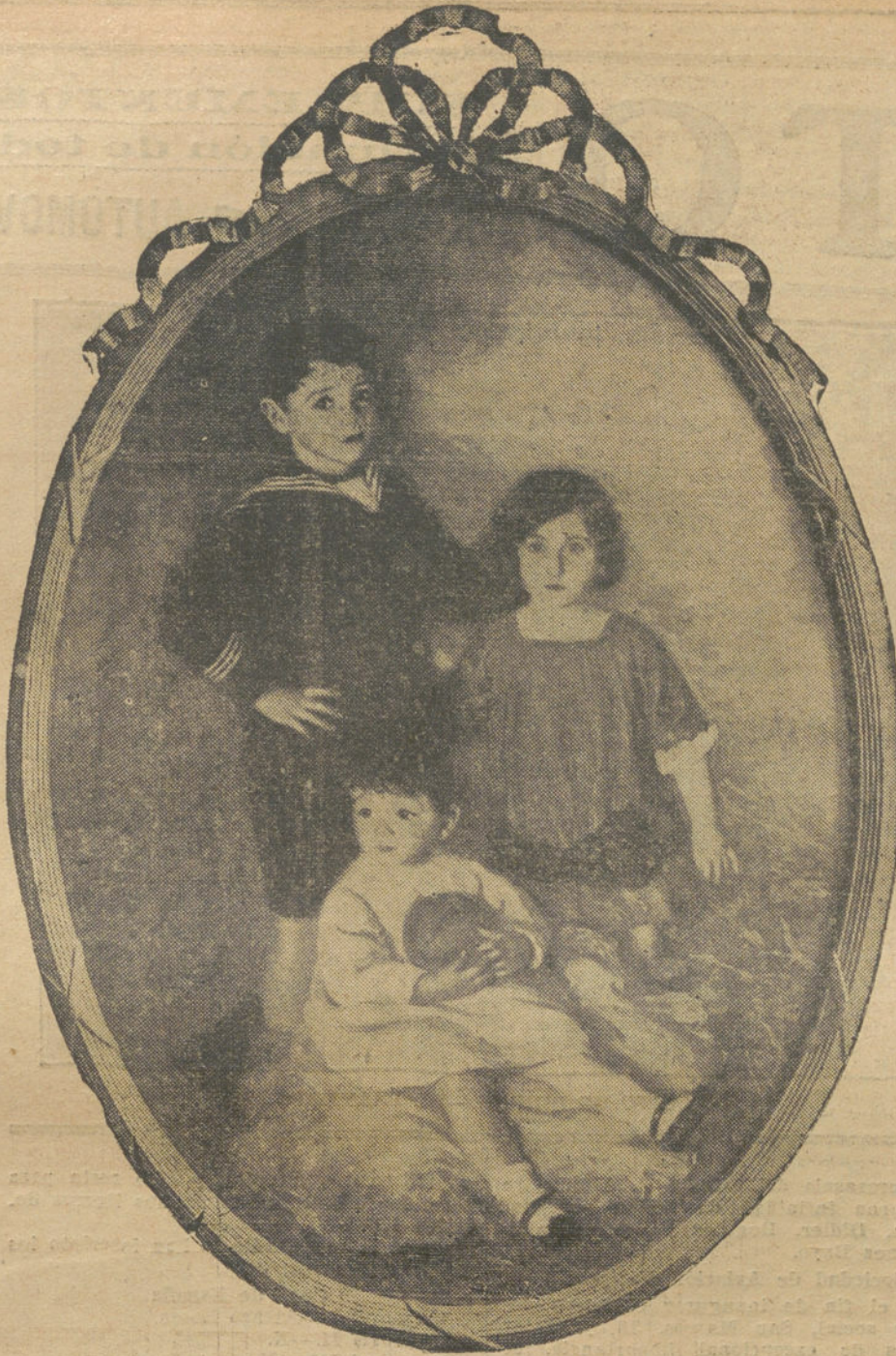
LA PROXIMA EXPOSICION.—"Los hijos de Luis de Tapia", cuadro de Eugenio Hermoso.

Porque, aunque sea doloroso confesarlo, son tan pocos, tan contados, los que laboran en la acción patriótica del africanismo, que cuando vemos que alguno, y más si es militar, pone su esfuerzo en nuestra causa, y une su trabajo al nuestro noble y digno que aspira al bien de la nación, sentimos el halago de una promesa triunfadora en el ideal y abrimos nuestra esperanza para que la lucha sea fuerte y sea constante.