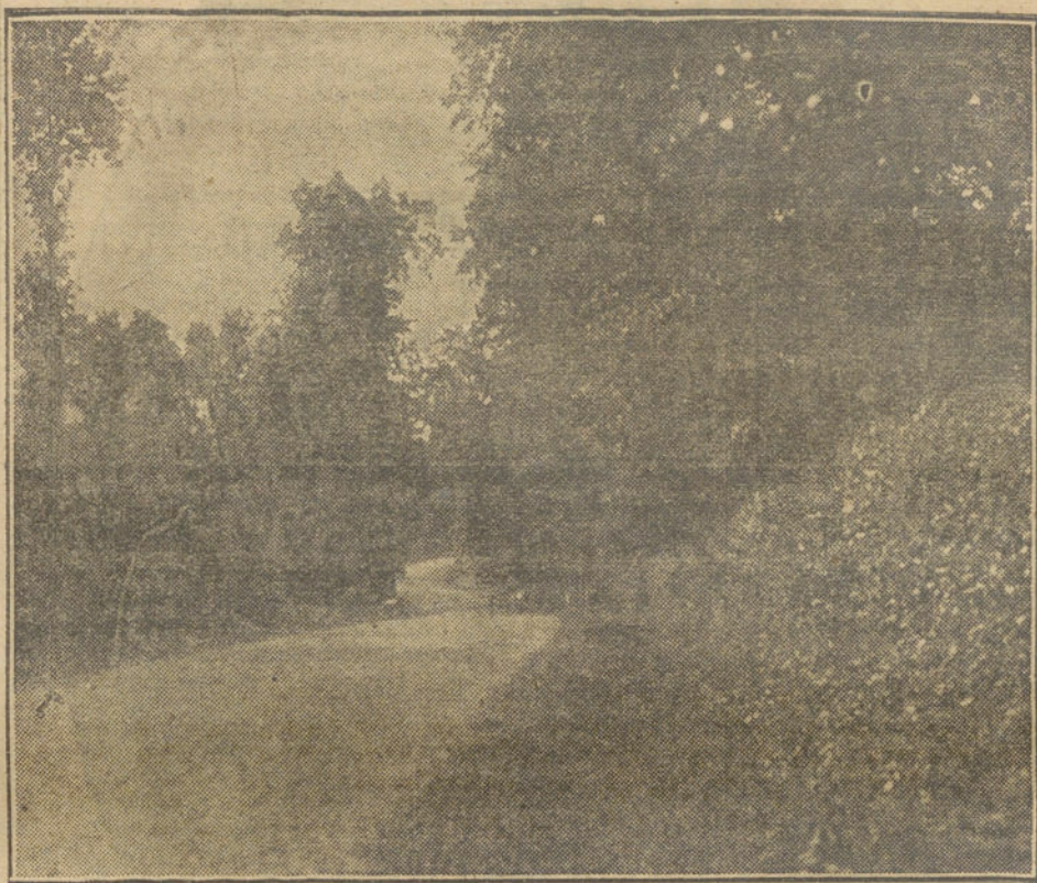
CIRCUITO DE DIEPPE.—EL TRAYECTO.