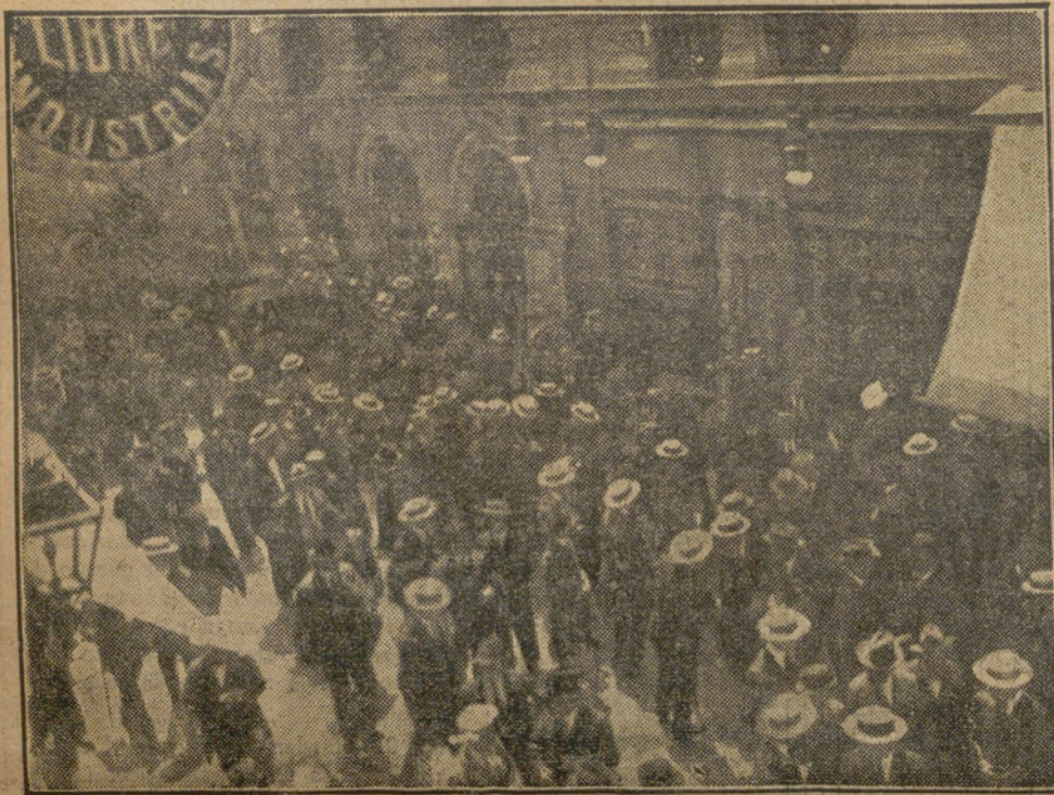
LA REUNION DE LOS INGENIEROS INDUSTRIALES.—Salida del Teatro de la Comedia, donde se celebró.

Francia, según la Prensa socialista alemana, no es tan pacifista como en Alemania se cree. Francia acaricia la idea de una guerra y está jugando con fuego, lo que puede ser muy peligroso.—Sterz