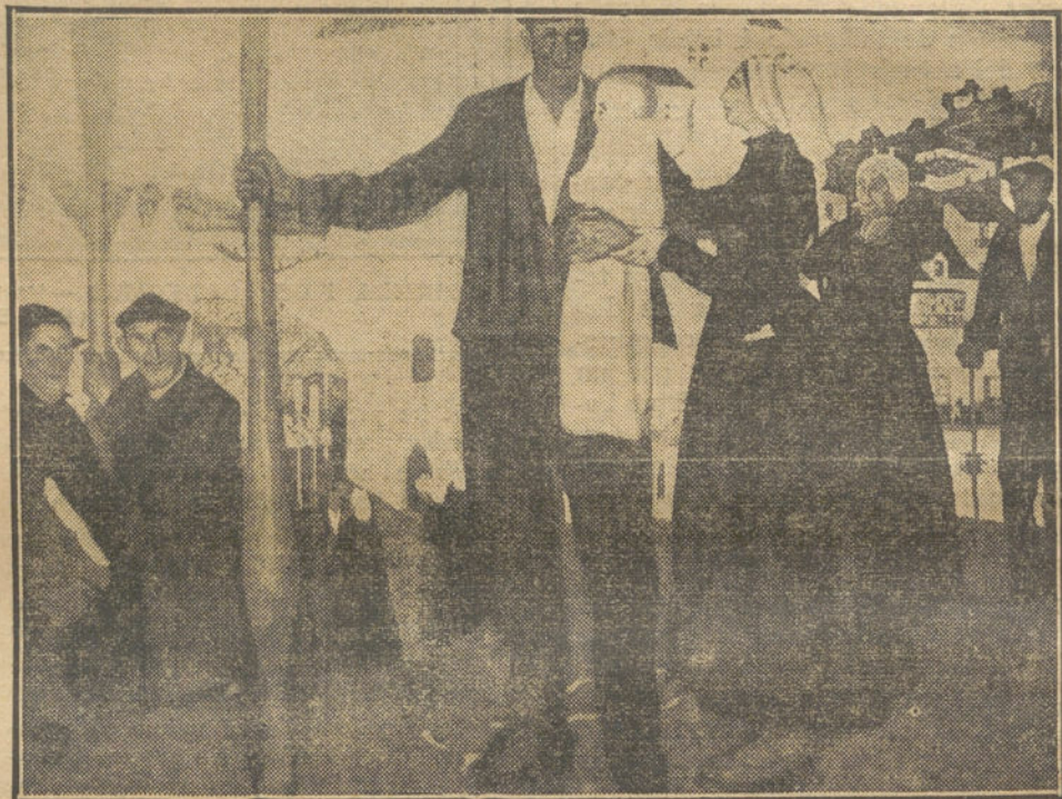
LA PROXIMA EXPOSICION.—"Al regreso del pescador vasco; el primer hijo", cuadro de Ramón de ZUBIAURRE.

LONDRES (10 mañana) del 11. Al terminar la votación del "Home Rule" numerosos grupos de irlandeses apostados frente al palacio Westminster acogieron la noticia con estruendo.