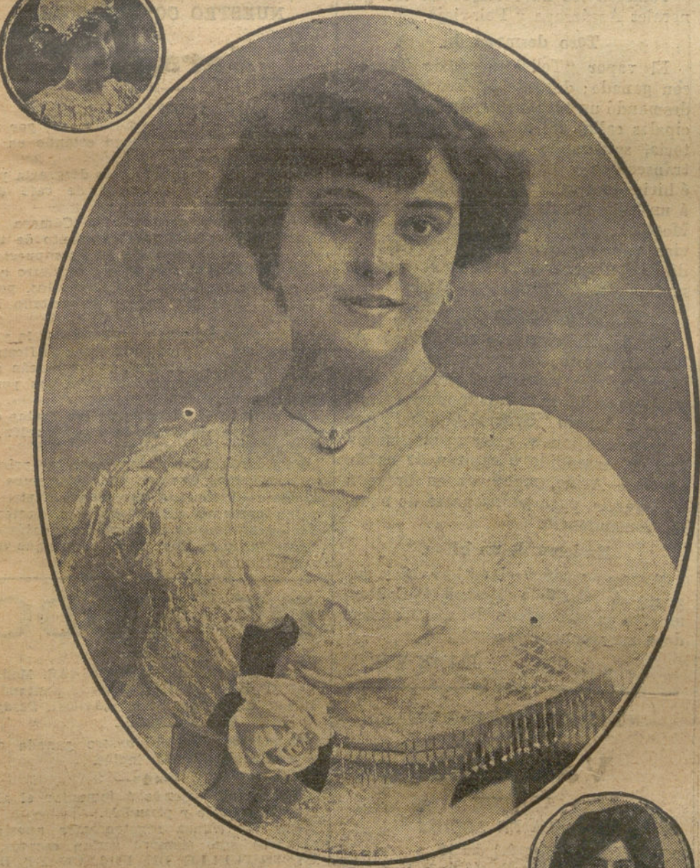
MERCEDITAS PARDO, gentilísima actriz de Lara, que celebra esta noche su primer beneficio.