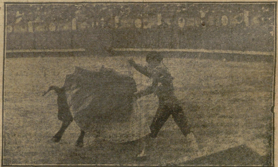
LA CORRIDA DE AYER.—Pastor en el segundo toro.