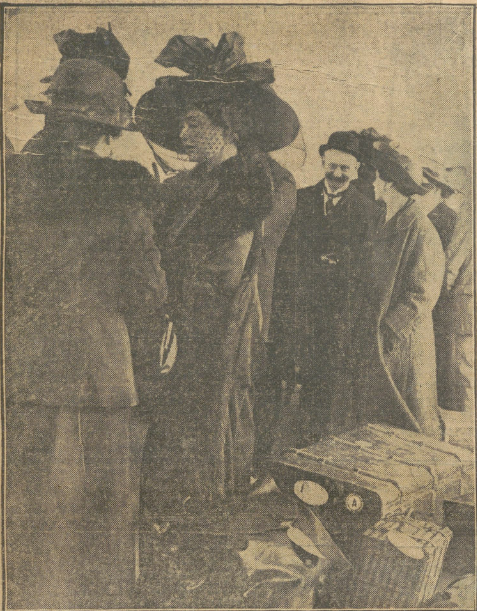
La viuda del coronel ASTOR, con el equipaje de su marido, muerto trágicamente en la catástrofe del "Titanic".