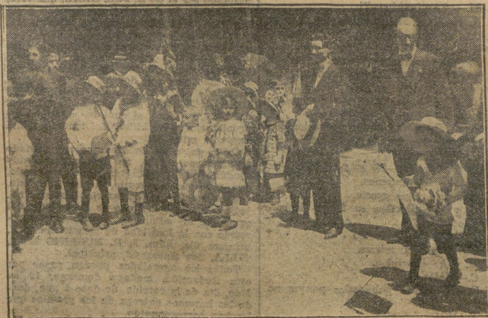
La fiesta de los niños celebrada esta mañana en Palacio.

El Sr. Dato, "conservador", estaba dispuesto a suscribir lo propuesto por los señores Bergamín y Andrade, y el mismo levantado espíritu animaba a los diputados de la minoría "carlista"; pero los Sres. Azárate y Moret, un "republicano" y un "demócrata", se obstinaron en que prevaleciera los angostos y mezquinos términos de la pro-