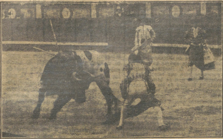
LA CORRIDA DE AYER.—Galito pasando de muleta á su primer toro.