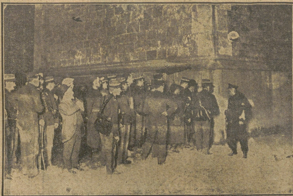
Los soldados y la Policía preparándose para asaltar la casa donde fueron muertos los bandidos franceses GARNIER y VALLET. (Fotografía obtenida á las dos de la madrugada.)

2 de Junio, mañana, sesión de la Asamblea; tarde, visita al Convento de la Rábida y al puerto de Palos; noche, banquete ofrecido por la dipu-