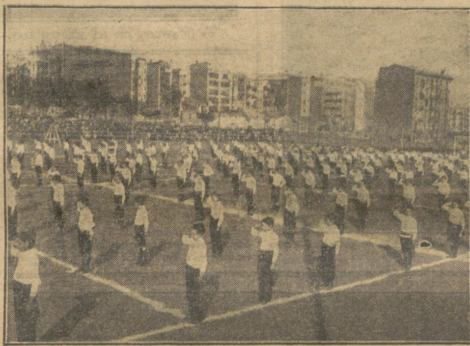
GINNASIA SUECA, ejecutada por 750 niños de las Escuelas Pías de Barcelona, durante el festival benéfico recientemente celebrado en la capital catalana.

primer premio por valor de 1.500 francos.