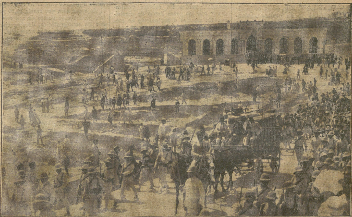
Conducción del cadáver de EL MIZZIAN, desde el Hospital indígena a la estación para ser trasladado a Se-gangan. Le acompañan su X padre y hermano.

Yo salí de París, en compañía de un matrimonio francés y de un joven norteamericano. Hasta la frontera belga fuimos examinándonos los unos a los otros, sin cambiar palabra. Al lle-