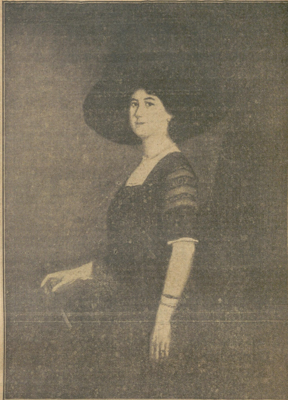
CUADROS DE LA EXPOSICION.—Retrato, por JOSE LLASERAS.