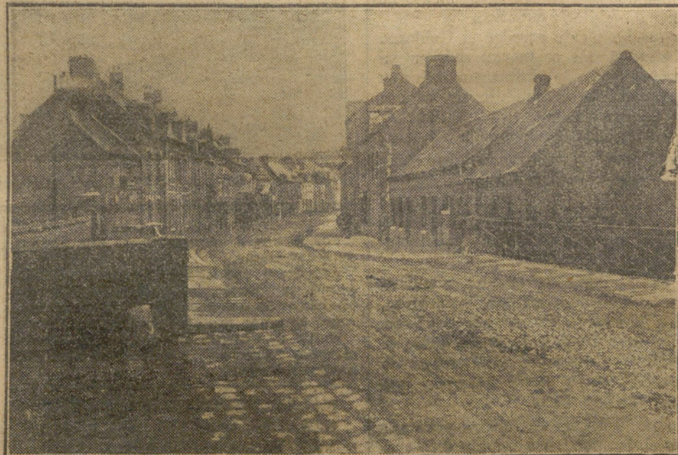
CIRCUITO DE DIEPPE.—Salida de Criel