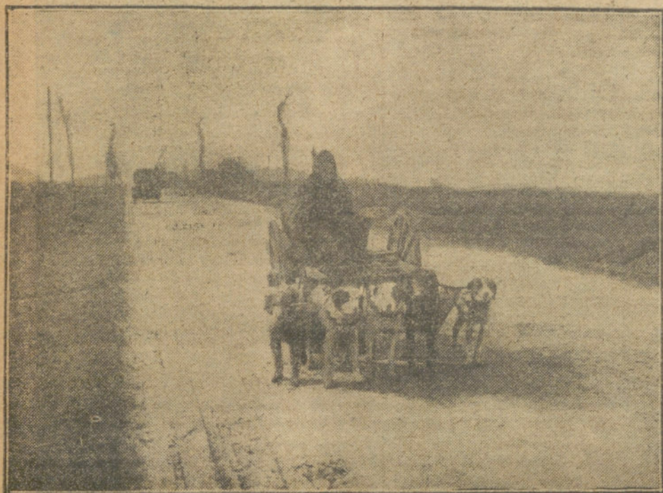
Una vista de la carretera donde se verificará el CIRCUITO DEL A. C. E.