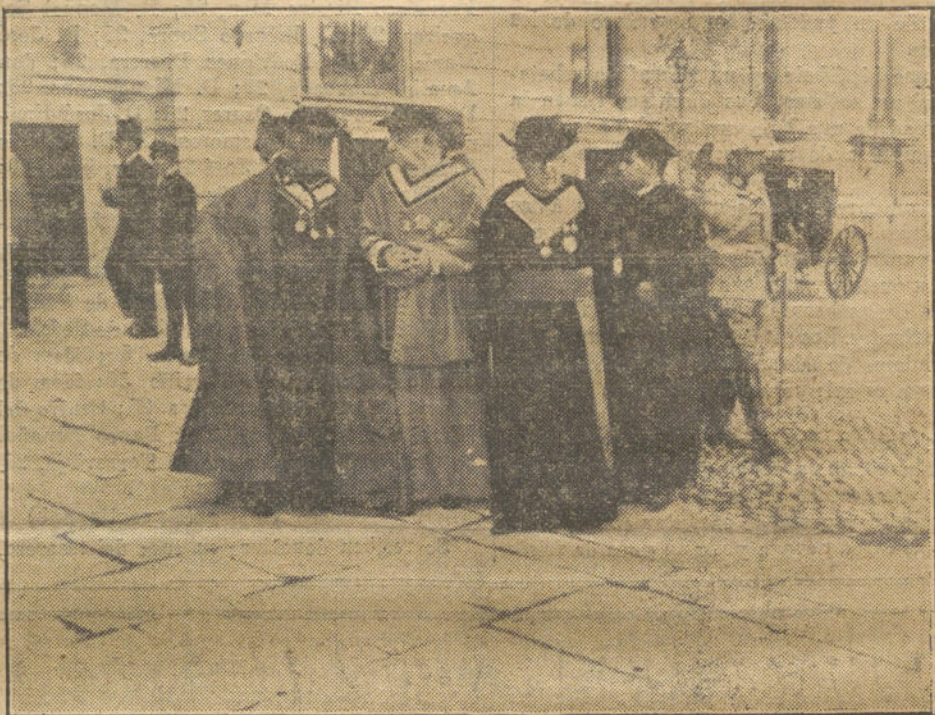
EL CUMPLEAÑOS DEL REY.—Los prelados á su salida de Palacio, después de felicitar al Rey.

Nada concreto nos ha querido decir el distinguido ex ministro, excusándonos cortemente su respuesta, con la evasiva de que la comisión ha de volver á estudiar con mayor detenimiento el proyecto de presupuestos del Sr. Navarro Reverter.