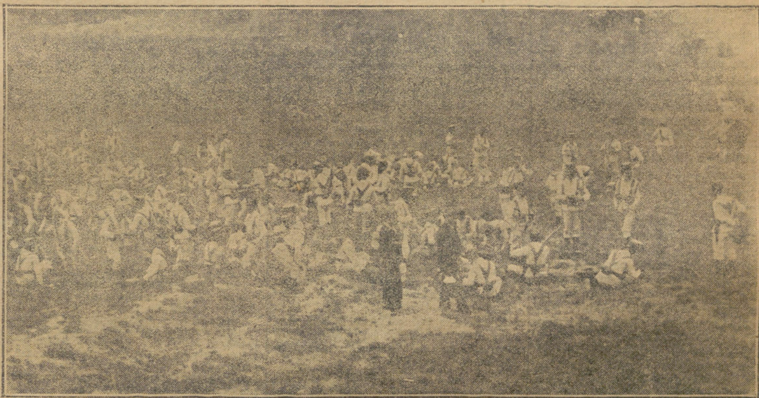
LAS MANIOBRAS MILITARES DE CARABANCHEL.—Un descanso.

cipio de la construcción, pues como sólo existía una iglesia en la parte alta de la población, el vecindario del barrio nuevo sufría grandes molestias para poder cumplir sus deberes religiosos.