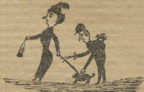
A la vuelta del paseo.—Por Eulalia Flores (9 años).