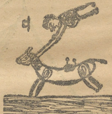
Un mal jinete.—Por Amador Pereira (8 años).