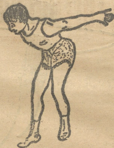
Un bañista.—Por Martín Aguado (11 años).