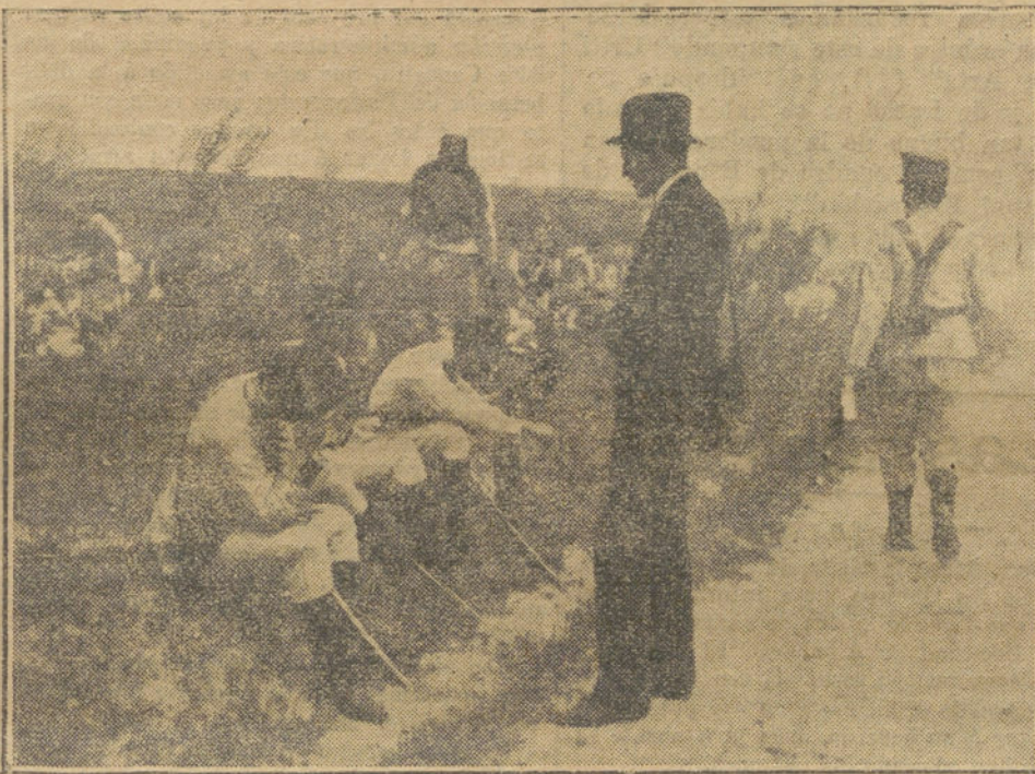
LAS MANIOBRAS MILITARES DE CARABANCHEL.—El infante D. Alfonso descansando en una avanzada.