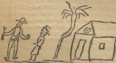
Contigo, pan y cebolla.—Por Luis Gómez (9 años).