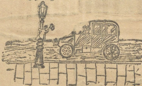
No hay peligro.—Por Carlos Bellesheros (9 años).