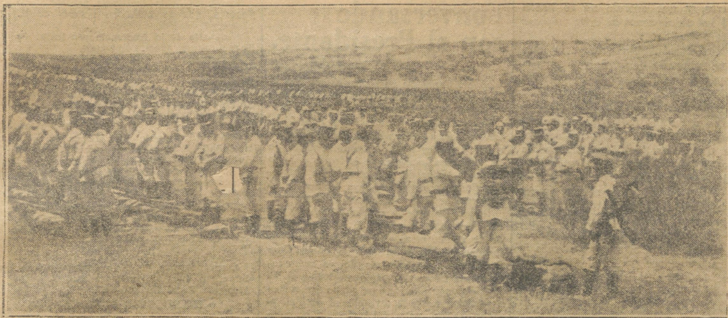
LAS MANIOBRAS MILITARES DE CARABANCHEL.—Preparando el rancho.