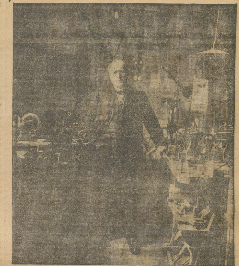
BRANLY, el sabio francés que fijó el principio de las ondas ertzianas, y á quien con motivo de la catástrofe del "Titanic" ha entrevistado nuestro redactor en París. BRANLY ha manifestado que aunque él fué el primero que concibió la utilidad de las ondas ertzianas para la telegrafía sin hilos, la gloria del invento corresponde exclusivamente á Marconi. Las declaraciones de Branly, han puesto término á las polémicas recientemente sostenidas entre los partidarios de los dos sabios.

Es preciso insistir en lo que decíamos ayer. Si el organismo director de la Exposición, el Comité Ejecutivo, no traduce pronto en obras lo que tiene meditado, después de dos años de estudios preliminares, debe, sin dilaciones ni titubeos, con la diáfana meridiana que reclaman las circunstancias, levantar nábila