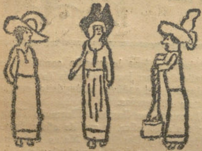
Tres señoritas cursis.—Por Jesús Ferrero (12 años).