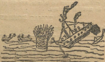
El naufragio del "Titanic".—Por Rafael Ayales (9 años).