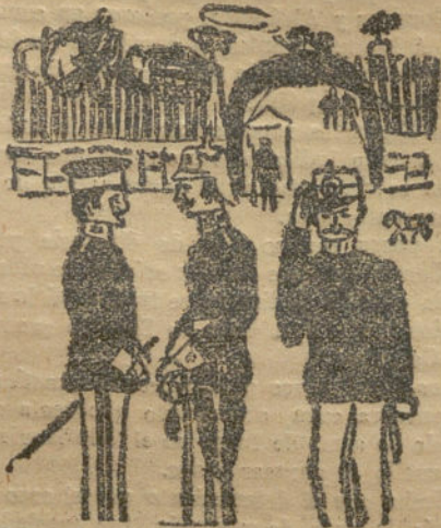
Escena militar.—Por M. García (12 años).