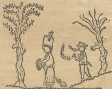
En la Moncloa.—Por Josefa Rojas Castillo (11 años).