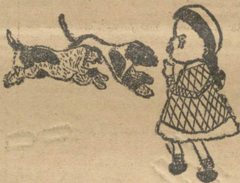
¡Mamá, que miedo!.—Por Isabel Béjar (11 años).