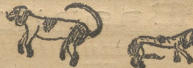
El perro de mi tío Juan, cuando va a cazar y cuando vuelve.—Por Pepito Matas (10 años).