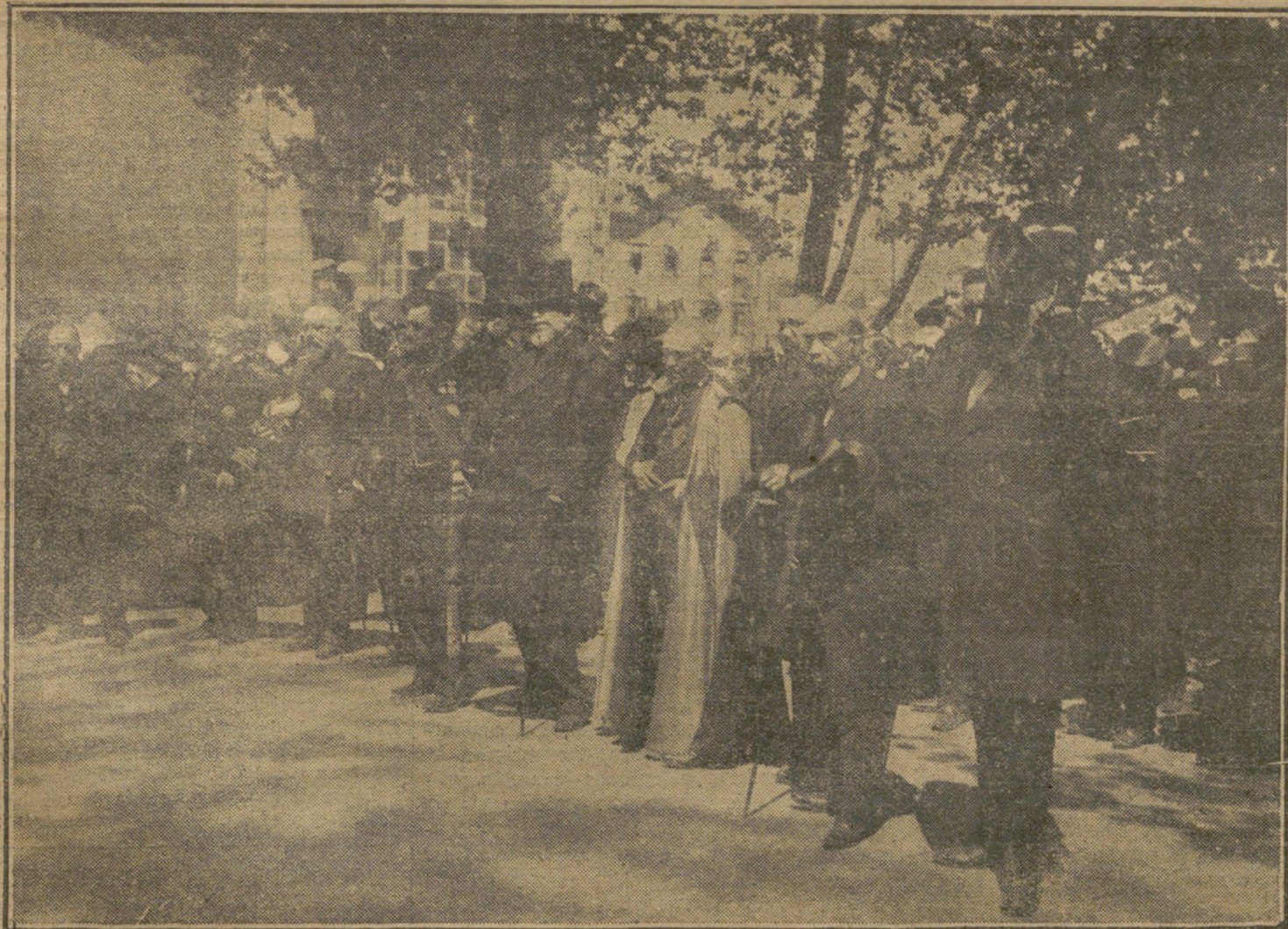
LA MUERTE DE MENENDEZ PELAYO.—Presidencia de honor del entierro.

muy por debajo de su capacidad y de lo que la opinión esperaba de él.