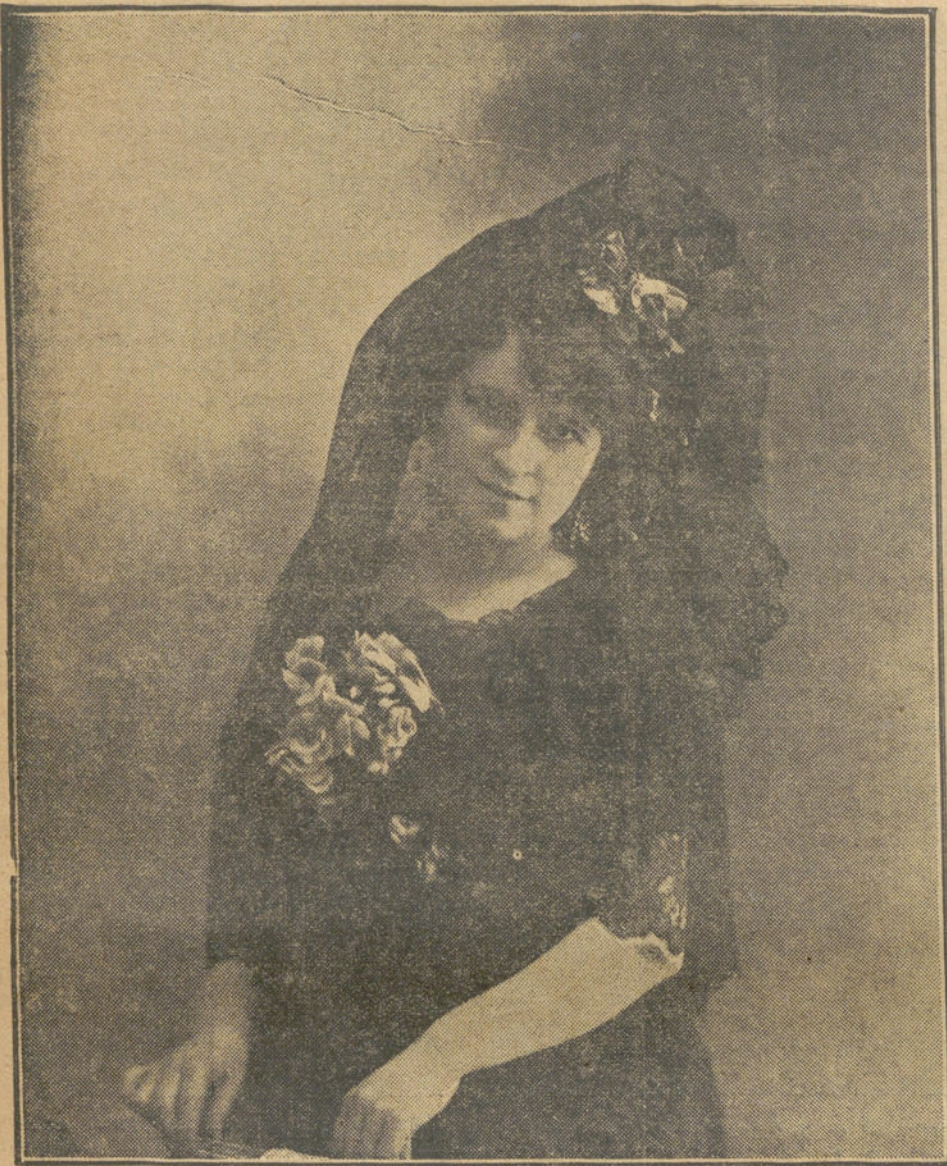
La bellísima artista LA GOYA, que anoche se despidió del público de Lara.