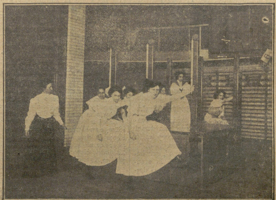
LA EDUCACION FISICA EN INGLATERRA.—Una maestra enseñando a descender de un tranvía en marcha a sus discípulas.