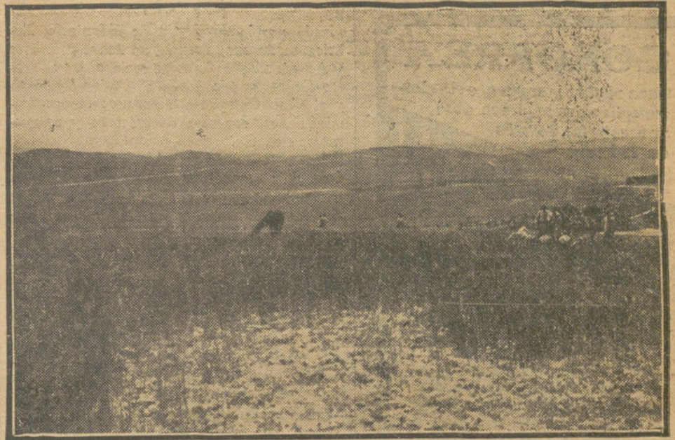
LA CAMPAÑA DE MELILLA.—1, 2 y 3, últimas posiciones ocupadas por nuestras tropas, después de las escaramuzas del día 18.

Avilés.—La popular empresa teatral "La Peña", arrendataria del Teatro Somines, ha contratado para cuatro funciones á la