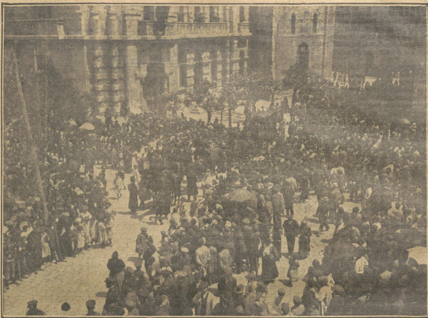
MAS DEL ENTIERRO DE MENENDEZ PELAYO.—Imponente manifestación de duelo, al paso del féretro por las calles de Santander.

Deducir la importancia de las personas por su indumentaria, es vulgaridad imperdonable; hay majaderos que ni para bañarse se quitan el sombrero de copa, y hombres meritisimos que nunca supieron llevar bien puesta una corbata. El portero, de consiguiente, habrá de "olfatear" á su interlocutor y no dejarse alucinar por sus apariencias, conocer la petulancia pedigüeña disimulada bajo una levita, ó el positivo valimiento oculto bajo una timidez; saber, en fin, quien importuna y quien llega á tiempo. Y esto no lo dice la ropa, precisamente; antes lo descubren los ojos del visitante, su voz, sus ademanes, aquel "no se qué", interior gesto de puro abolengo espiritual, que distingue á unos hombres de otros.