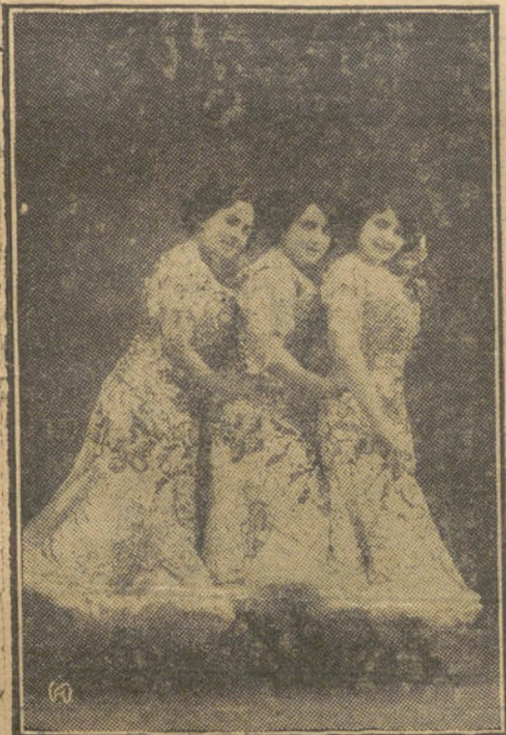
EL TRIO DEL MONTE, que actúa con gran éxito en el Trianón Palace.