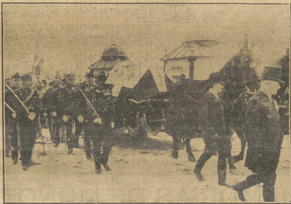
ENTIERRO DEL REY DE DINAMARCA.—En coche fúnebre.

Esta mañana ha sido recibida en audiencia por el Sr. Canalejas, quien guiado de las razones que la Comisión le expuso, y de las simpatías que le inspiran las justas pretensiones de esta juventud intelectual, dióles palabras que pudieran significar una esperanza, por tanto, altamente agradecida de las nobles intenciones y buena voluntad del ilustre presidente.