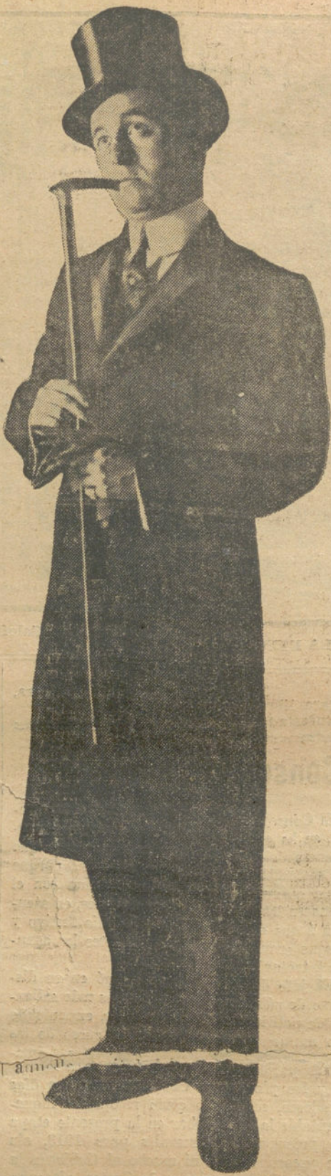
El popularísimo actor RAMON PESA, que esta noche celebra su beneficio en Eslava.