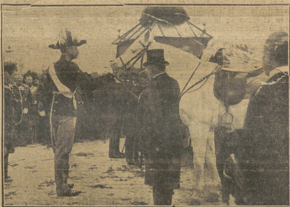
ENTIERRO DEL REY DE DINAMARCA.—El rey Christian acariciando el caballo de su padre.