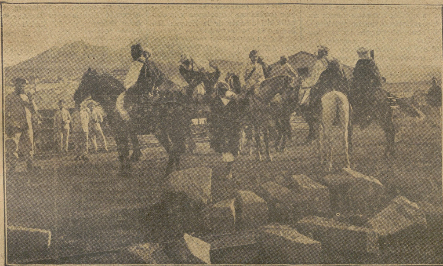
LA CAMPAÑA DE MELILLA.—Policías indígenas de la "mía" de Atlaten, que llevaron el cadáver del Mizzian a presencia del general Ab

do calles y los contratistas levantando edificios. En el día de hoy, millares de casas están construyéndose en Berlín, lo que demuestra una gran confianza tanto en la industria local como en la fertilidad de los matrimonios berline-