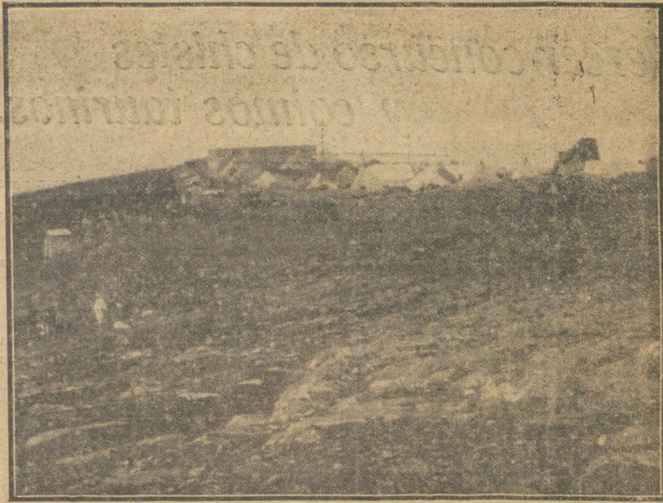
LA CAMPAÑA DE MELILLA.—Posición del Harcha, donde se batió últimamente al enemigo.

Velázquez hubiera pensado que, con la ayuda del tiempo, su cuadro llegaría a envejecer y esto deben pensar también los berlineses a propósito de Berlín. Berlín envejecerá, ¡qué duda cabe! y los berlineses envejecerán con él. Los berlineses son también demasiado nuevos, con sus caras lucientes é