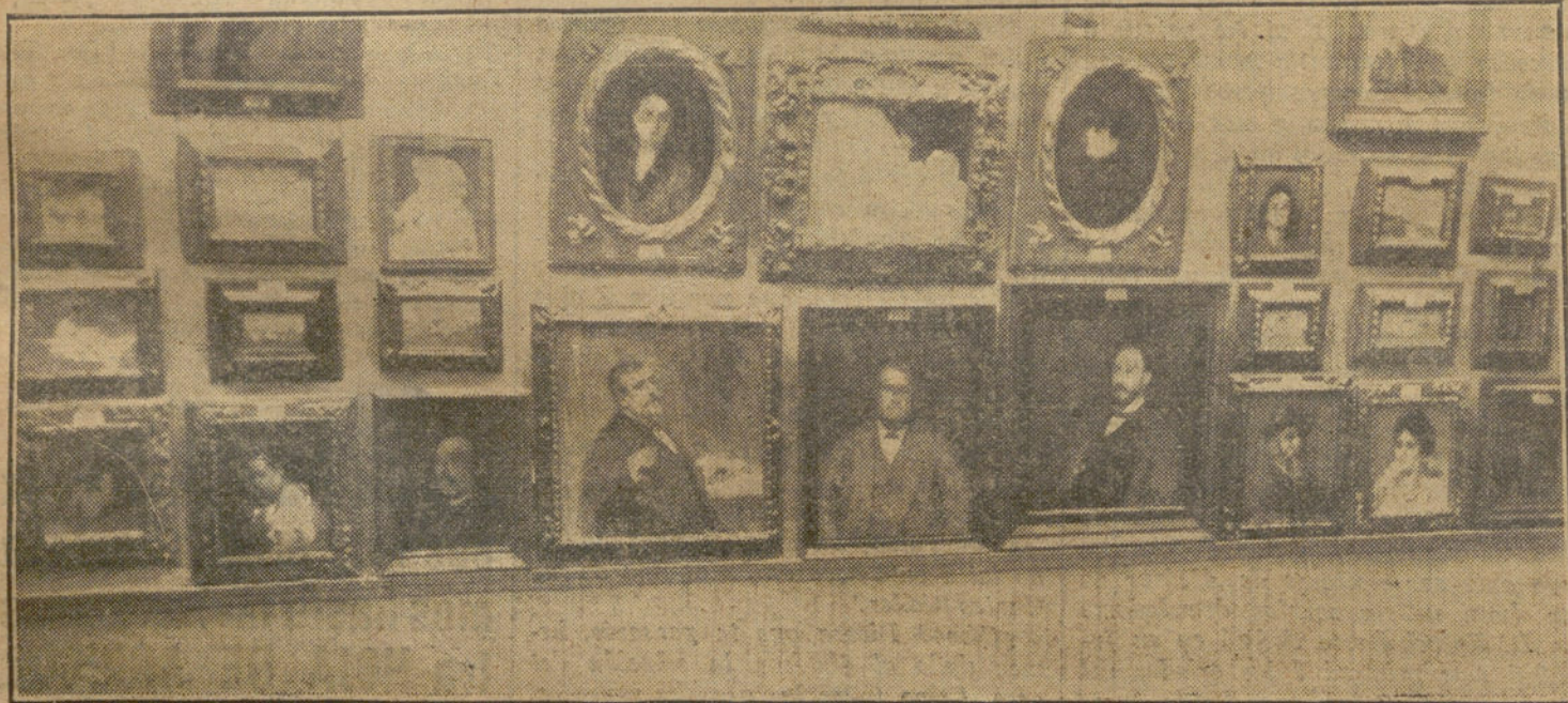
Instalación de PINAZO en la Exposición Nacional.