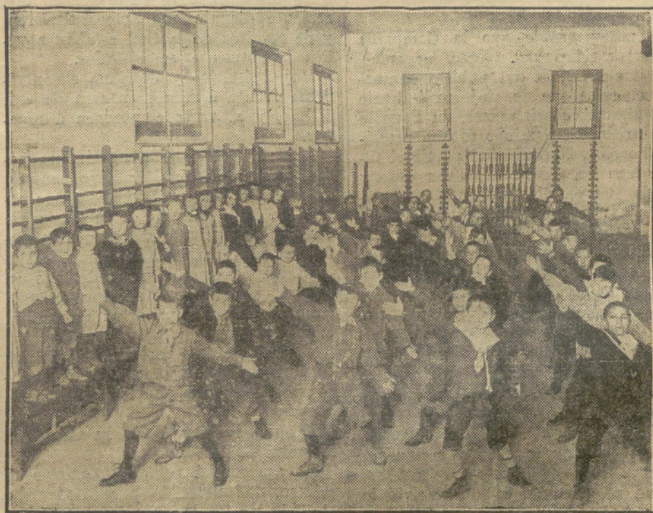
GIMNASIA SUECA.—Movimientos rítmicos.

Todos los regalos que hemos hecho a nuestros concursantes de la Página Infantil, fueron adquiridos en la maravillosa Exposición de juguetes del