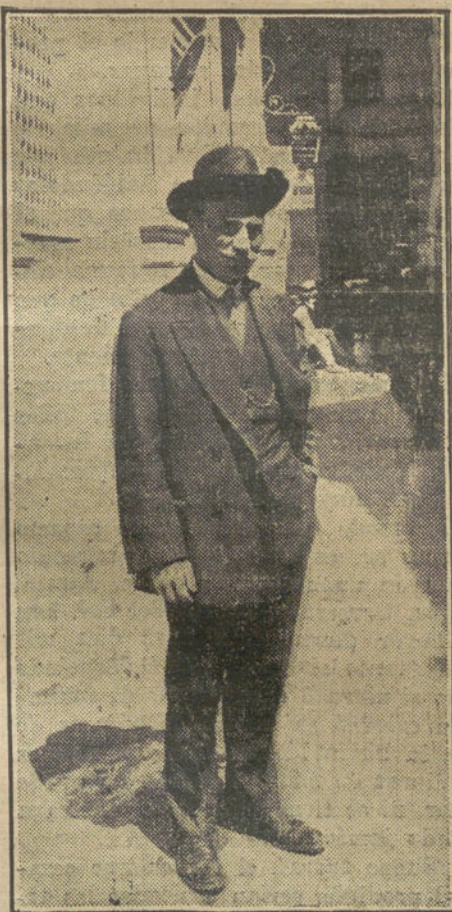
El célebre profesor MALLADA, primero en el mundo que ha conseguido bajar a las entrañas del Vesubio, y obteniendo a 300 metros de profundidad las interesantísimas fotografías que publicamos en nuestro número de ayer.