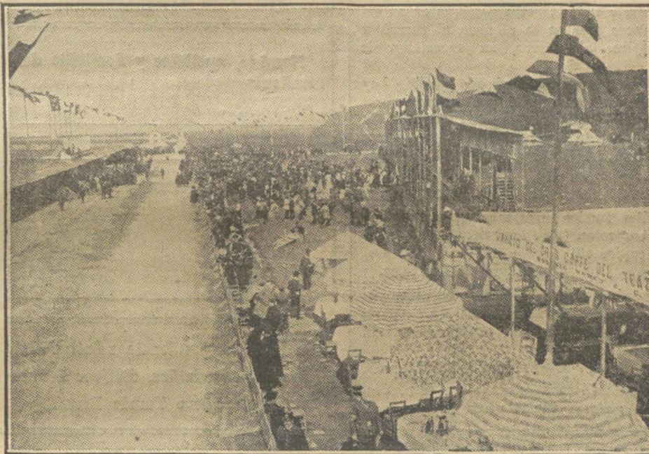
Carrera de autos la TARGA-FLORIO, celebrada en Sicilia.—Lugar de la llegada.

Las graves noticias recibidas que llegaron de España, contenidas en los telegramas de Madrid, anunciando el tercer asalto de Fez, contribuyeron a aumentar el pánico y el desasosiego en la opinión.