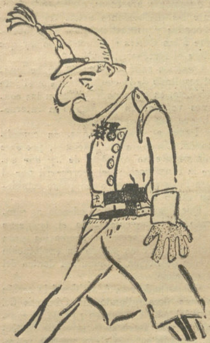
Marte, de conquista.—Por Luis Oller. (ocho años).

mientos de Gimnasia rítmica; han trepado con asombrosa agilidad por las pulidas pértigas que, oscilantes, cuelgan del techo; después de la clase, en un patio soleado y alegre, han jugado durante un buen rato, y al