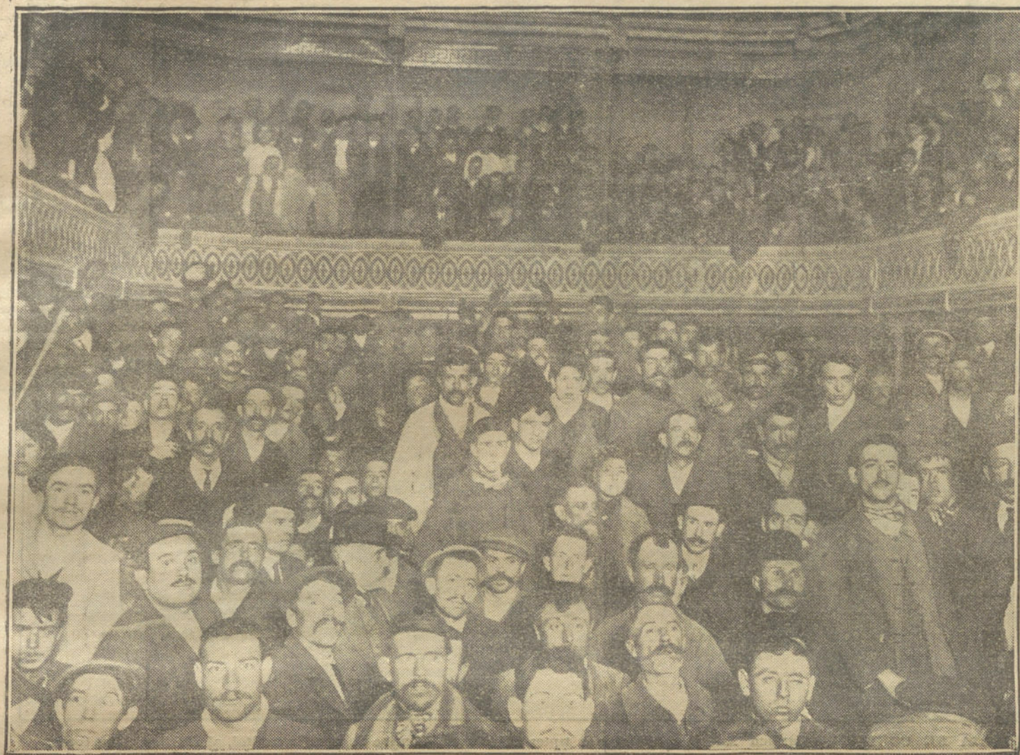
Aspecto del teatro Barbieri durante el mitin celebrado por los ferroviarios.