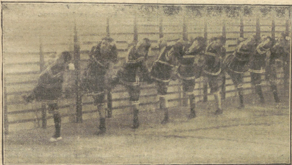
GIMNASIA SUECA.—En las espalderas.

Retornamos al centro de Madrid; el tranvía nos hizo cruzar frente a nuestro Palacio Municipal, y el repórter sonreía al pensar que en aquella casa no saben que hay