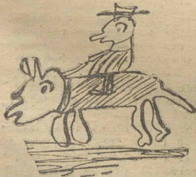
Mi hermano encima del perro.—Por Eugenio Avalos (7 años).

Todas ríen, charlan, brinean con sano deleite. Acérranse a saludar a D. Marcelo con