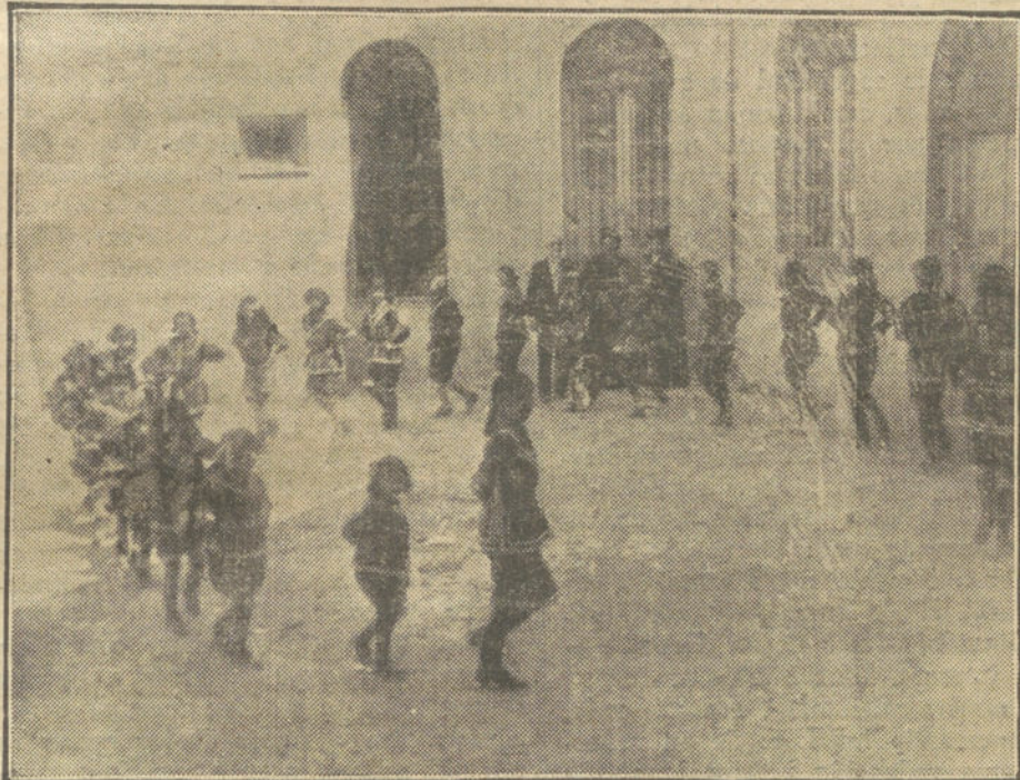
GIMNASIA SUECA.—El paseo.

En un ángulo de aquel amplísimo salón, Enrique prepara su máquina. D. Marcelo me enseña, mientras tanto, los escasos apa-