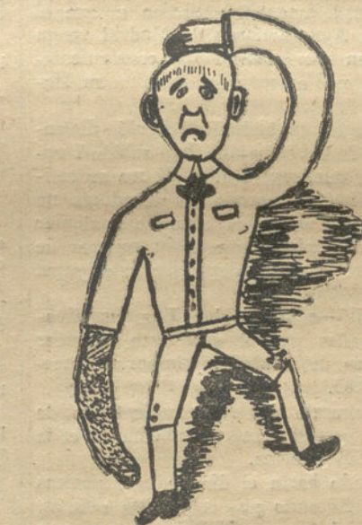
Un percance del oficio.—Por Fernando Alfaro (11 años).

respeto amistoso, ya que él no es un domine con fruncido ceño y aspecto terrible, sino un amigo de sus alumnos, un amigo al cual todos los pequeñuelos quieren, porque cuando están con él, es cuando más se divierten.