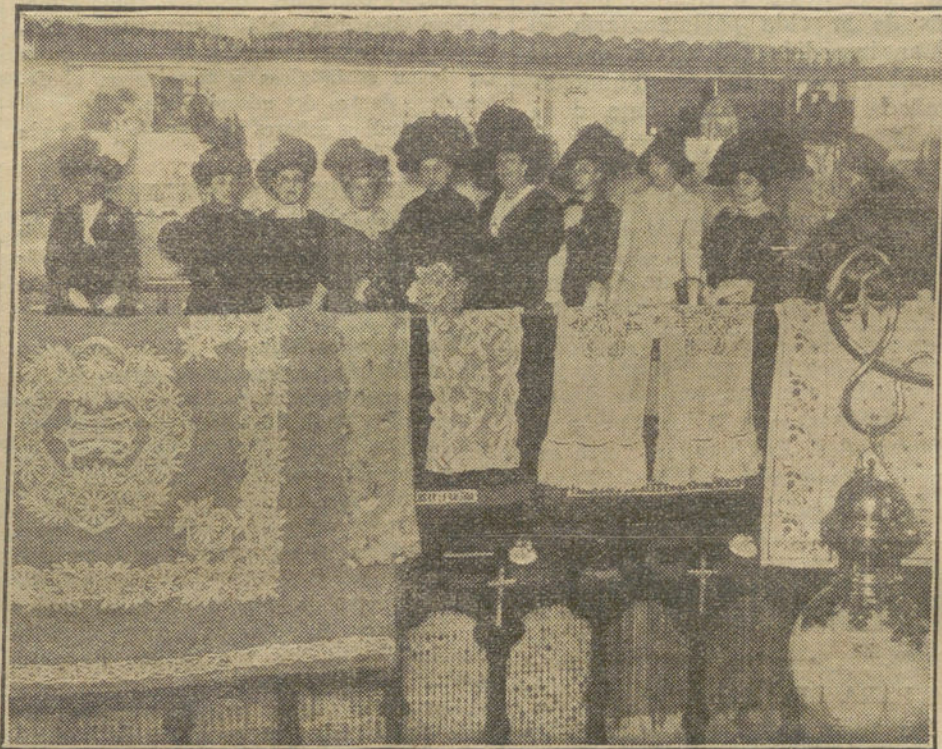
La infanta María Teresa inaugurando la Exposición de Trabajos de la mujer, verificada ayer tarde.