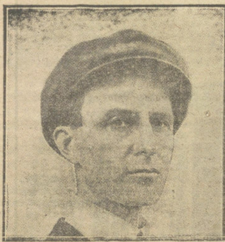
Wilbur Wright, el primer hombre-pájaro, ha muerto en Dayton (Ohio) Estados Unidos, víctima de la fiebre tifoidea. Cuando los discípulos consiguen asombrar el siglo con sus proezas, el maestro muere en un lecho, muy lejos del heroísmo y de la intrepidez que distingue á su aventurera profesión.

Anunciando la subasta para la conducción del correo á caballo entre las oficinas del Ramo de Navalperal de Pinares (Ávila) y Cebreros, por 1.195 pesetas anuales; disponiendo se esta-