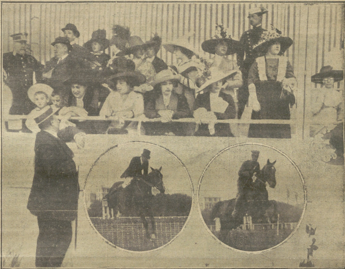
EL SEGUNDO DIA DE CONCURSO HIPICO INTERNACIONAL.—Aspecto de una de las tribunas.—De saltos.

Me imagino que, media hora antes de llegar á Francfort, el viajero debe sentir un débil olor á salchichas que irá acentuándose gradualmente. Digo esto, aún á sabiendas de que no todas las salchichas de Francfort son naturales de Francfort. En París, donde también se hacen salchichas de Francfort, es frecuente ver este letrero: "Sauceses et Francfort of ecrevisses vivants". Yo compré un día dos docenas de "ecrevisses" y un kilo de salchicha y lo llevé todo á una casa amiga para que lo guisaran. Resultó que los "ecrevisses" estaban muertos desde antiguo, pero en cambio, la salchicha tenía una vitalidad prodigiosa. En cuanto la pusieron al fuego comenzó á colear desesperadamente. Cuando me la comí estaba viva todavía y, dentro del estómago, yo sentía á veces una cosa así como si la salchicha se levantara para llamarme criminal. En vano traté de aturdirme y de hacer oídos sordos á la voz de la salchicha. En el momento menos esperado yo la sentía incorporarse contra mí de un modo implacable. Aquella noche dormí muy mal. La salchicha se me apareció repetidas veces en mi sueño, diciéndome: —¡Miserable! No podrás conmigo. Todos los ácidos de tu estómago son impotentes contra mí. A cada minuto siento que se acrecen mis fuerzas. Es-