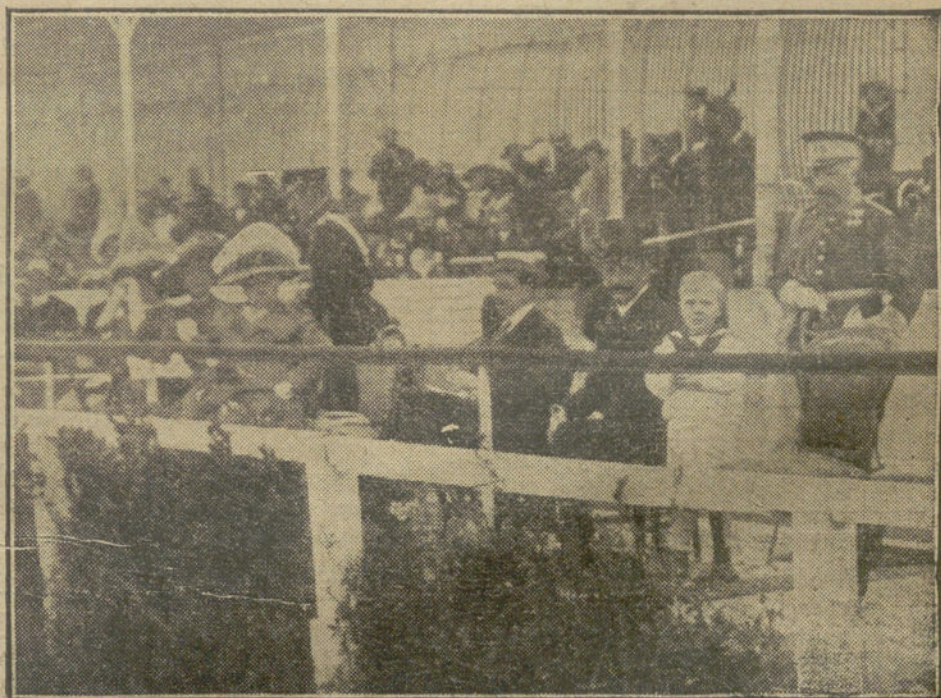
La familia real presenciando las pruebas del Concurso Hípico.