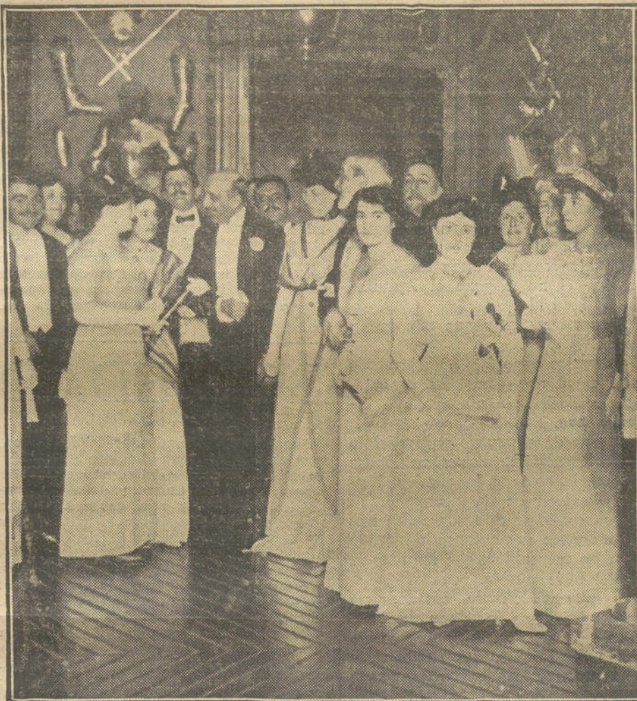
Un ángulo del salón de fiestas en el palacio del marqués de Cerralbo.

Este, que estuvo recluido en un correccional por sus fechorías y sus crímenes, después de cumplir su condena, entró al servicio de una casa de labranza, en donde asesinó a una anciana de setenta y tres años y a un niño de cuatro meses.