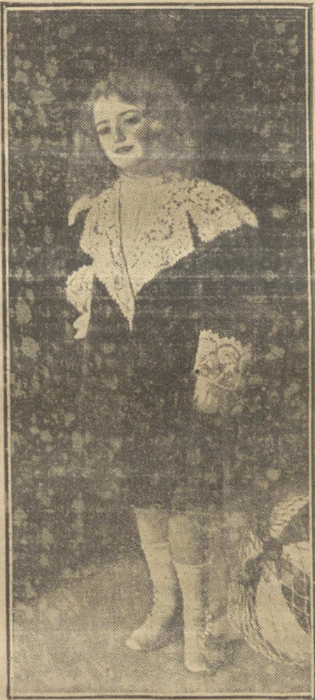
Retrato de mi hija", por EUGENIO VIVO.

Con gran retraso se ha recibido un despacho de Fez, anterior a los últimos combates, en el que se dice que el general Liautey celebró una entrevista con el Sul-