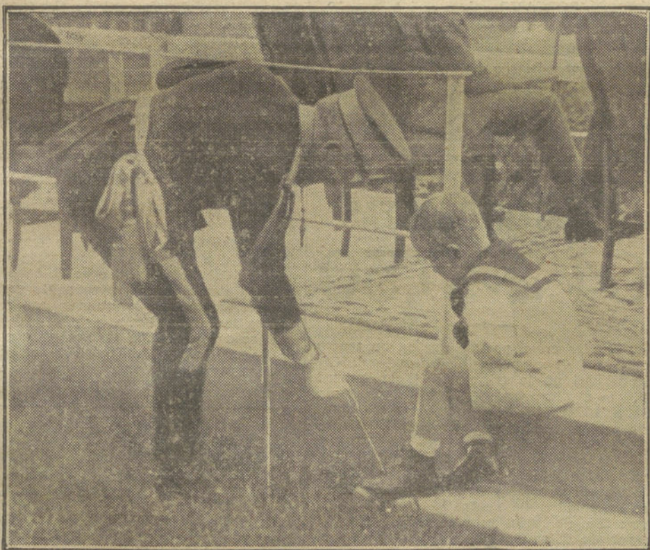
El PRINCIPE DE ASTURIAS jugando en el Hipódromo durante la segunda prueba del Concurso Hípico Internacional

toy vivísima y he devorado ya media docena de estos cangrejos que saboreaste con tanta delectación.