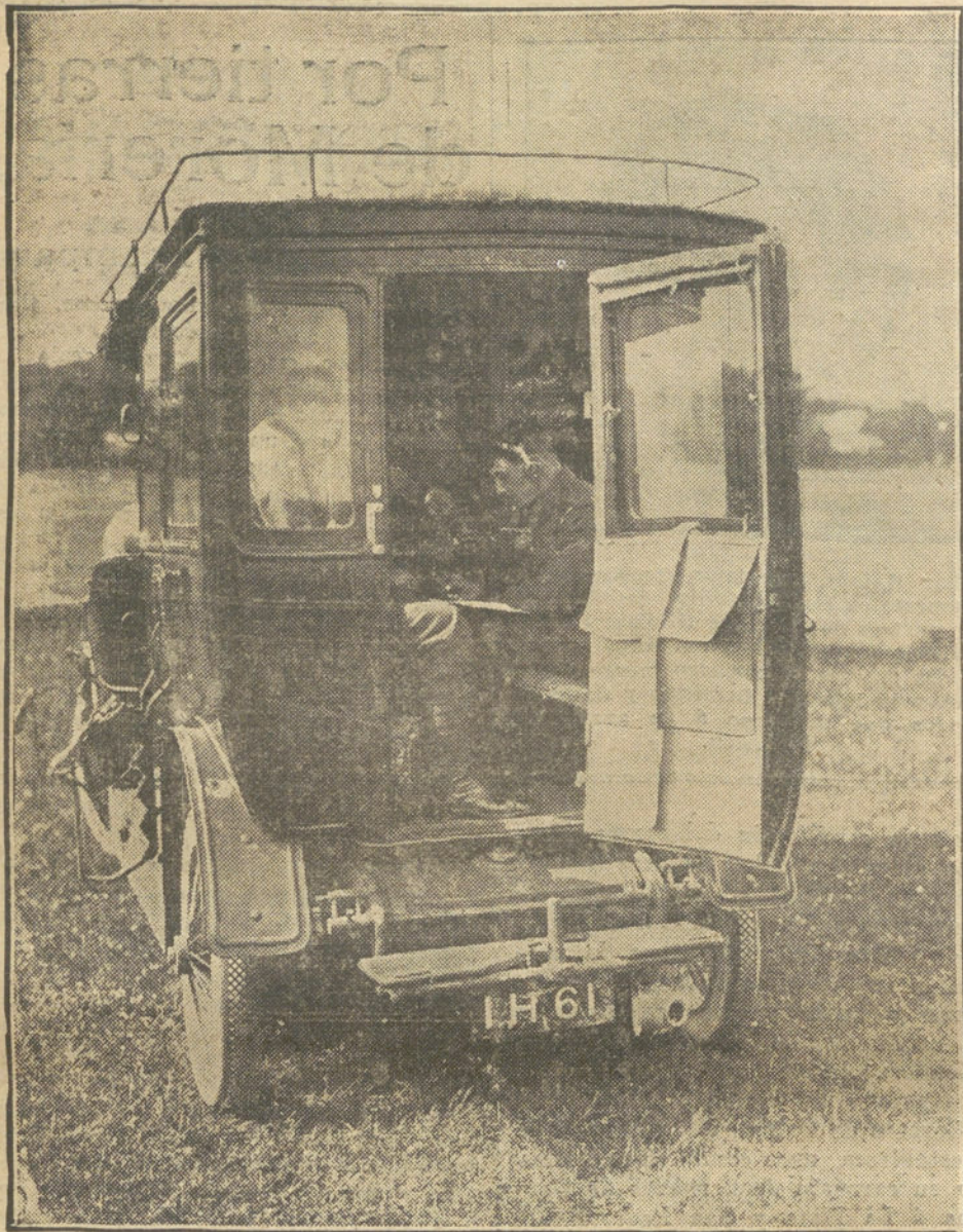
LOS PROGRESOS DE LA TELEGRAFIA SIN HILOS.—Un coche-automóvil transformado en estación ambulante, en el momento de transmitir unos despachos. Pruebas verificadas con extraordinario éxito.