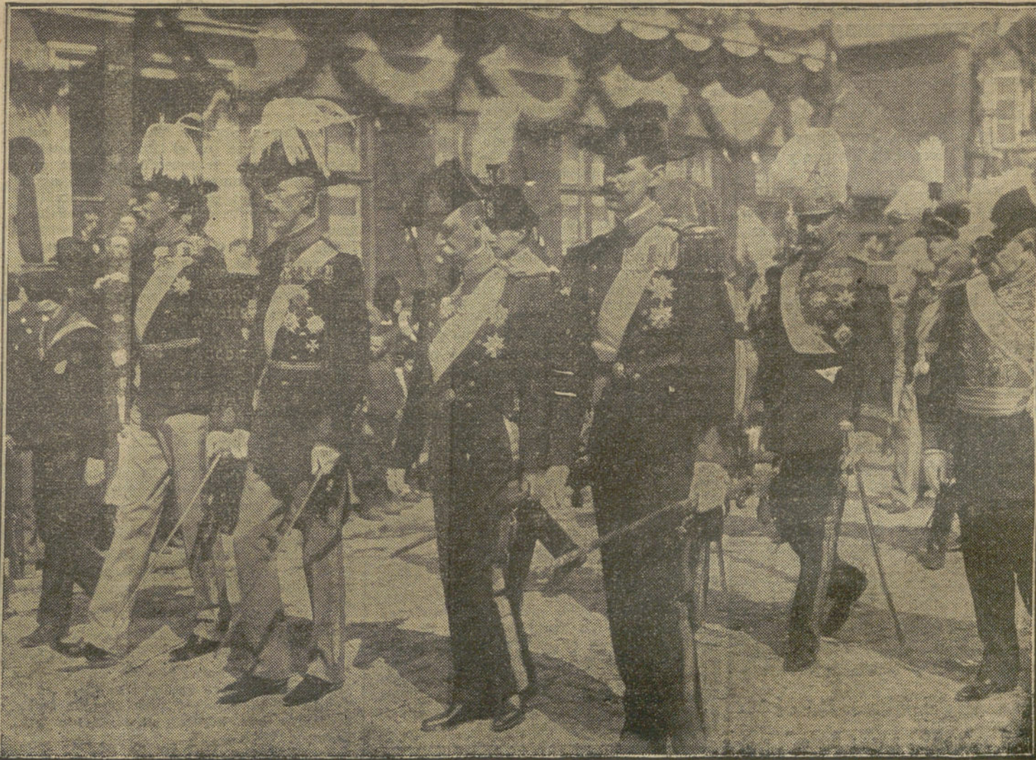
Los cuatro Reyes de Dinamarca, Suecia, Grecia, Noruega, y el infante don Carlos, en representación de España, presidiendo los funerales del Rey de Dinamarca.

También dedicamos un piadoso recuerdo á las víctimas de tan horrorosa tragedia.