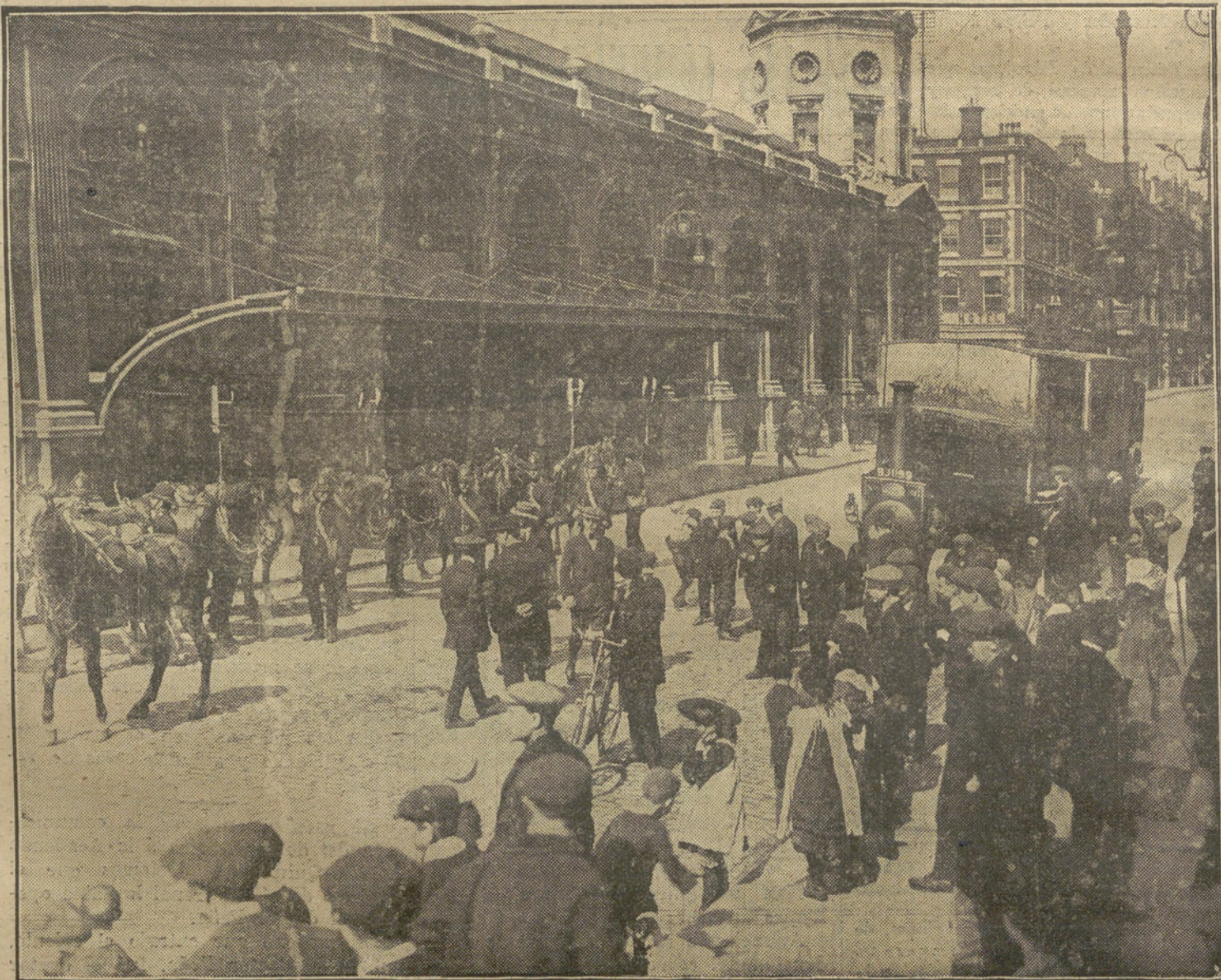
LA HUELGA INGLESA.—Un convoy de carne, al llegar al Mercado Central de Londres, de donde diariamente se sacan seis millones de personas, protegido por las fuerzas de Policía.

Las autoridades han ofrecido sus respetos al joven príncipe de Inglaterra. —Hallet.