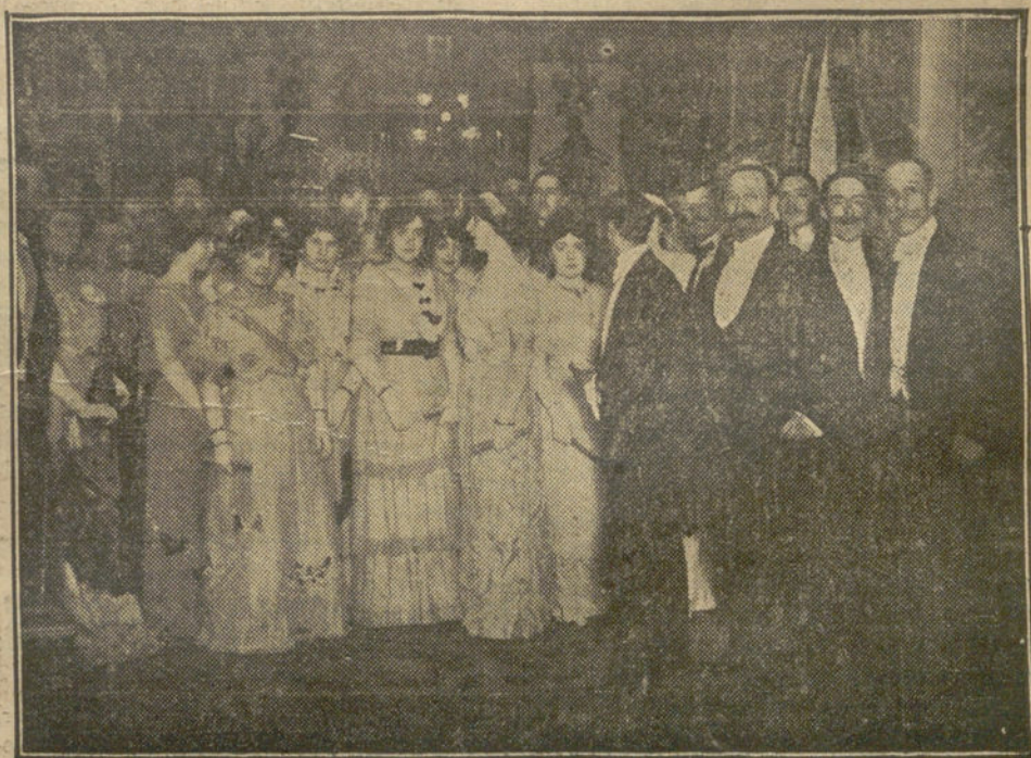
Detalle de la fiesta aristocrática celebrada en el palacio del marqués de Cerralbo

Los Gobiernos de Inglaterra y de Rusia han dirigido las oportunas reclamaciones diplomáticas al Gobierno de Constantinopla.—Chovil.