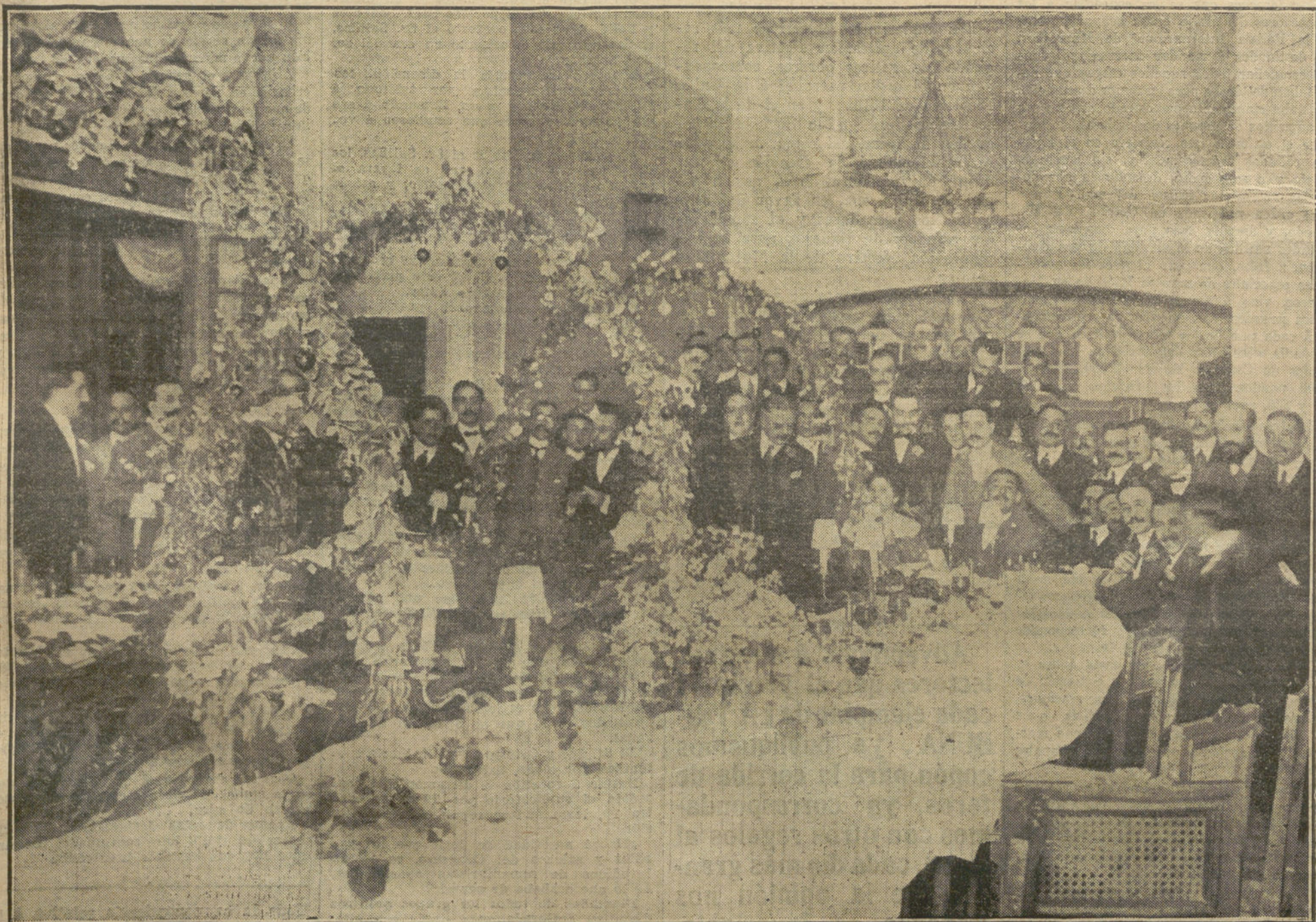
El comedor de Parisiana, donde los redactores de LA TRIBUNA obsequiaron anoche a su propietario y director con un magnífico banquete

En el momento de abrirse el despacho al público, el representante de la autoridad que presidirá el reparto, extraerá una papeleta de una urna, donde habrá tantas como clases de localidades de sombra hay en la plaza (tendido tal, grada cual, etc.), y otra papeleta de otra urna, en donde estarán igualmente las localidades de sol, y por el "tendido, grada, andanada ó paleo" que designe la suerte, comenzará la distribución de localidades entre los lectores que vayan presentando sus series de quince cupones, y una vez concluido el reparto de cada "tendido, grada, etc.", se sacará igualmente a la suerte el que se haya de distribuir, y así hasta el final.