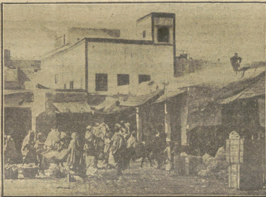
El ZOCO CHICO DE RABAT, transformado ahora en cuartel para las tropas que acompañan á Llautey, residente general en Marruecos, enviado por el Gobierno francés.

El quinto se llamaba "Lirmeño", y era ensabanao, grande, hondo y corrigacho. Con