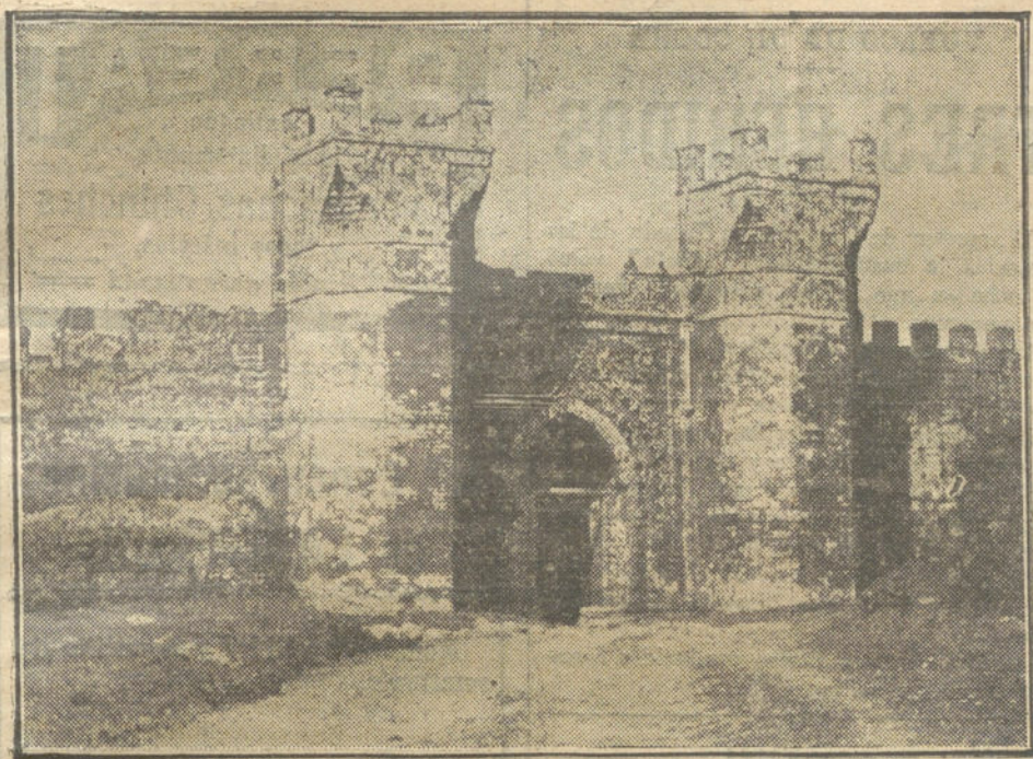
La puerta de hierro de RABAT, por donde se verificó la solemne entrada del general Llautey.