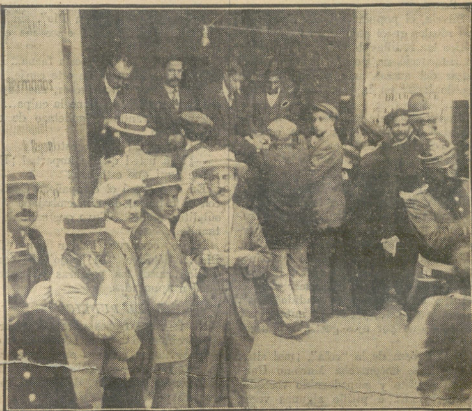
La taquilla de las Cuatro Calles al comenzar el reparto de billetes para la CORRIDA DE LA TRIBUNA.