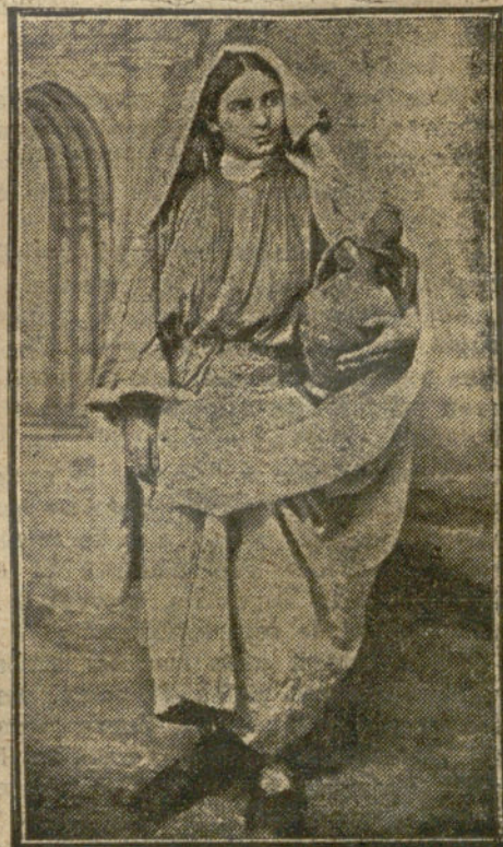
RABAT (Marruecos).—Tipo del país.

Esta mañana han seguido las sesiones de las Cámaras, aprobándose los presupuestos de Justicia y de la Legión de Honor.—Hallet.