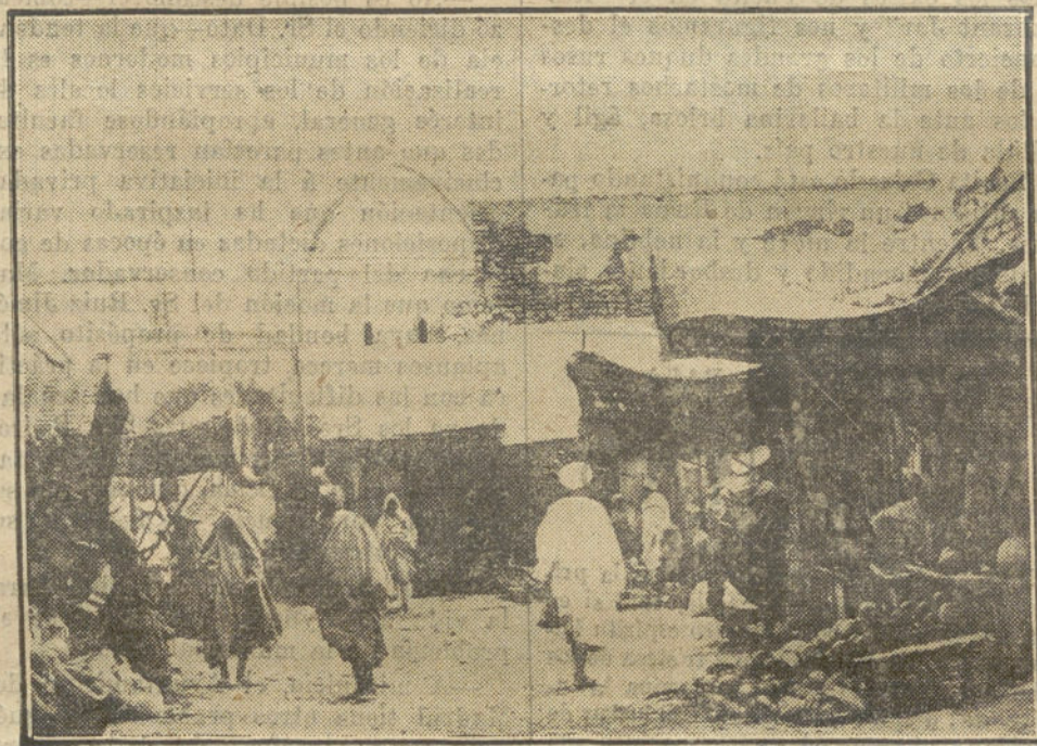
Mezquita y puerta de la Sueca, en RABAT, otro de los puntos donde han establecido su cuartel las tropas francesas, después de los sucesos.

Esta noche habrá banquete, seguido de recepción, en casa de los señores de Beistegui; mañana, comida y "bridge" en la