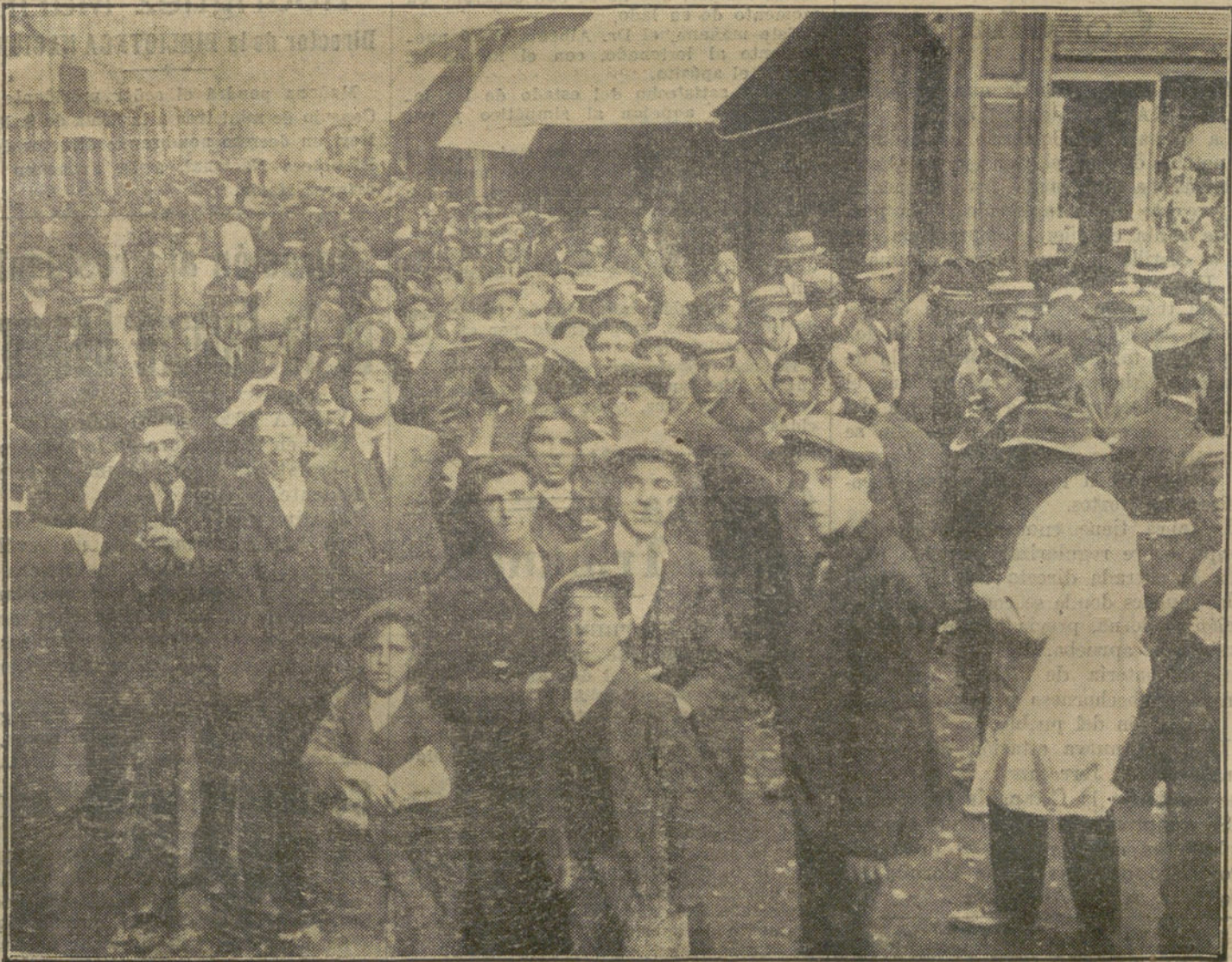
La cola formada á primera hora en las Cuatro Calles, para cangear los billetes para la CORRIDA DE LA TRIBUNA.