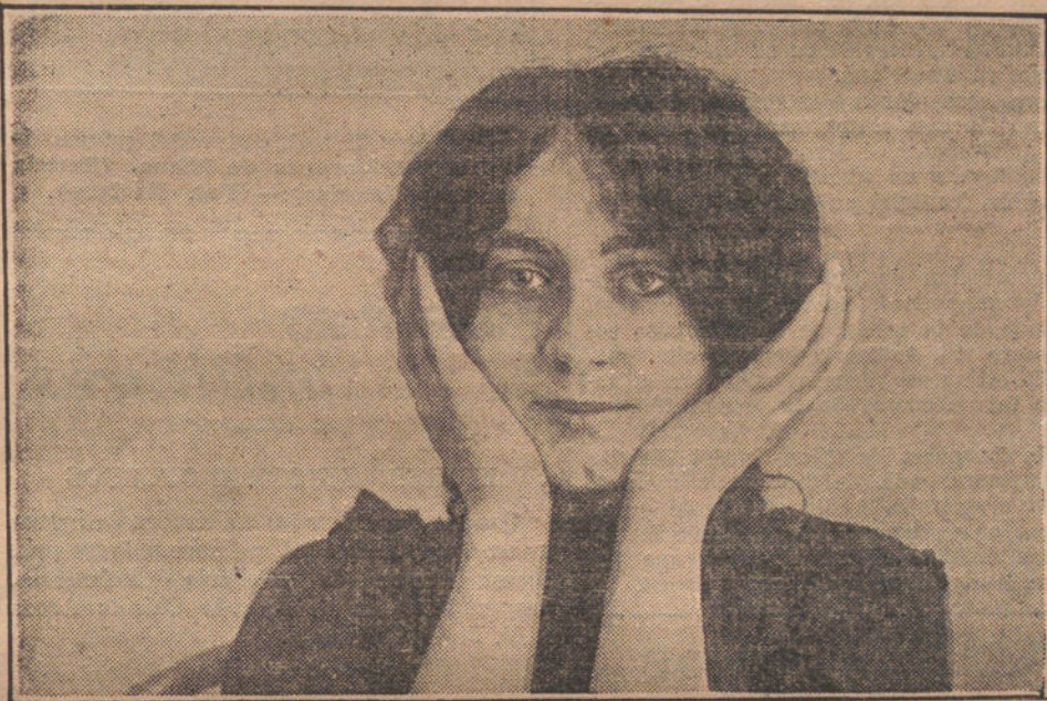
MASAJE de las mejillas.

Dice la bella actriz que la caspa es el peor enemigo del cabello, y que á toda costa hay que desterrarlo si se desea tener un pelo abundante y sedoso; para ello recomienda que se lave la cabeza todos los días por espacio de una semana, frotando primero el cuero cabelludo con un cepillo pequeño, y luego