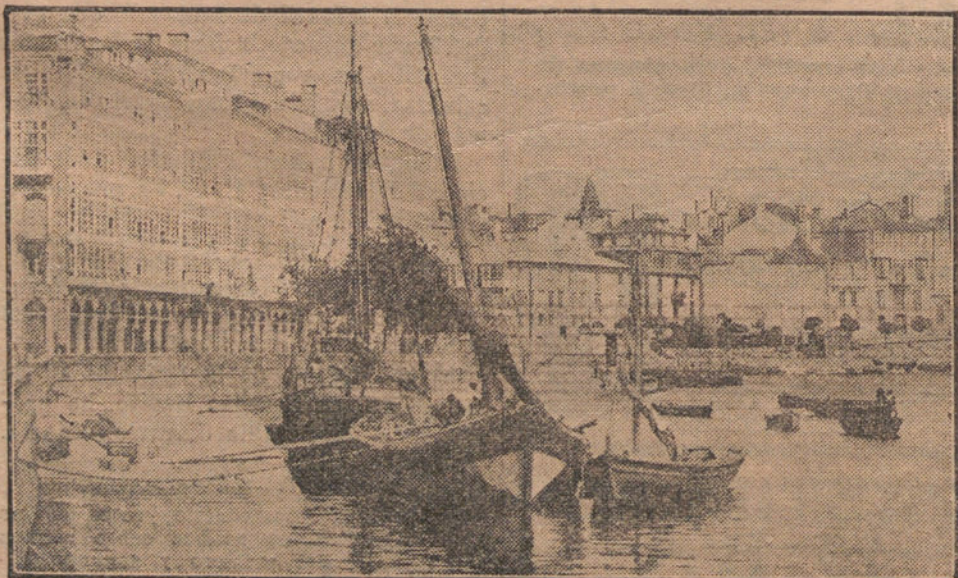
EL RAPIDO DE "LA TRIBUNA".—La calle de la Marina, de La Coruña, puerto que visitarán nuestros lectores.

¿Queréis café puro? Fernando VI, 2. Cervecería.