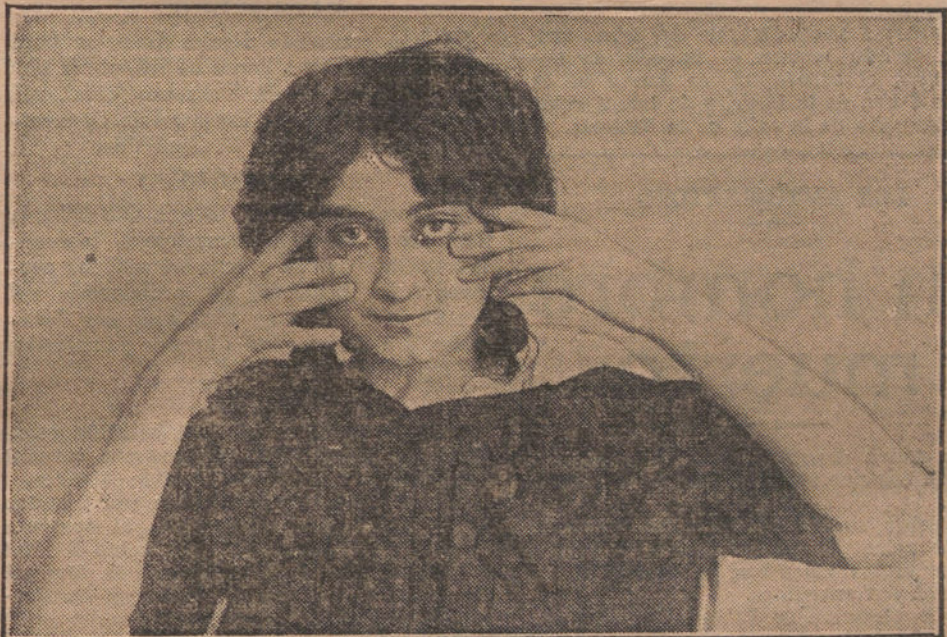
MASAJE de los ojos.

importancia que tiene el cuidado de los ojos, amenazados de dos grandes enemigos, el cansancio y el polvo. Para evitar lo primero, prohíbe en absoluto la lectura con luz artificial y en caminos de hierro, y para lo segundo aconseja que se laven dos veces al día con agua de rosas. Recomienda también, que durante el día se deje reposar los ojos, cerrándolos de vez en cuando, para evitar su continua tensión y desgaste.