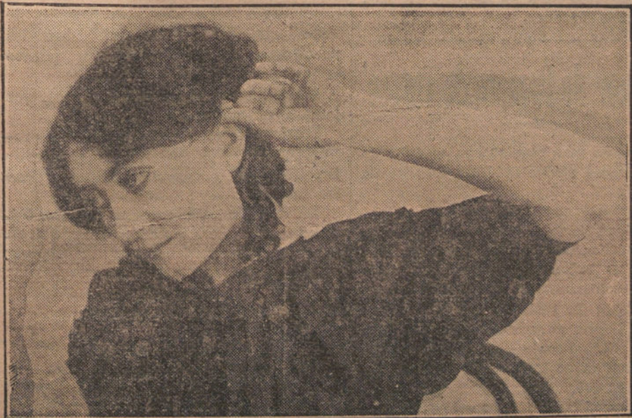
MASAJE de la oreja.