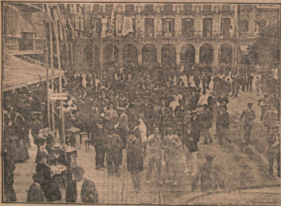
LAS FIESTAS DE PAMPLONA.—Interesoso grupo de forasteros, dirigiéndose á la Plaza para presenciar las famosas corridas de San Fermín.

Otra (rectificada) resolviendo expedientes de alzada interpuesto por