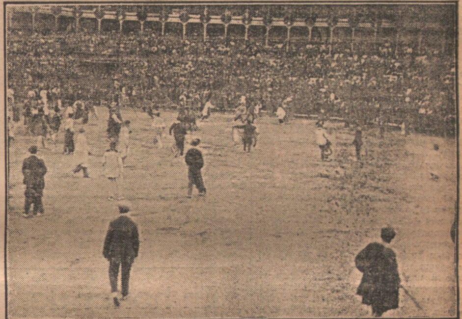
LAS FIESTAS DE PAMPLONA. —Aspecto de la Plaza de Toros durante la novillada, para aficionados, que se celebra después del típico "encierro".

¿Tiene usted algo que vender? Anuncie en LA TRIBUNA.