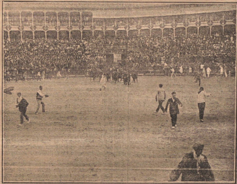
LAS FIESTAS DE PAMPLONA.—Momento de entrar en la Plaza de Toros, persiguiendo á los aficionados, típica costumbre conocida con el nombre de los "encierros".

Después de conocerse el resultado de la votación, armóse una batalla enorme, profiriéndose grandes gritos contra Poincaré; en los bancos de las oposiciones gritos, acompañados de insultos y de tal cual interjección.