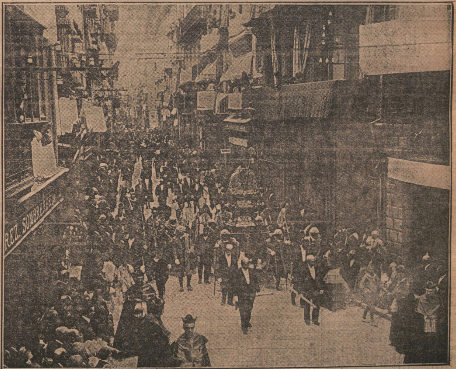
LAS FIESTAS DE PAMPLONA. —La tradicional procesión de San Fermín, con que han comenzado los festejos.