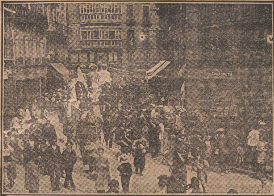
LAS FIESTAS DE PAMPLONA. —La clásica comparsa de gigantes y cabezudos, recorriendo la ciudad.

el Ayuntamiento de Castellón contra acuerdo de la Delegación de Hacienda de aquella provincia, por el que se concertó con la Empresa de la Plaza de Toros de dicha ciudad el pago del impuesto del Timbre del Estado y recargos.