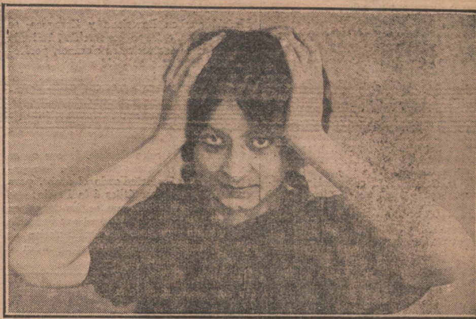
MASAJE de la cabeza.

No dejéis de lavaros los pies todas las noches.