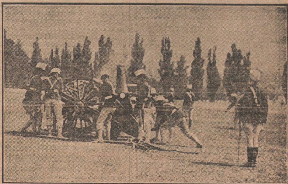
EL VERANEO DE LA CORTE.—Un regimiento de Artillería de Sitio, maniobrando ante S. M. el Rey, en La Granja.

Es una bendición mi barrio; así el Señor nos ayude á ti y á mí á gozar en él de días dichosos, si gustas; pero lo otro, lo que está después de mi barrio,