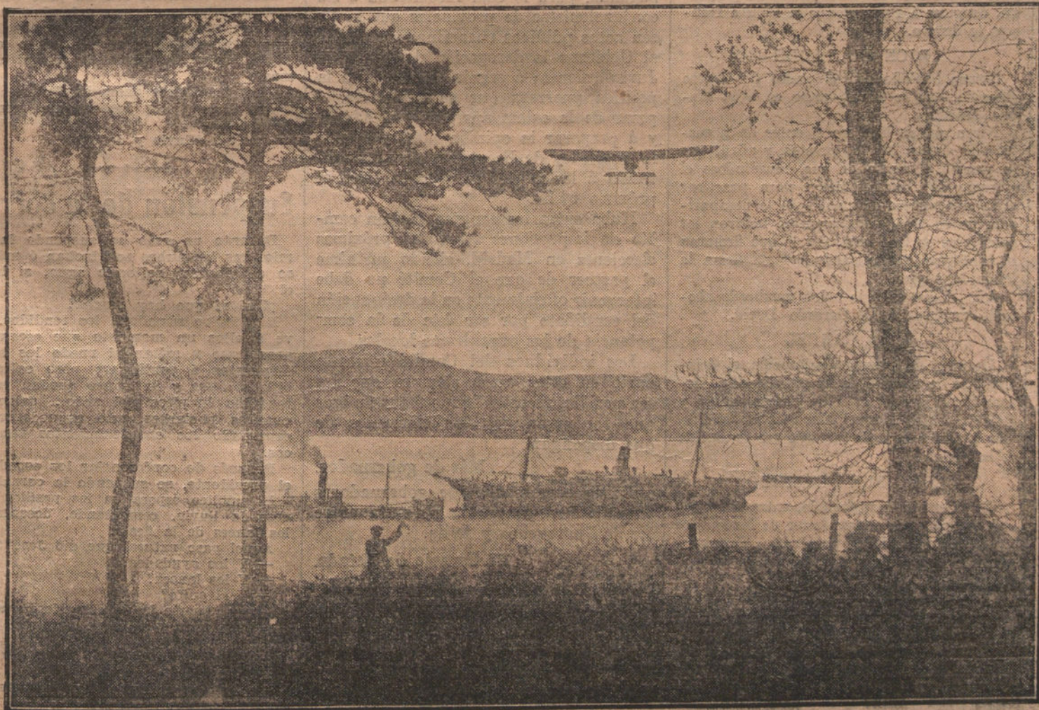
LAS FIESTAS DE SANTANDER.—El famoso aviador GARNIER en uno de sus magníficos vuelos, pasando sobre los transatlánticos anclados frente á San Martín.

Otro tercer lote de consolación, y dos billetes también á sortear entre todas