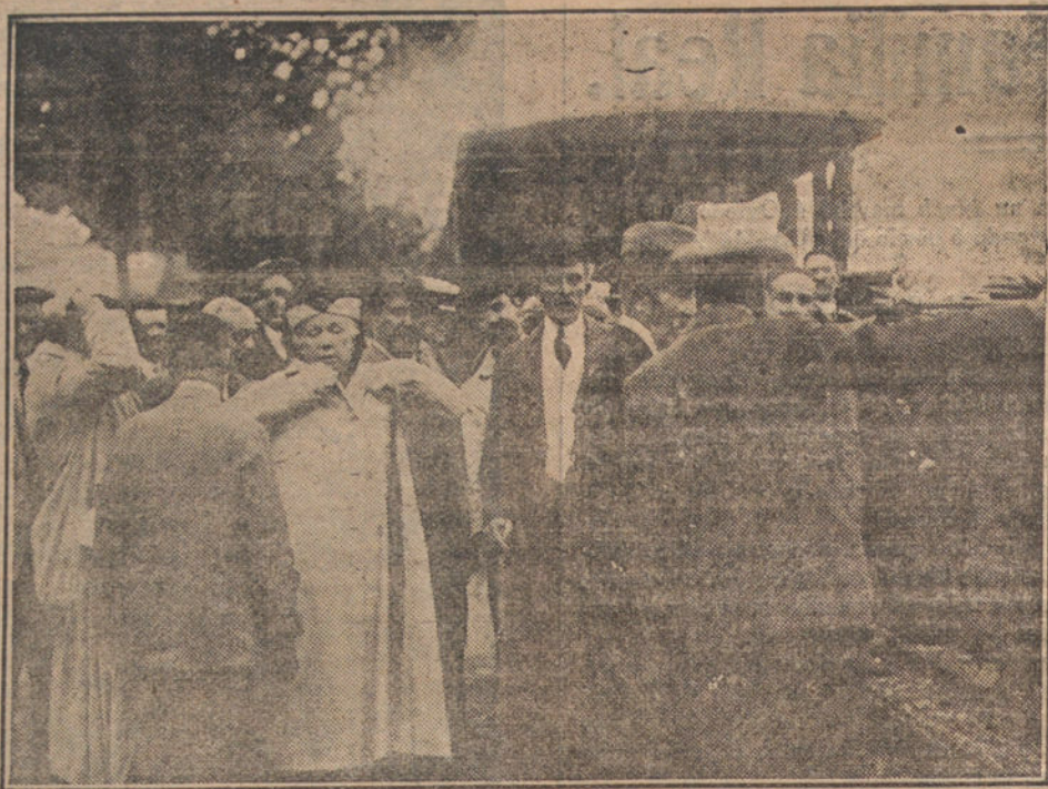
LA INFANTA ISABEL EN BARCELONA.—Su Alteza en Monistrol, montando en el automóvil que la condujo á Barcelona.