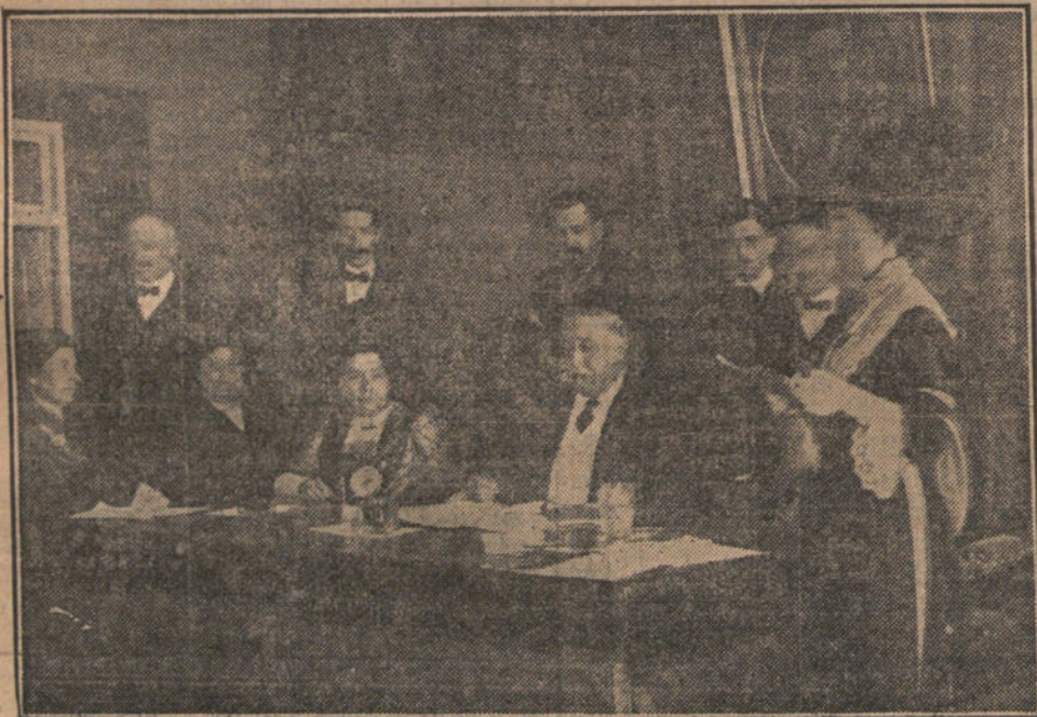
Presidencia de las conferencias pedagógicas que se están celebrando en la Escuela Normal.

tas de Reclutamiento para que puedan declarar inútiles totales á los reclutas de los reemplazos de 1911 y anteriores que fueron declarados inútiles temporales por reunir las condiciones que se indican.