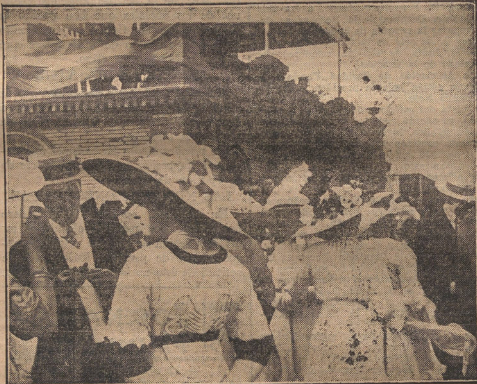
LAS FIESTAS DE PAMPLONA.—Grupo de elegants, que han asistido al concurso hípico.

Noches pasadas se hallaba Rosenthal en el Hotel Metropole, en Broadway Street, cuando fué llamado con un pretexto á la calle, en donde varios desconocidos hicieron fuego sobre él, dejándole muerto y huyendo después en un automóvil.