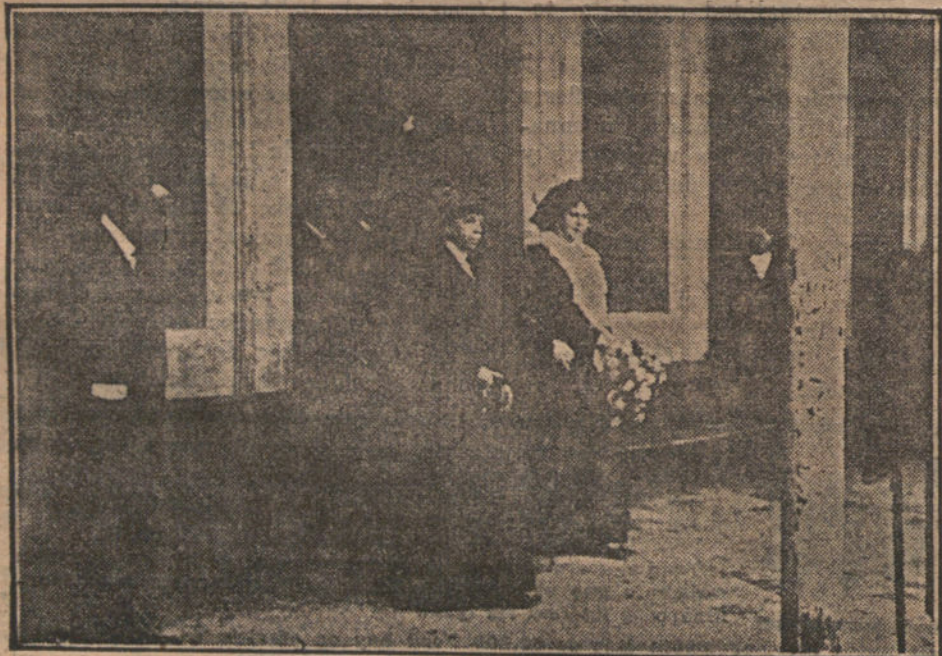
LOS VIAJES DE LA FAMILIA REAL.—Llegada á SAN SEBASTIAN de los infantes doña Beatriz y D. Alfonso.

PARA VENDER NO HAY MEJOR PROCEDIMIENTO QUE ANUNCIARSE EN "LA TRIBUNA".