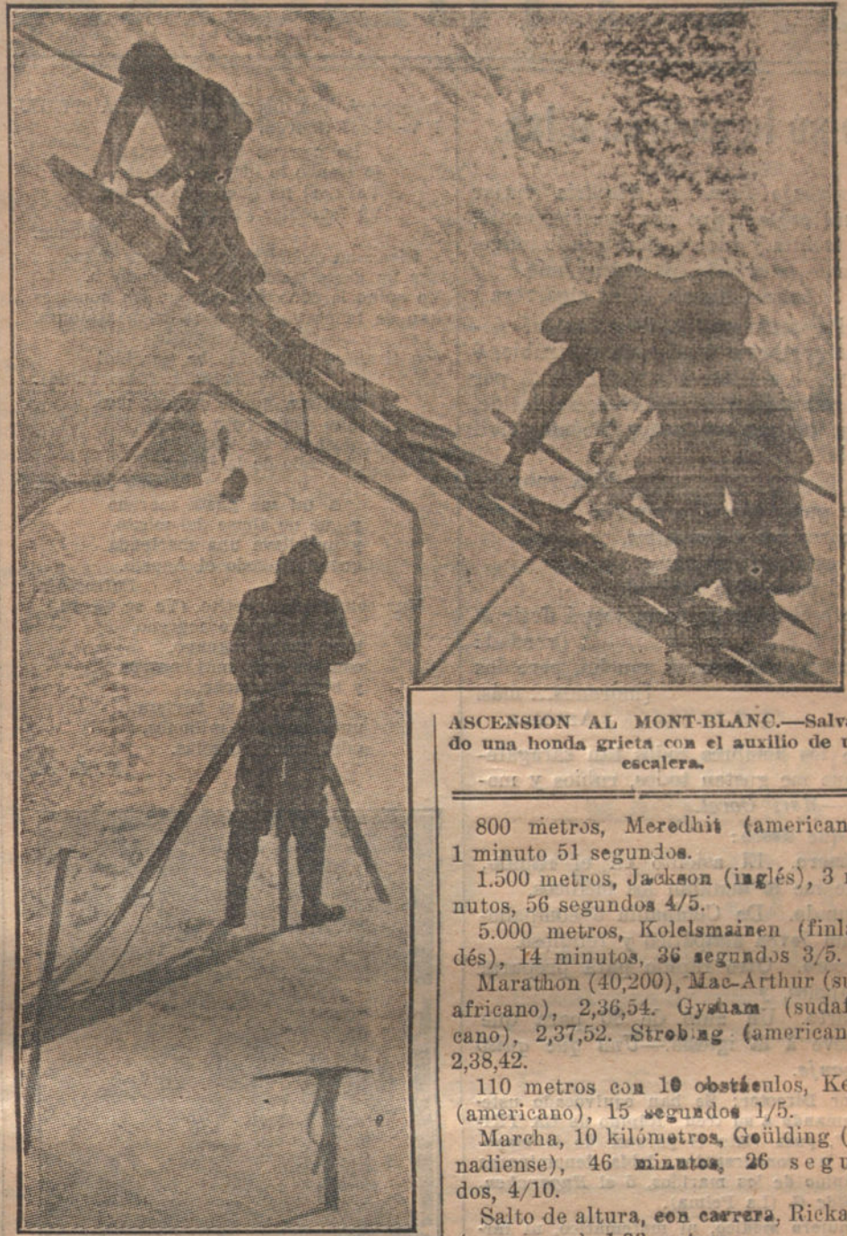
Un operador de una casa cinematográfica, impresionado en la película en el momento de llegar a la cumbre del Mont-Blanc.