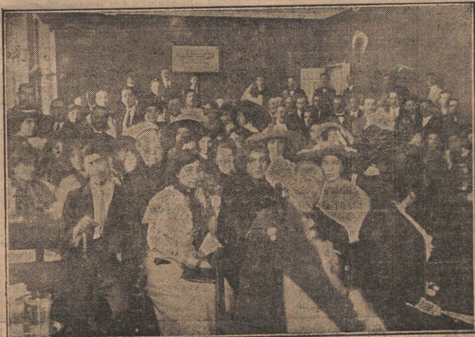
Aspecto del salón de actos de la Escuela Normal, durante una de las conferencias pedagógicas que se están celebrando en Normal Centro.

Está bien. Nosotros hacemos general ese cándido argumento, y decimos: los vecinos son los que sueltan el dinero, pues ellos son los que deben hacer y deshacer á su