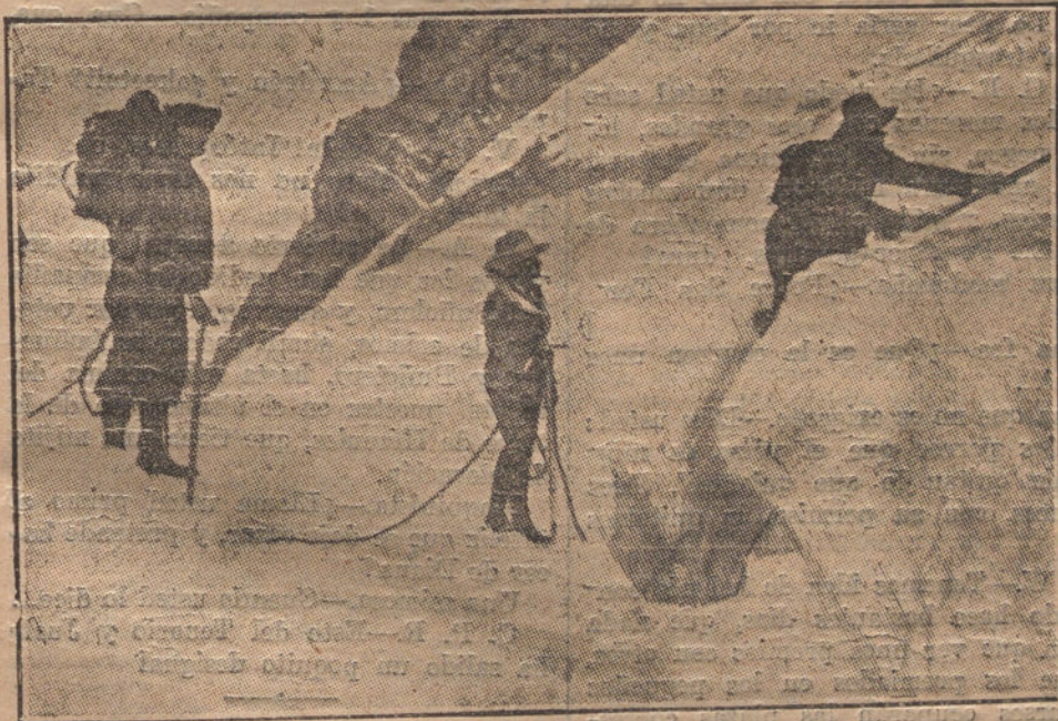
ASCENSION AL MONT-BLANC.—Una señorita alpinista caminando a la cuerda, entre dos guías.

En nuestra hoja de la semana próxima, continuaremos esta lista.