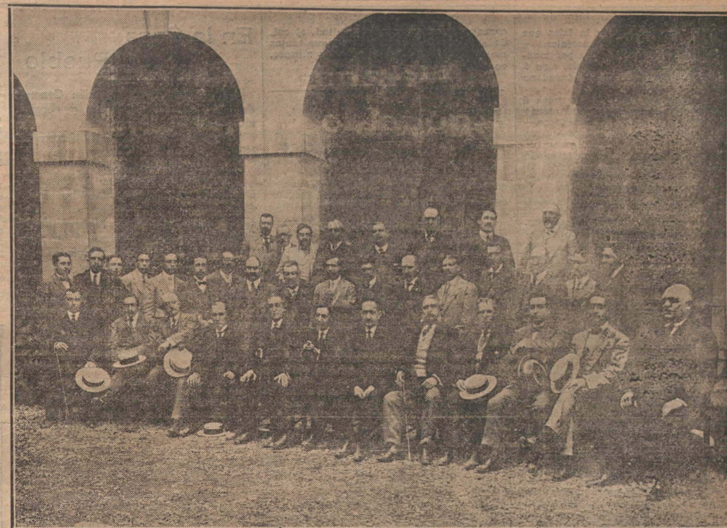
Las Comisiones regionales que asistieron al CONGRESO DE VITICULTURA celebrado en Pamplona.

El agresor, al darse cuenta de la importancia de lo ocurrido, trató de auxiliárla; pero suponiendo que la había matado, abandonó la casa y se entregó