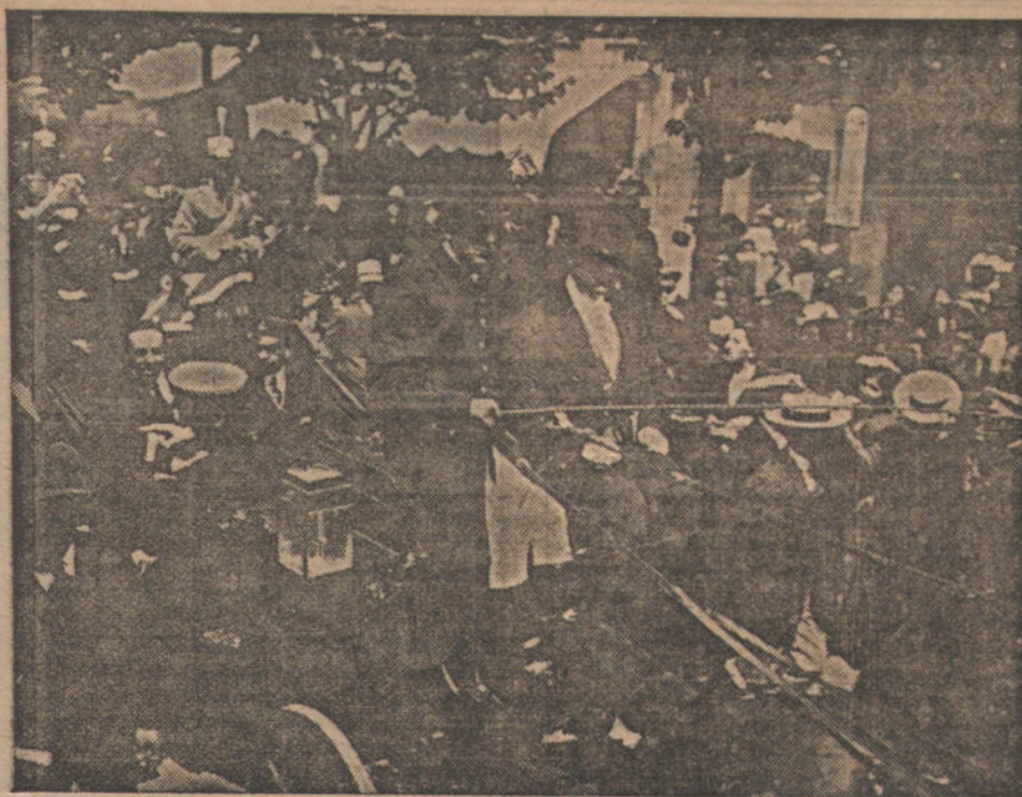
VIAJES DE LA FAMILIA REAL.—Momento de entrar S. M. el Rey en GIJÓN, donde se le tributó al Soberano una delirante ovación.

La infanta Isabel visitó el cañonero "Nueva España", y a las nueve y media de