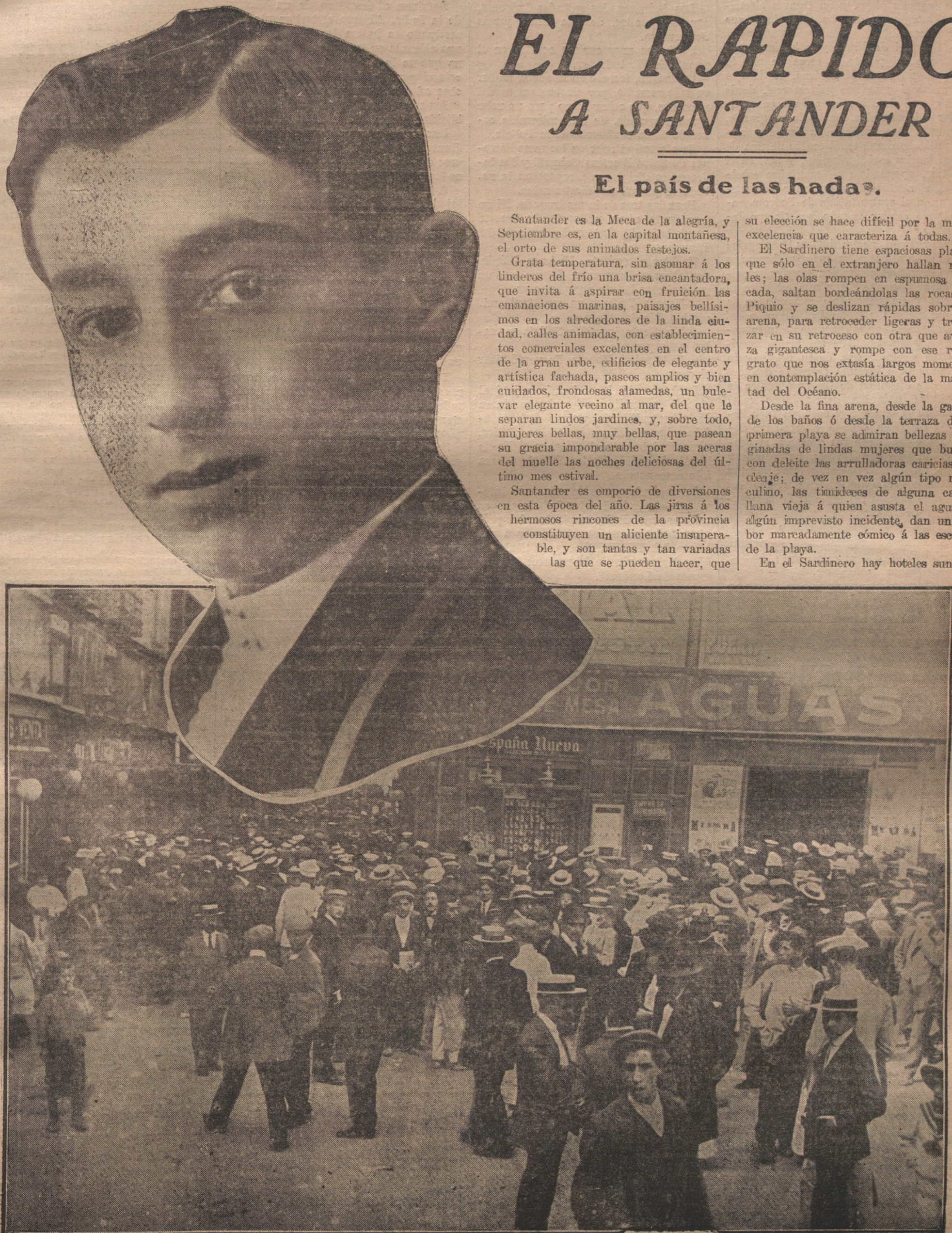
EL AMO DEL COTARRO.—Joselito el "Gallo", y aspecto de las Cuatro Calles durante la venta de billetes para la corrida de los Miuras.