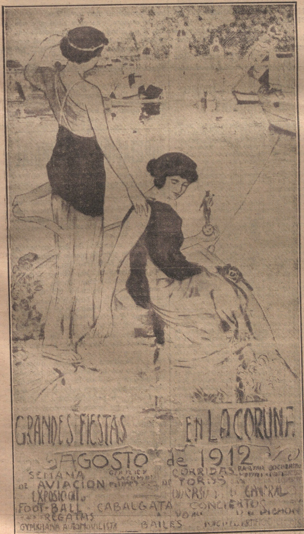
EL RAPIDO DE LA TRIBUNA.—Cartel anunciador de las fiestas que celebrarán en La Coruña este mes de Agosto durante la estancia de nuestros lectores