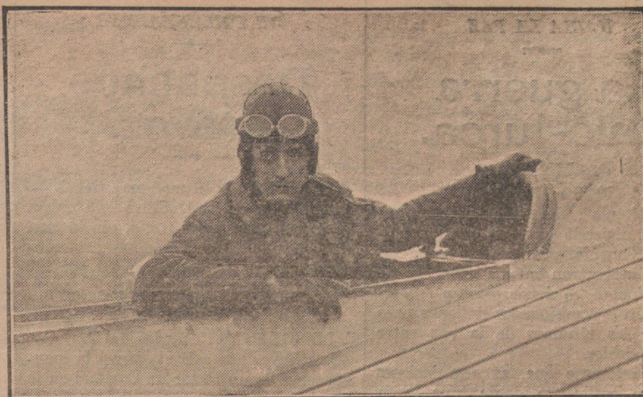
El famoso aviador Tixier, que desde La Coruña, saldrá en su monoplano al encuentro del RAPIDO DE LA TRIBUNA

Ahora sólo añadiremos, que la galantería del director de LA TRIBUNA agrega un premio de un bonito imperdible a la que mayor número de sufragios obtenga, bien del Jurado adjudicador ó del pueblo soberano, si