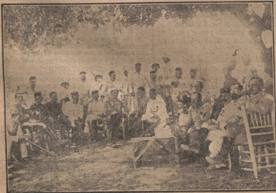
LA FRATERNIDAD HISPANO-FRANCESA.—Grupo de oficiales franceses que fueron al ZAIQ, para visitar nuestros campamentos.

Ambos orfeones, con las banderas y bandas de música, recorren la ciudad, y estando a las autoridades.