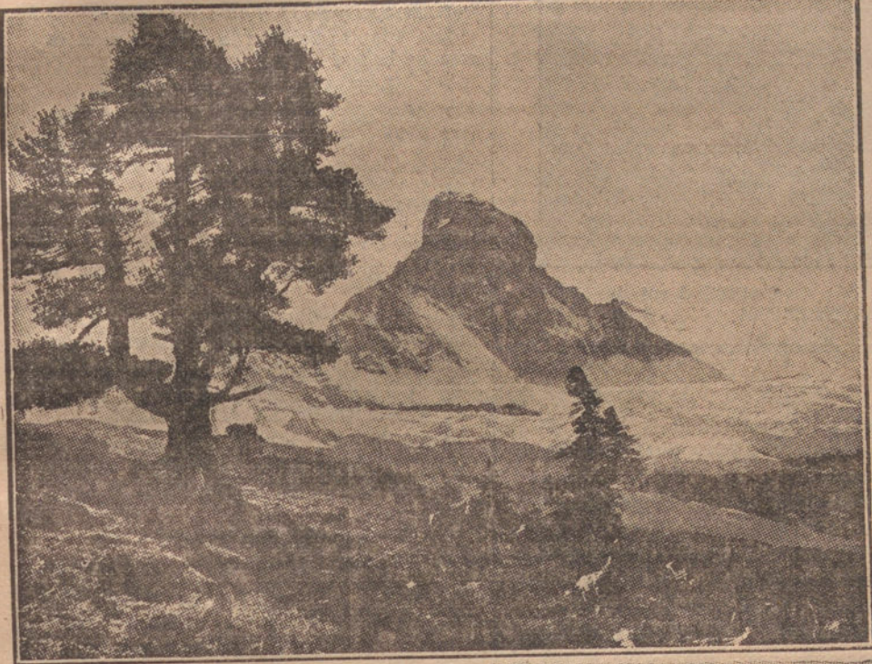
El Cervino, visto desde la estación de Gornergrat.