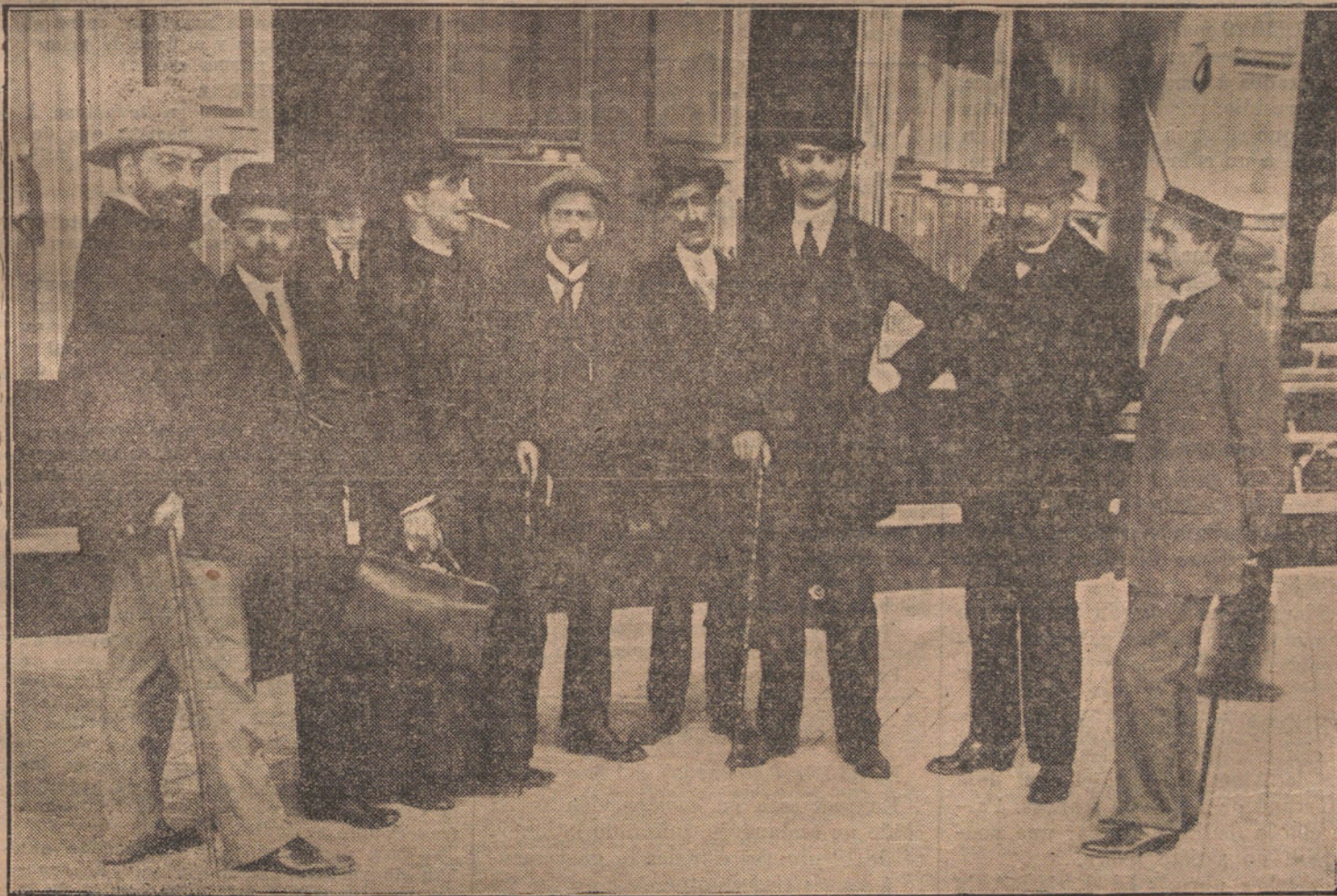
Los periodistas coruñeses que han llegado hoy a Madrid, invitados por LA TRIBUNA para hacer el viaje de regreso en el rápido a LA Coruña.