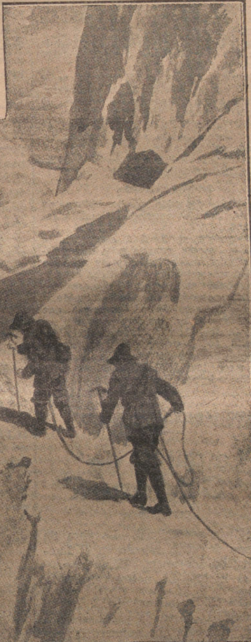
Un grupo de guías salió de Zermatt para recoger los cadáveres de los alpinistas.

Para, pues éstos le tenían contratado por un mes, y la temporada propia para subir al Cervino terminaba pronto.