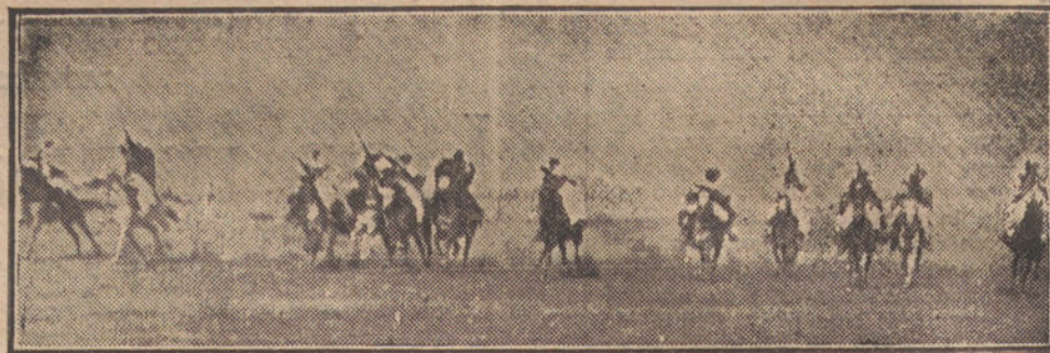
LA FRATERNIDAD HISPANO-FRANCESA.—Los moros de Quebdana que corrieron la pólvora, uno de los festejos organizados por nuestras tropas en honor de los oficiales franceses que atravesaron el Mluya.

"Aduanas.—La cuestión económica es una de las más importantes. España y