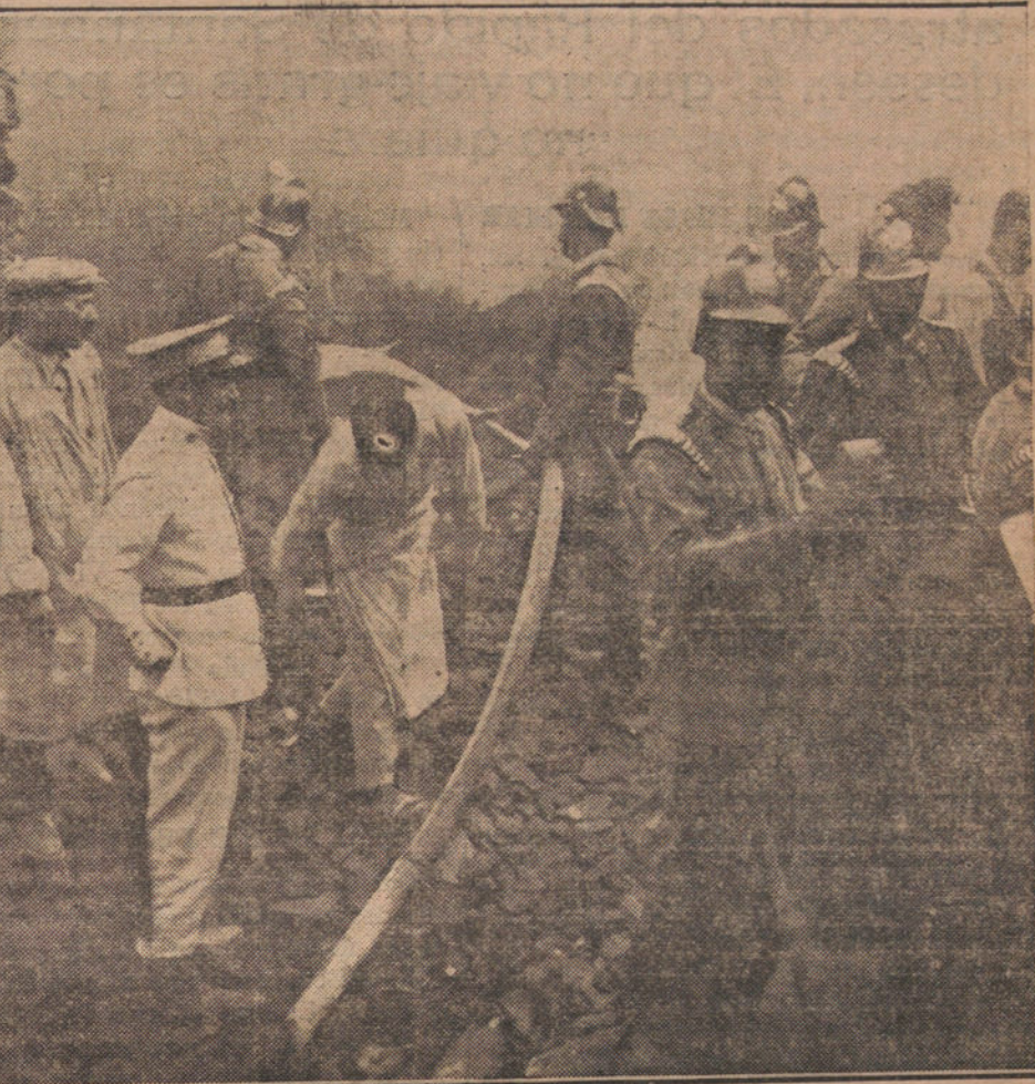
Los bomberos extinguiendo el fuego de la tahona de la calle de López de Hoyos.

necesitan es luz, mucha luz, y tener quinqué.