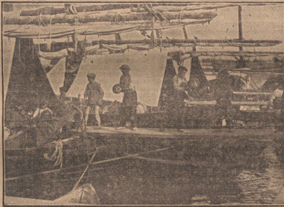
Descargando las sandías de la barca.

raneantes han tenido necesidad de recurrir a sus ropas de invierno y a sus gabanes, y en la mayoría de los hoteles se ha encendido la calefacción.