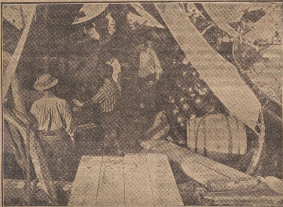
El famoso mercado de sandías de Barcelona, donde se contratan ventas enormes para el extranjero.

Este, acompañado del carretero, el dueño del carro, cuatro mujeres y dos niños, se trasladaban a Colmenar para