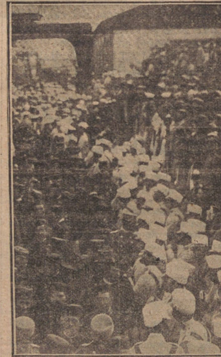
Los licenciados de Melilla desembarcando del "Barceló" en el puerto de Valencia.