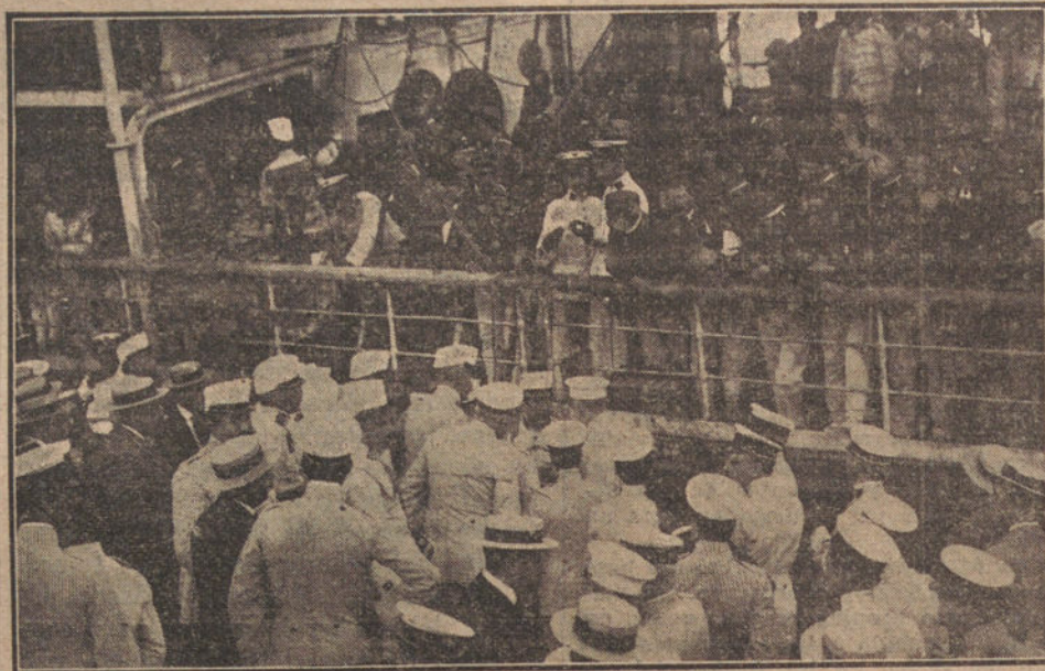
El capitán general de Valencia, dando órdenes para el desembarque.