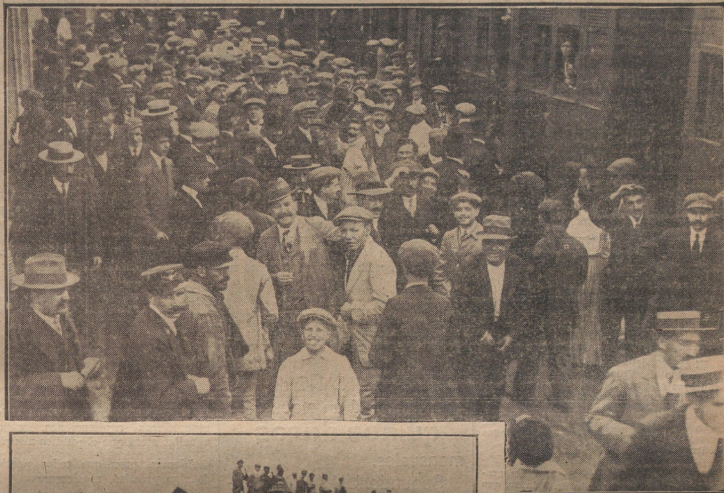
Momento de llegar a La Coruña nuestro rápido, al que se hizo un recibimiento entusiasta.

Unicamente tres líneas para contestar a los periódicos de la Editorial, que