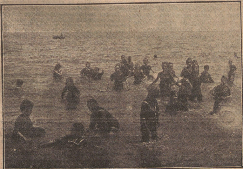
LAS COLONIAS ESCOLARES.—Grupo de niñas que componen la Colonia Escolar sevillana, tomando el baño.

Todo ello sale á subasta, tasado en francos 125.000, y es una verdadera vergüenza que los amantes de las glorias de Napoleón permitan puedan pasar tales recuerdos á manos extrañas.