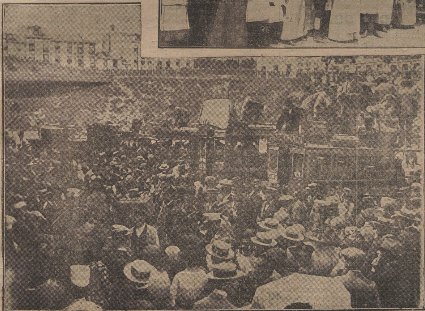
Un grupo de bellas coruñesas esperando la llegada del RAPIDO DE "LA TRIBUNA". — Los excursionistas de LA TRIBUNA saliendo de la estación de La Coruña a su llegada a la hermosa capital gallega.

al sentirse heridos por nuestro artículo del miércoles, titulado los "Cupones del Trust", que tan bien acogió la opinión, nos han dedicado sendos fondos en dos de sus periódicos.