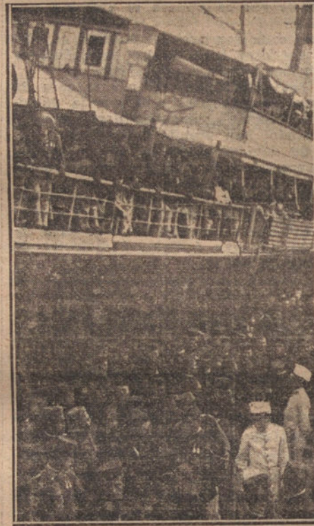
Las tropas, procedentes de Melilla, al descender del barco.