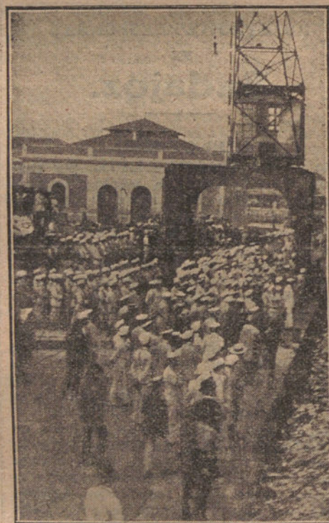
Las tropas de guarnición en Valencia, esperando la llegada del vapor "Barceló".