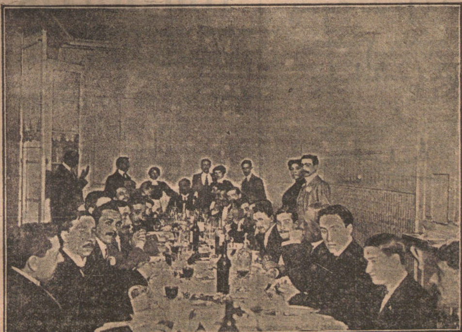
LA NUEVA ASOCIACION DE LA PRENSA DE BILBAO.—Banquete con que los periodistas solemnizaron la inauguración

Durante todos los días la brillante banda del regimiento de León ejecutará las más escogidas piezas de su vasto repertorio.