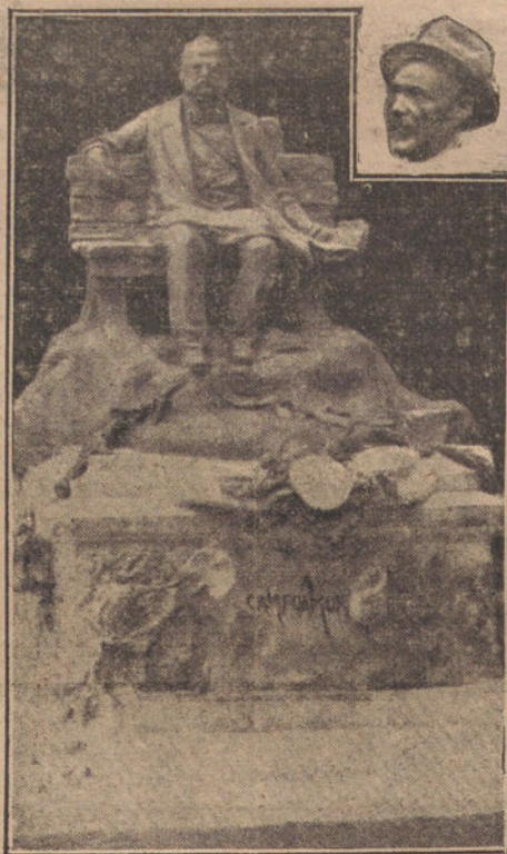
Proyecto de monumento a Campoamor que los asturianos le dedican en Navia, Pueblo natal del llorado poeta. El escultor D. Aurelio Carretero, autor del proyecto.

unos lanceos de frente por detrás (todo bueno, aunque no tan limpio como otras veces), tampoco ha estado como banderillero a su altura, pues un par desigual, uno bueno y medio tirado, cuarteando, no son para dar fama a nadie.