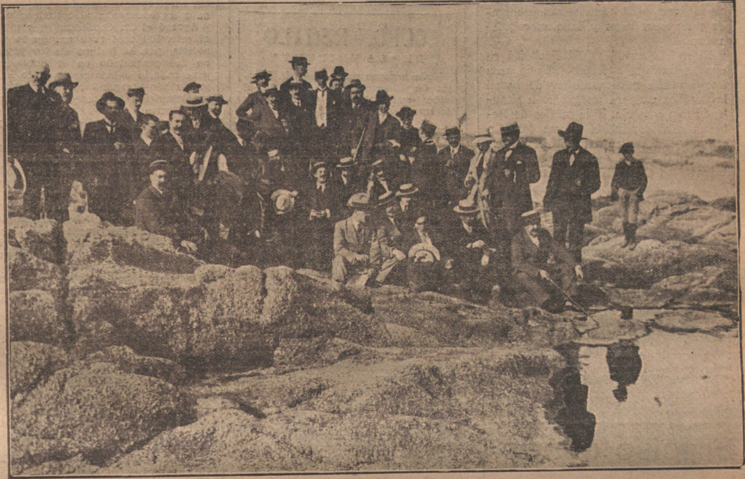
EL RAPIDO DE "LA TRIBUNA".—Grupo de periodistas y excursionistas que, acompañados del gobernador de La Coruña, visitaron la playa del Orzan.

Escribo entre el continuo bullicio, entre el sonoro clamoreo que producen forasteros y gentes del país, vagando en animados grupos por las calles de la ciudad, acudiendo en torbellino a presenciar los brillantes festejos que esta hermosa tierra celebra en obsequio de sus hijos y de sus visitantes, con un programa escogido y atrayente: Dianas y alboradas; cabalgata alegórica; Exposición de Arte; concursos de Aviación; conciertos musicales en el Relleno, en la calle Real y en el Parque de Méndez Núñez; concurso típico; cinematógrafo público; corridas de toros y de novillos; fuegos artificiales; excursiones a El Ferrol, a Betanzos y a Caneiros; gymkhana automovilista; veladas; fiestas de foot-ball, ciclismo y otros deportes; bailes de sociedad... un sin fin de festejos y de agasajos, que nos están haciendo pasar unas horas dulces y encantadoras a cuantos tuvimos la dicha de formar en la expedición organizada por LA TRIBUNA, cada vez más elogiada de los via-