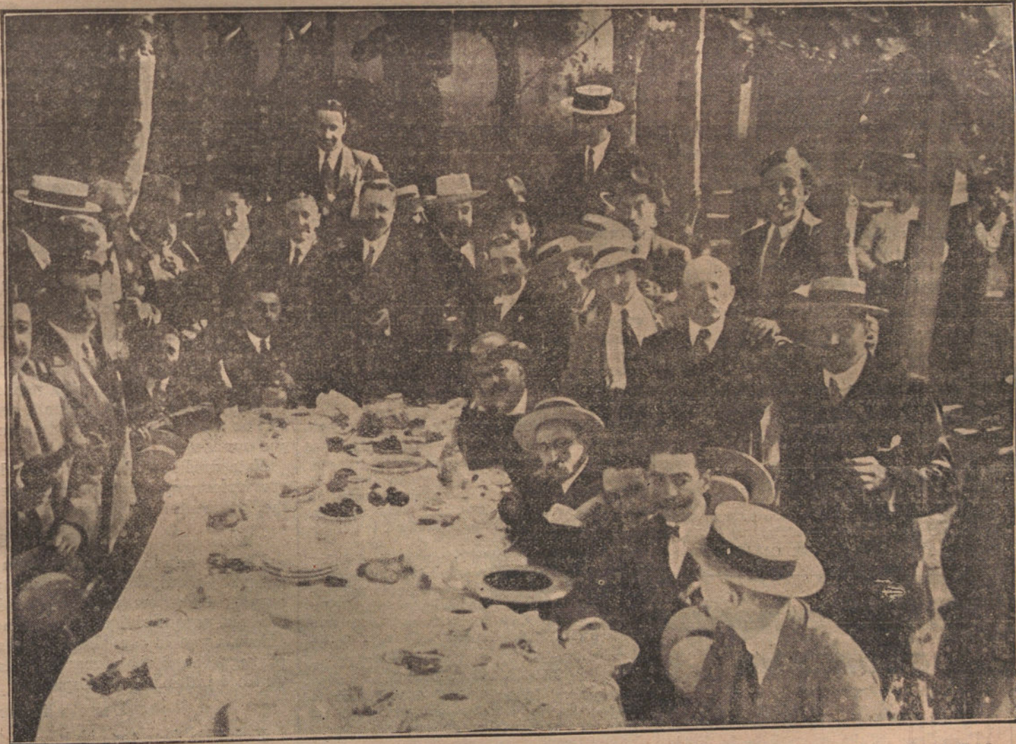
EL RAPIDO DE "LA TRIBUNA".—Banquete con que los periodistas coruñeses obsequiaron a los de Madrid..

jeros que trajo nuestro RAPIDO, y del pueblo coruñés, verdadero modelo de hospitalidad.