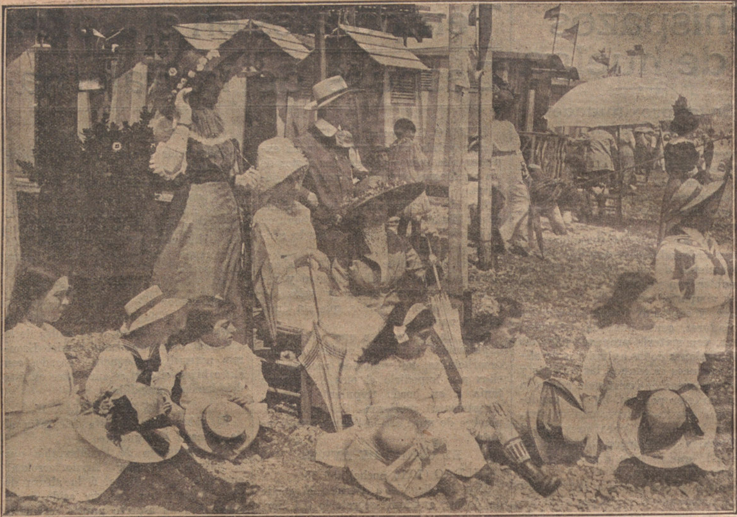
NI FRIO NI CALOR.—Vista general de una de las playas de Barcelona, donde este año se han congregado muchas familias extranjeras.