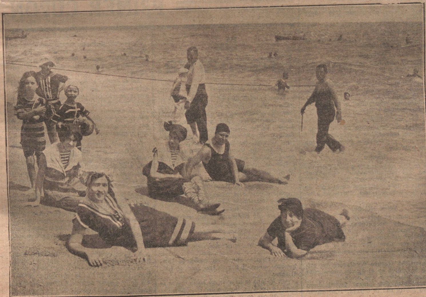
La playa de SANTANDER, en uno de sus momentos más animados y pintorescos. Esta es una de las playas de moda, no sólo en España sino en el extranjero, de donde acuden muchos turistas. Nuestros lectores visitarán próximamente esta maravillosa población.

Para la corrida del domingo reina mucho entusiasmo.—Ramírez.