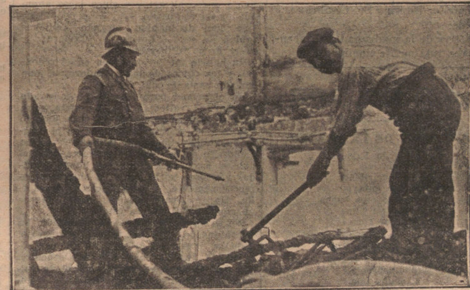
EL INCENDIO DE LA FABRICA GIROD.—Otro detalle de la extinción del fuego.

a un hombre inculto, lo primero que hace es llevarse a la boca, para mojar la punta?