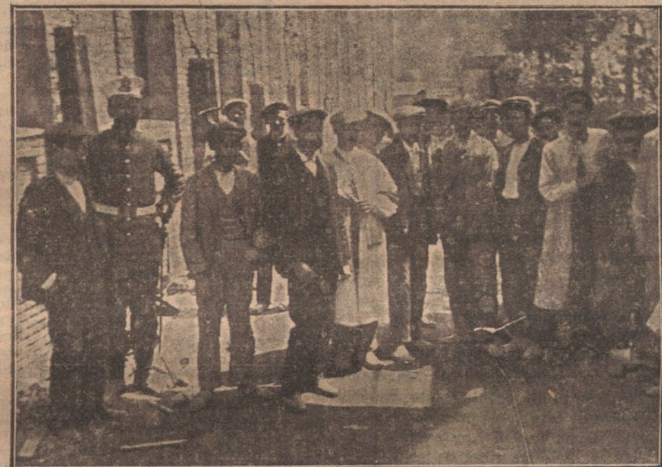
EL INCENDIO DE LA FABRICA GIROD. — Operarios de la fábrica que cuando han acudido al trabajo se han encontrado con el edificio destruido.