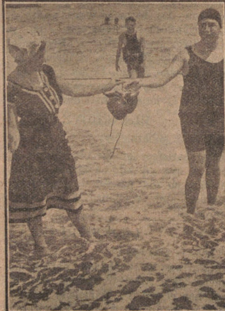
Una bañista "fotógena".