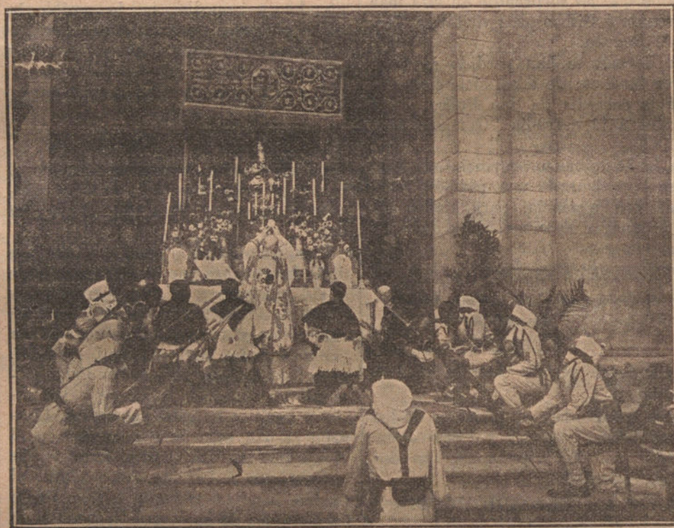
El altar, de la misa de campaña celebrada en las escalinatas de San Francisco el Grande.

han renovado, "La Epoca", "Gaceta de Obras públicas", "La Ilustración Española y Americana", "La Moda Elegante Ilustrada", "Boletín Eucarístico", "La Semana Católica", "El Pan del Pobre" (de Madrid); "El Carbayón" (de Oviedo); "El Noticiero", "El Guadalupe", "El Diario de Cáceres" (de Cáceres los tres).