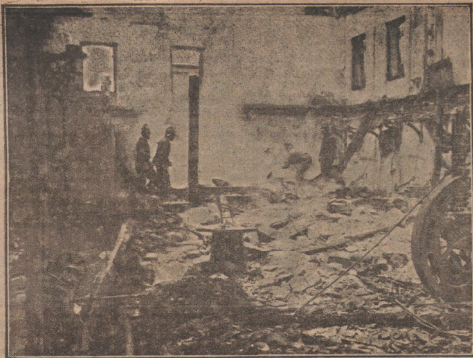
EL INCENDIO DE LA FABRICA GIROD.—Los bomberos extinguiendo el fuego en una de las naves principales de la fábrica.