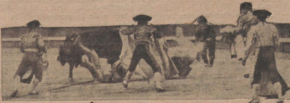
EN LA PLAZA DE MADRID

—Habla el francés tan bien como un ruso. Este viaje de mil doscientos france-