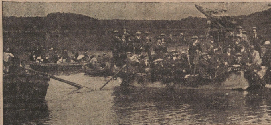
Barcas engalanadas y grupo de lectores de LA TRIBUNA que tomaron parte en la excursión a los Caneiros.—Autoridades de Betanzos esperando a los excursionistas.—El balcón de la Casa-Ayuntamiento y arco levantado en honor de nuestros lectores.

aquella boca que, al mediar el día, besara los labios bermejos de una serrana, de carne morena y fresca, como aquellas recias vaqueras que fueron el deleite del jocondo Arcepresta.