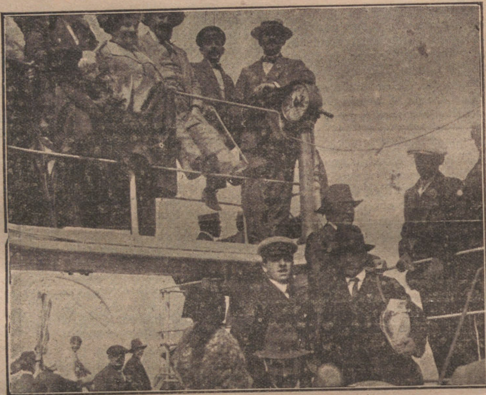
LOS EXCURSIONISTAS DE LA TRIBUNA.—Jira marítima al Ferrol, á bordo del vapor "Comercio". El puente del barco, donde se ve á nuestro director que tantas nuestras de afecto ha recibido de los coruñeses.

Y luego dicen que ganan mucho los teatros.