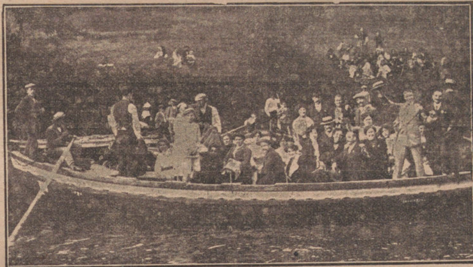
LOS EXCURSIONISTAS DE LA TRIBUNA, durante la pintoresca jira á Cauciros, viaje organizado en honor de nuestros lectores, y que ha sido un gran éxito.