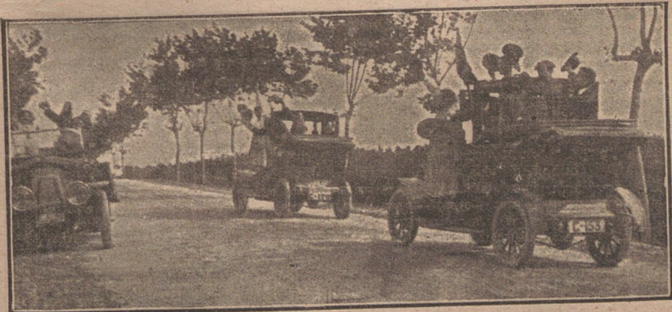
EL RECORD MADRID-CORUÑA.—Los automóviles que salieron á la carretera de Betanzos á esperar al de nuestro director.

ro, ¿acaso la pintura no es, antes que nada, la expresión del temperamento?