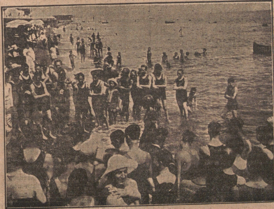
LOS CONCURSOS DE NATACION DE BARCELONA.—Aspecto que ofrecía la plaza en el momento de comenzar la fiesta.