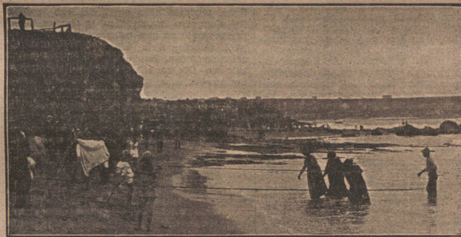
NUESTRO RAPIDO A SANTANDER.—La playa denominada "La Concha", que en breve visitarán nuestros lectores.