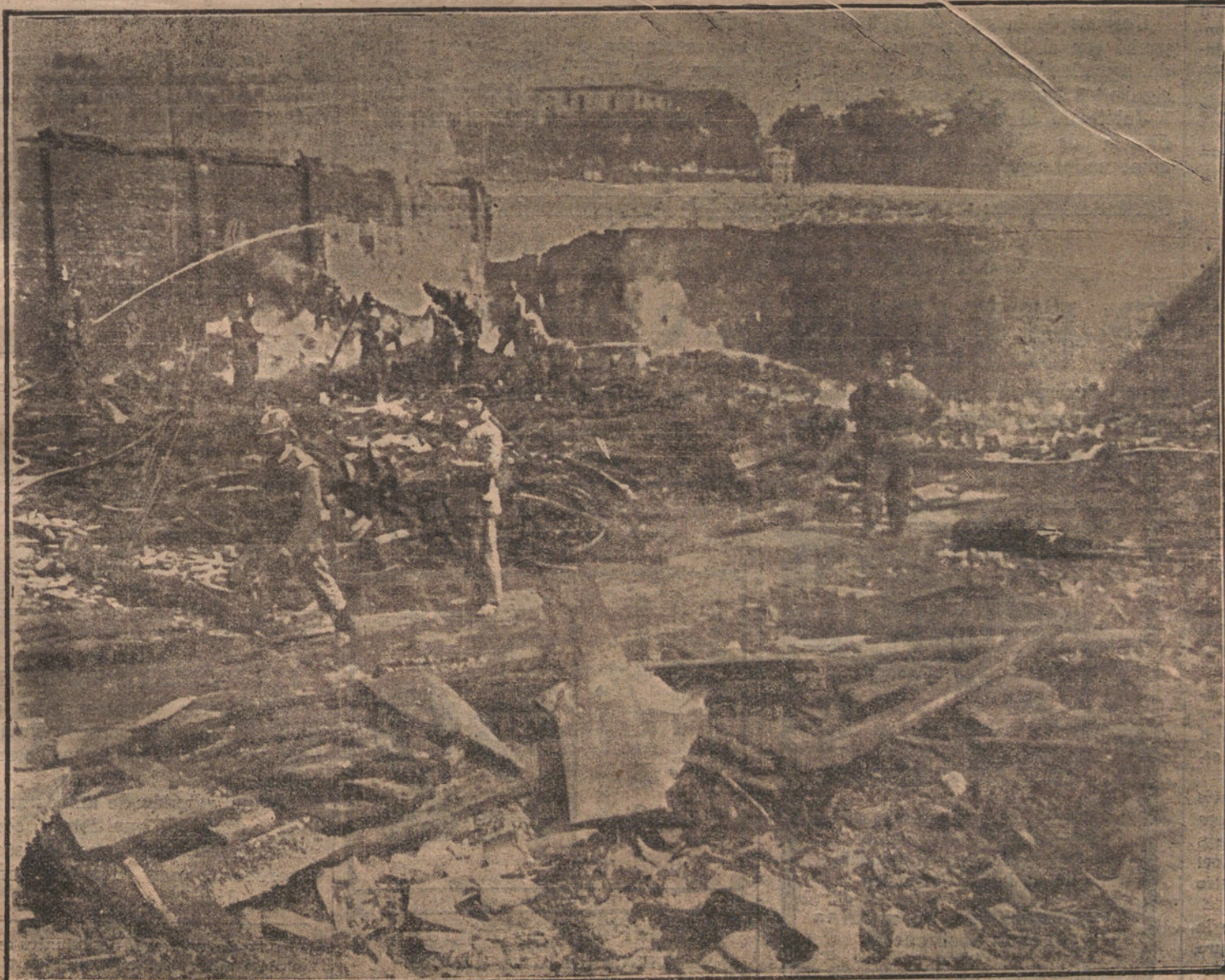
Lo que ha quedado el almacén de maderas de la calle de Peñuelas, después del formidable incendio.

Habrà patatas fritas que un industrial regala a los expedicionarios, quiz haya cerveza, tal vez anís, tal vez... pero en fin, poco a poco iremos descubriendo el secreto de nuestros múltiples obsequios y la nube de las ventajas con que pretendemos corresponder a