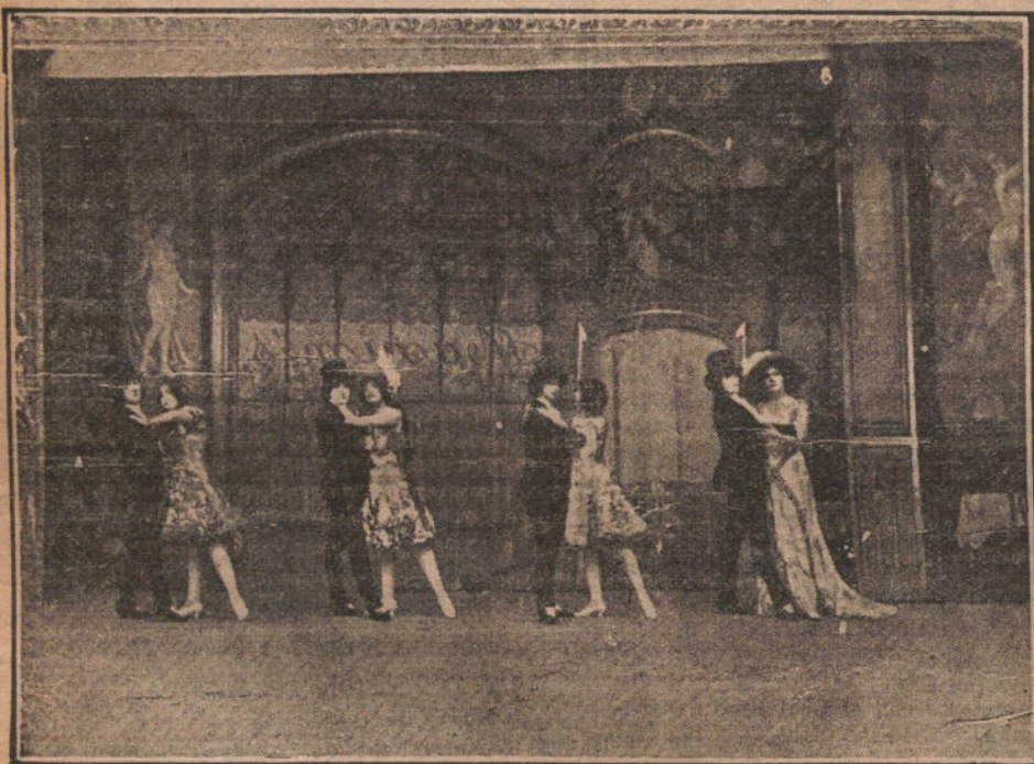
La troupe "Liviana", que está actuando con gran éxito en el Kursaal de la Ciudad Linares, en uno de sus famosos bailes titulado en "Casa de Maxim".

Real orden resolviendo el expediente incoado en virtud de la visita de inspección decretada por el comisario general de Seguros para comprobar los extremos de la denuncia presentada en 15 de Abril contra la Asociación L'Amich del Poble Catalá.