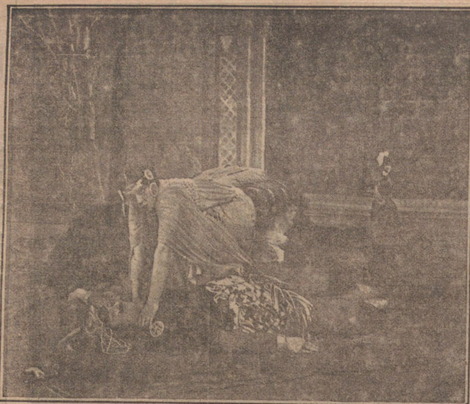
La tropa linense que actúa con éxito en la Ciudad Lineal, en uno de sus bailes titulados "Danza de la muerte".