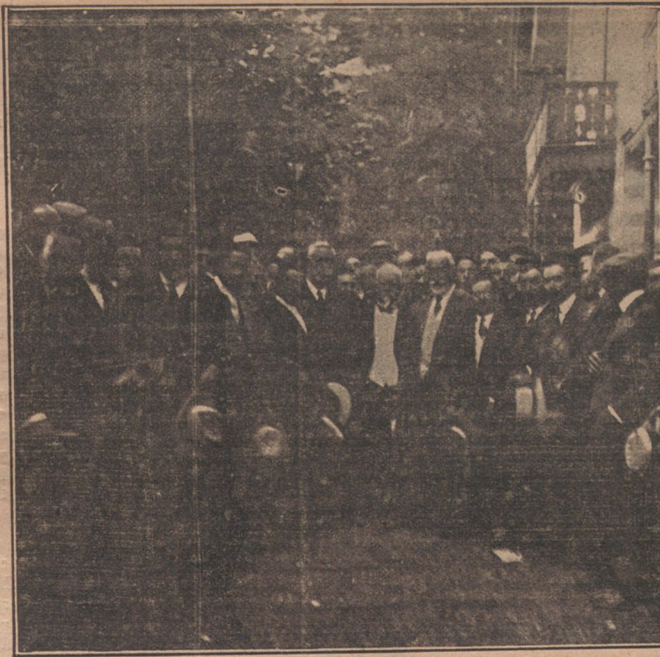
DON ANTONIO MAURA EN SANTANDER.—Grupo de invitados, entre los que hay Comisiones de todos los pueblos, que asistieron al festival celebrado en honor del Sr. Maura en la popular Fuente del Francés, en Santander.

de refilón y treinta y siete en suerte. Como á pesar de su poder no empujaban mucho, las caídas han sido nada más que quince, y los caballos apuntillados en la arena siete.