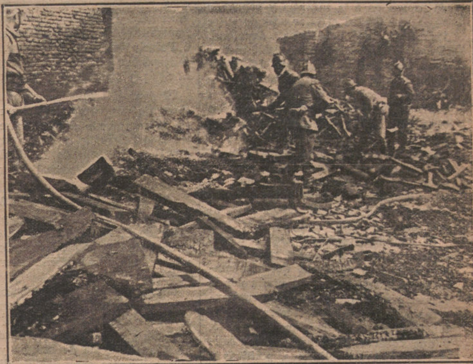
Los bomberos extinguiendo el fuego en el almacén de maderas de la calle de las Peñuelas.

Nuestros excursionistas, en virtud de las ventajas obtenidas, ventajas que lo son también, y muy grandes, para la ciudad santanderina, podrán regresar en cualquier tren, rápido, correo ó mix