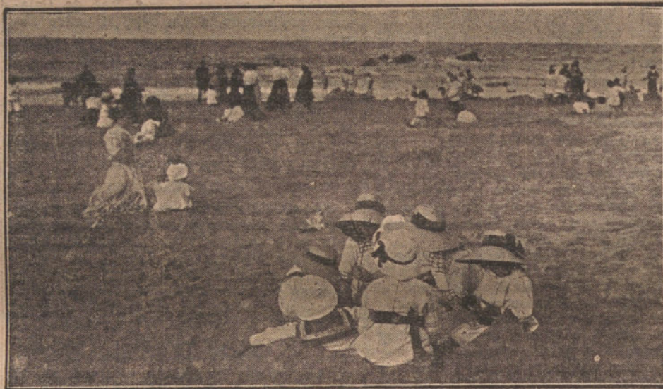
NUESTRO RAPIDO A SANTANDER.—Un aspecto de la pintoresca playa del Sardinero, que en breve visitarán nuestros lectores. Grupó de niños en un banco de arena esperando la subida de la marea.