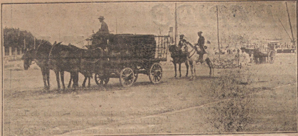
LA HUELGA DE MÁLAGA.—La Guardia civil escoltando un carro de transportes conducido por el propietario de la mercancía.

—Pues con estas tiples bellísimas con estos tenores estupendos, con el resto de la Compañía, que es muy apreciable, con ese cuerno de bailarinas