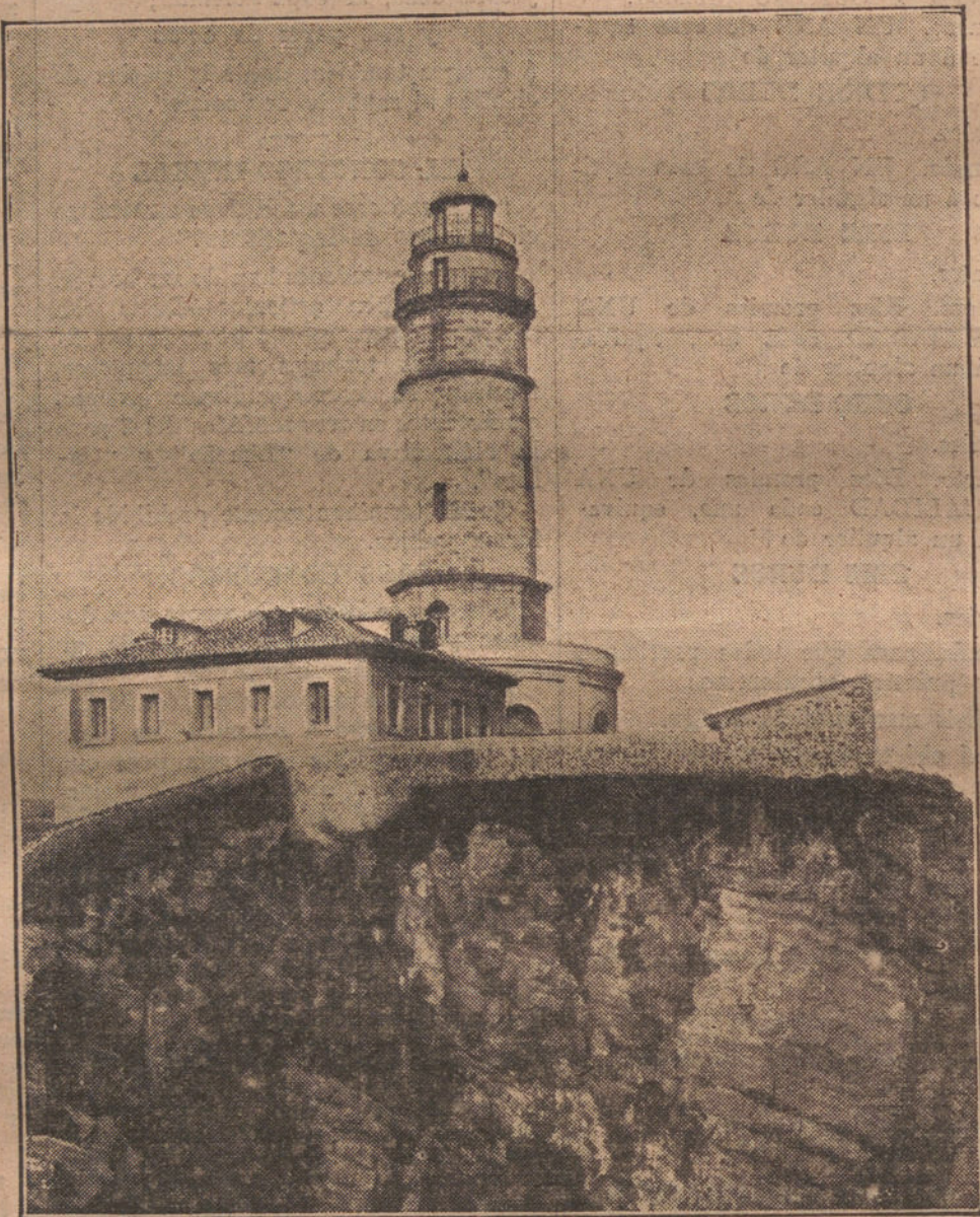
NUESTRO RAPIDO A SANTANDER.—El faro de Cabo Mayor, desde cuya torre se domina una gran extensión del Cantábrico y que nuestros lectores visitarán en breve durante su excursión á Santander.

setas que cuesta el local no tienen otro fin que el servir de albergue al polvo y á las tearañas?