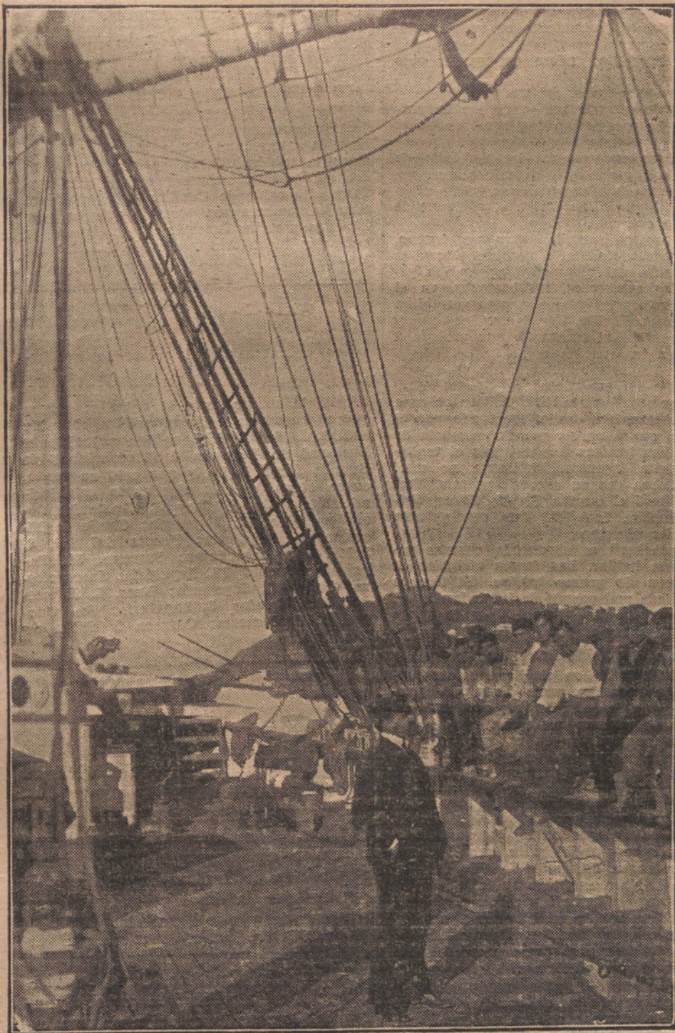
EL MARINO, en su barco.

PARA VENDER NO HAY MEJOR PROCEDIMIENTO QUE ANUNCIAR EN “LA TRIBUNA”