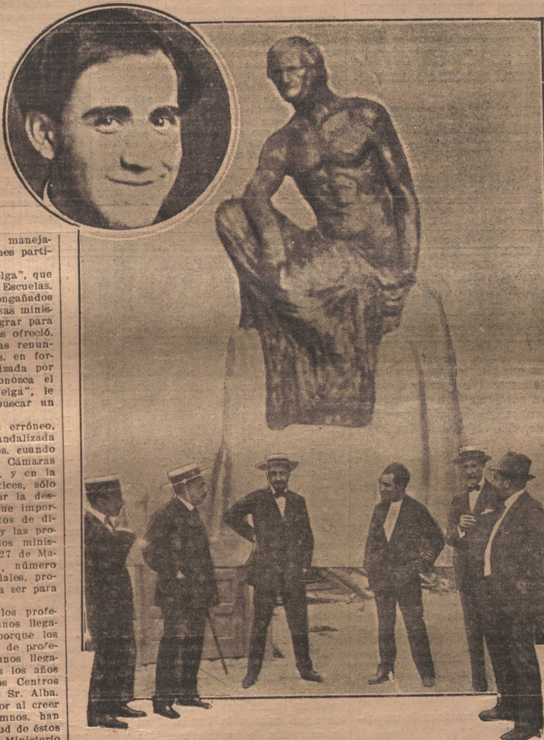
MONUMENTO QUE SE VA A ERIGIR EN MADRID A RICARDO WAGNER.—Julio Antonio, autor del boceto.—La Junta directiva de la Asociación Wagneriana madrileña, que costea el monumento.

"El Journal" publica un telegrama en el cual afirma que han sido quemados por los insurrectos de Nicaragua un destacamento de veinte soldados norteamericanos.