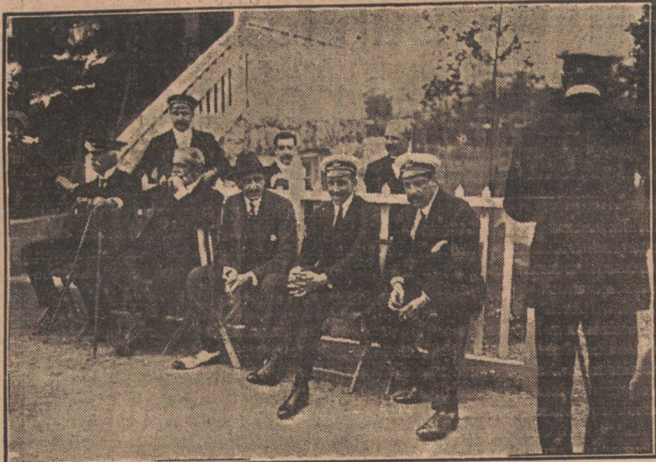
EL REY EN BILBAO.—S. M. en el Tiro de Pichón conversando con varios socios.