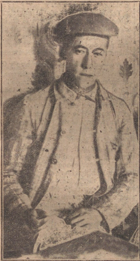
LA TRIBUNA EN LA CORTA DE TABLADA.

madriño. Para infiltrar en el alma de los berlineses el amor al agua, las autoridades prusianas han tenido que trabajar muchísimo.