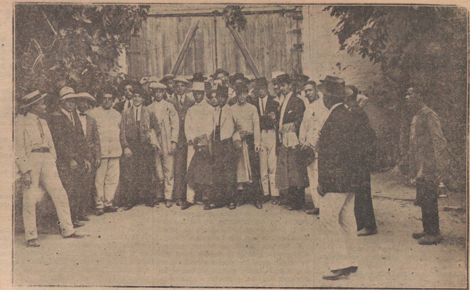
Grupo de jóvenes de la aristocracia malagueña que picaron, banderillaron y mataron cuatro toros novillos en la corrida benéfica celebrada en Málaga

Han sido autorizadas para el cambio de correspondencia asegurada con la Administración del Correo central, las oficinas de Linares y San Fernando, y la de Barcelona, con la oficina ambulante del Meditarráneo—correo ascendente—utilizando la