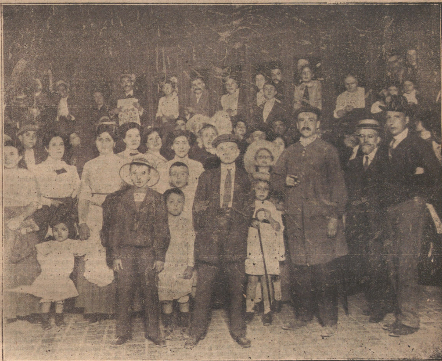
NUESTRO RAPIDO A SANTANDER.—Momento de la salida del tren de «LA Tribuna».

Los berlineses no son de otra pasta que nosotros. En realidad, el berlinés nace con tanto horror al agua como el