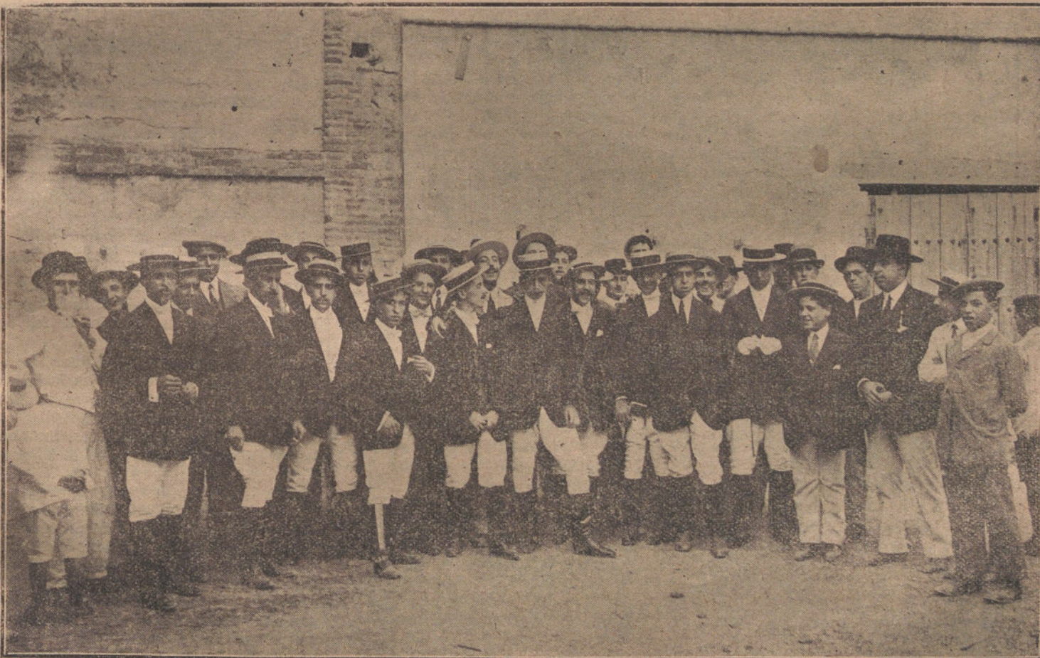
Con motivo de las renombradas ferias de Málaga, se han celebrado en la Plaza de Toros de dicha capital unas carreras de cintas, en las que tomaron parte los más distinguidos caballistas de la ciudad andaluza.—El grabado representa á los finetes momentos antes de comenzar la fiesta