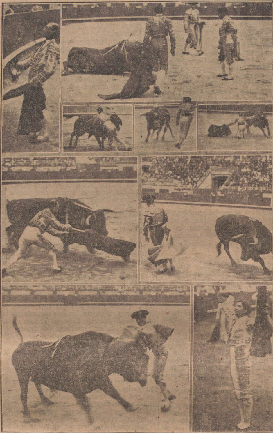
Gallito brindando la muerte de su primer toro.—Bienvenida viendo morir a su segundo.—Una buena estocada de Gaona.—Gallito banderilleando.—El mismo en dos pases de maestro.—Bienvenida, rematando un quite.—Gallo, toreando de capa y Gaona escuchando una ovación.

bro de fechas de historia, sobre fórmulas de matemáticas, repasando todo lo que han aprendido en los nueve años de escuela. Día y noche se trabaja antes de aparecer en los exámenes; los escritos duran una semana entera, algunos de ellos, desde la mañana, a las ocho, a las cuatro y media de la tarde, sin interrupción ninguna.