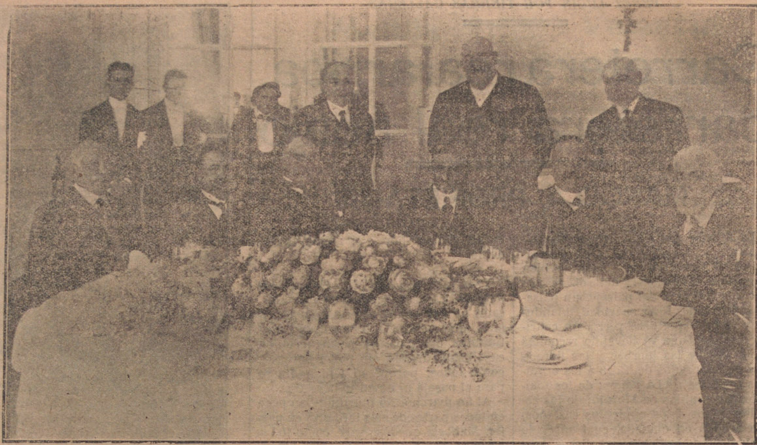
BANQUETE CELEBRADO AYER POR LOS MINISTROS, EN EL «HOTEL RITZ», ANTES DEL CONSEJO

En el último toro Gallito torea de capa tropelladamente. El bicho es manso. Ra-