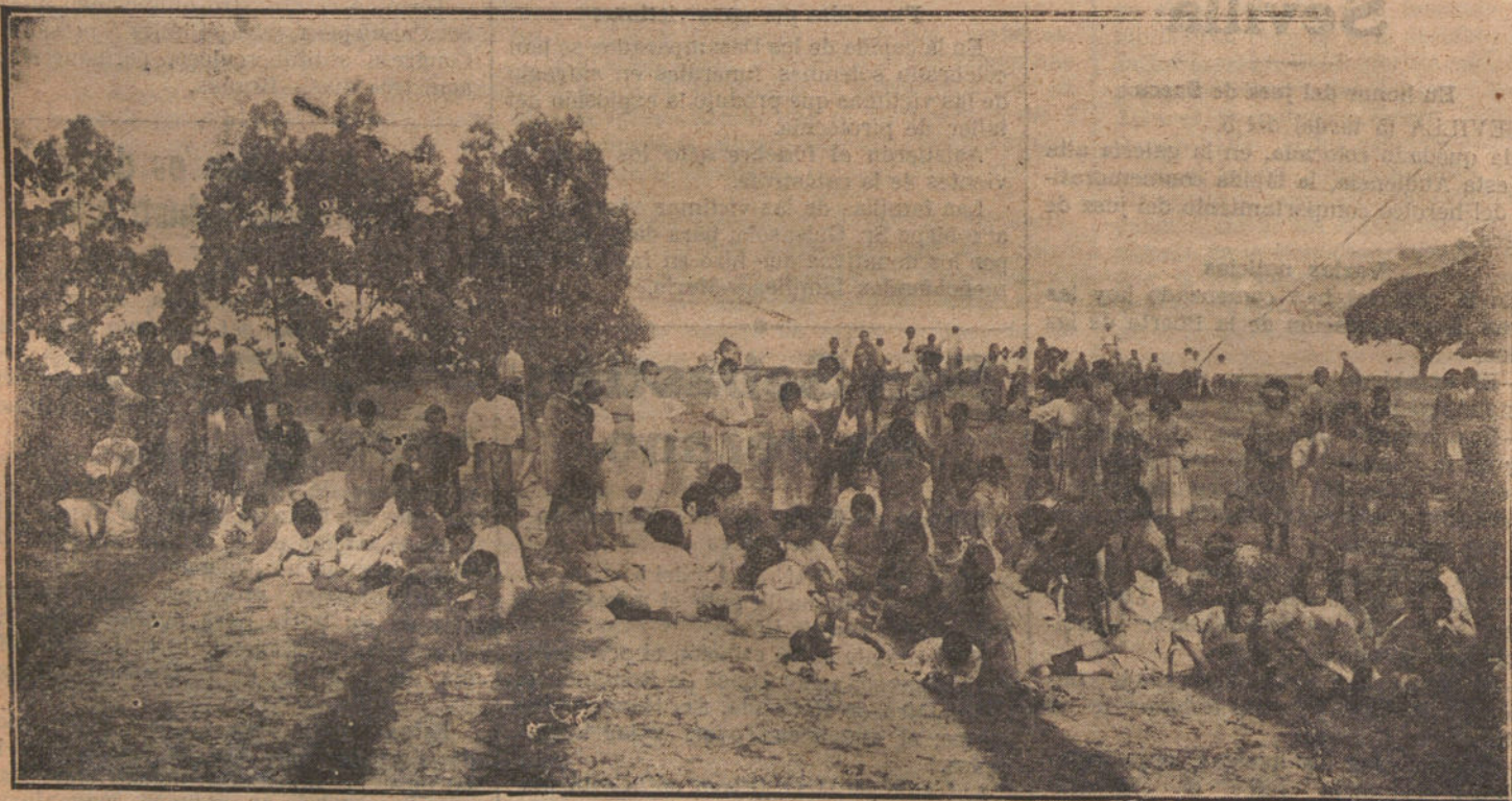
NUESTRO RAPIDO A SANTANDER.—La hora de juego en el Sanatorio de la Pedrosa, que nuestros lectores visitarán durante su estancia en Santander.