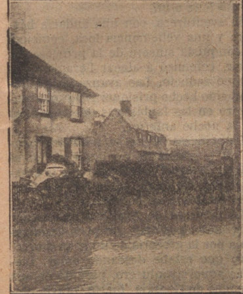
Aspecto de los paseos y calles de Londres después de los últimos temporales, durante los cuales se han sucedido sin interrupción las inundaciones en toda Inglaterra.

saludan entre ellos con saludos automáticos, mucho más complicados, pero mucho menos cordiales que los nuestros.