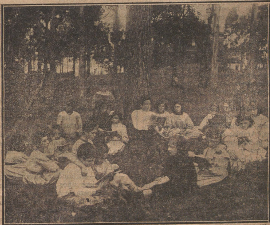
NUESTRO RAPIDO A SANTANDER.— Un aspecto del Sanatorio de la Pedrosa, durante las lecciones al aire libre de la Institución Reina Victoria, de Madrid. Nuestros lectores, que veranean en la hermosa capital montañesa, visitarán estos días ese famoso Sanatorio.

Otra disponiendo que el director general de Primera enseñanza, D. Rafael Altamira y Crevea, se encargue nuevamente de la referida Dirección general y además desempeñe interinamente las funciones anexas a la Subsecretaría de este ministerio.