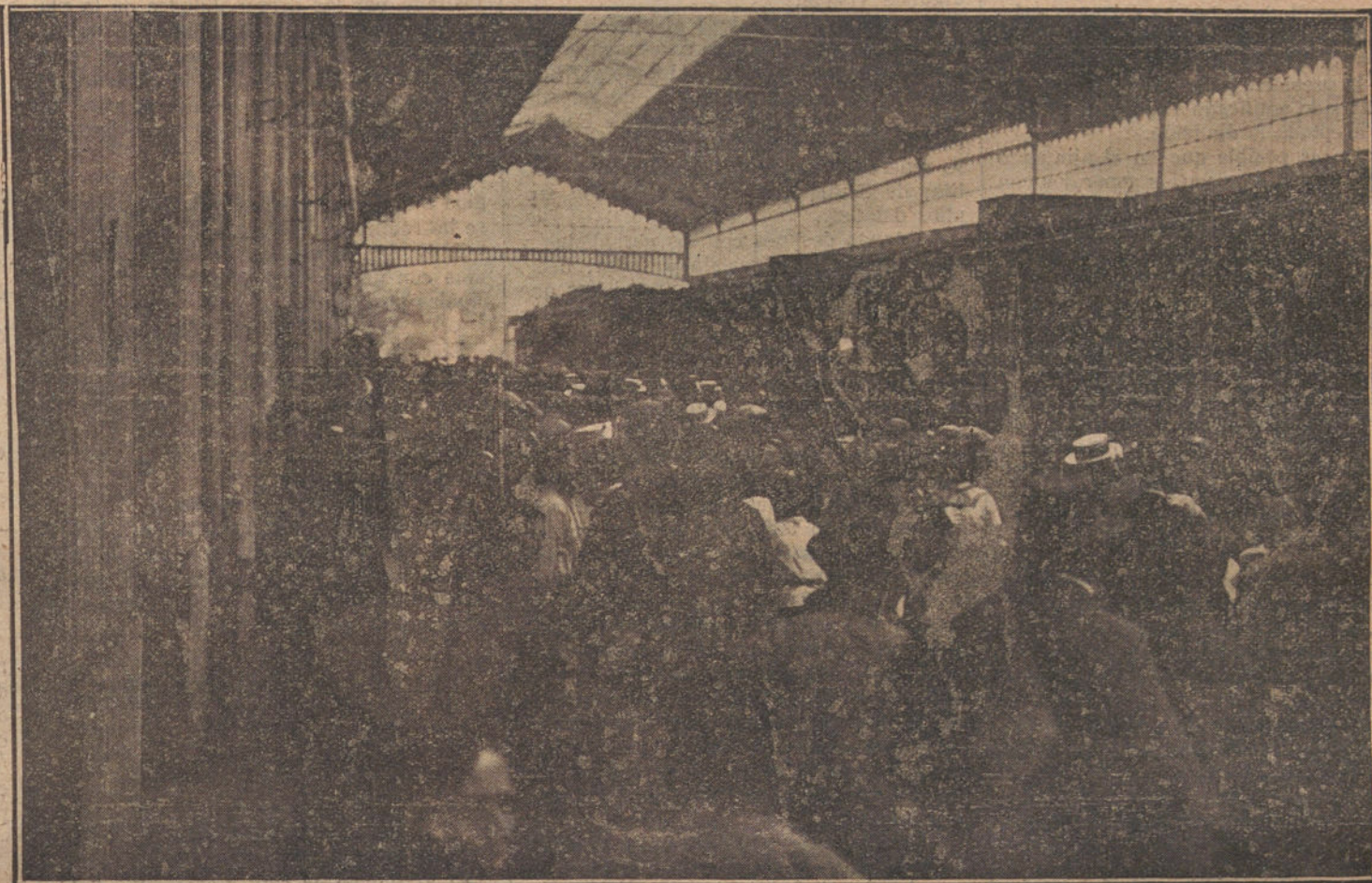
Llegada á Santander de nuestro rápido, donde tuvieron los excursionistas de LA TRIBUNA un entusiasta recibimiento.

Los paisanos de D. Cristóbal hablan un francés andaluz, incomprensible para los franceses y para los andaluces, y atribuyen al barro de Andújar propie-