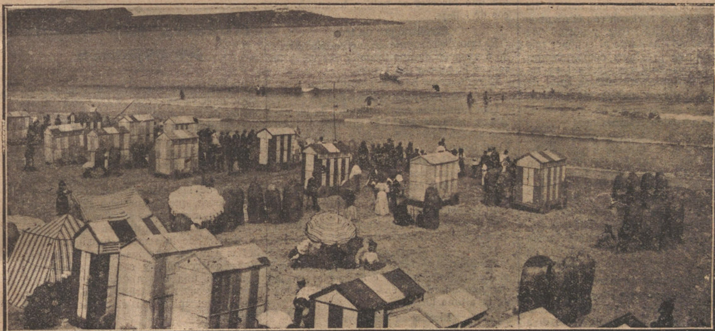
NUESTRO RAPIDO A SANTANDER.—Los excursionistas de LA TRIBUNA visitando la famosa playa del Sardinero.

dades parecidas á las que el sevillano atribuyó al botijo de Gautier.