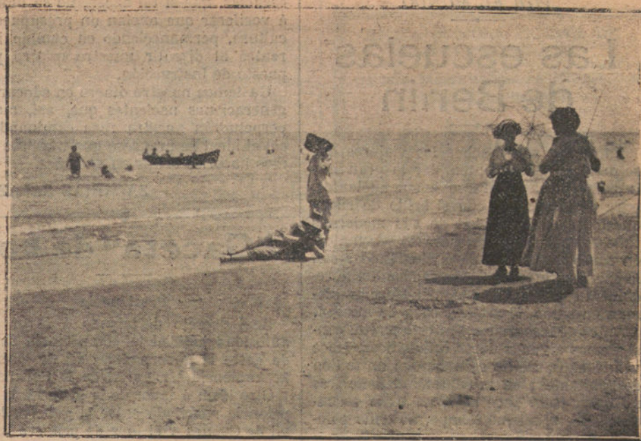
NUESTRO RAPIDO A SANTANDER.—Un ángulo de la famosa playa del Sardinero, donde están veraneando nuestros lectores

Lo más acertado, á mi juicio, respecto á la substitución del impuesto de inquilinato,