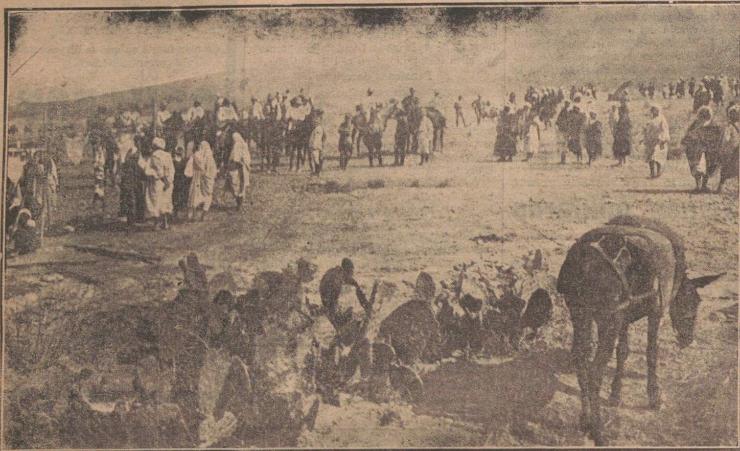
NUESTRAS TROPAS EN AFRICA. —Los cabileños de Beni-bu-yaghi, que se han presentado á las autoridades de Melilla haciendo protestas de amor á España. Momento de salir de la ciudad después de la conferencia con el capitán general