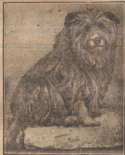
El perro «Pat», que perteneció al famoso general Booth's, jefe de la Liga de la Temperanza, y que, con su amo, ha prestado extraordinarios servicios de beneficencia. «Pat» está condecorado por infinidad de Sociedades

Cuando la Policía se personó en el lugar del suceso, el agresor había desaparecido, y los concurrentes al café declararon no haber visto al autor de los disparos.