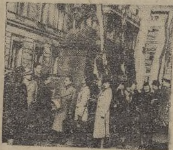
Grupo de alumnos, en su visita al Museo de Berlín

No todo es exterminio ni destrucción en este presente tan trágico y desolador, en que la guerra sigue, adquiriendo más y más intensidad y dominando de día en día más naciones, con la amenaza aún de una mayor extensión.