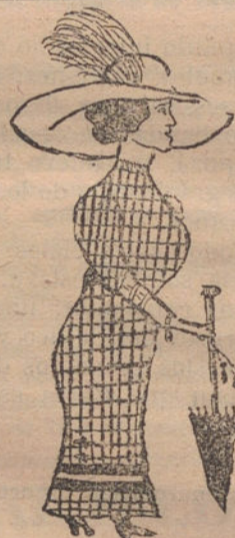
UNA CURSI.—Por Conchita C. (doce años)