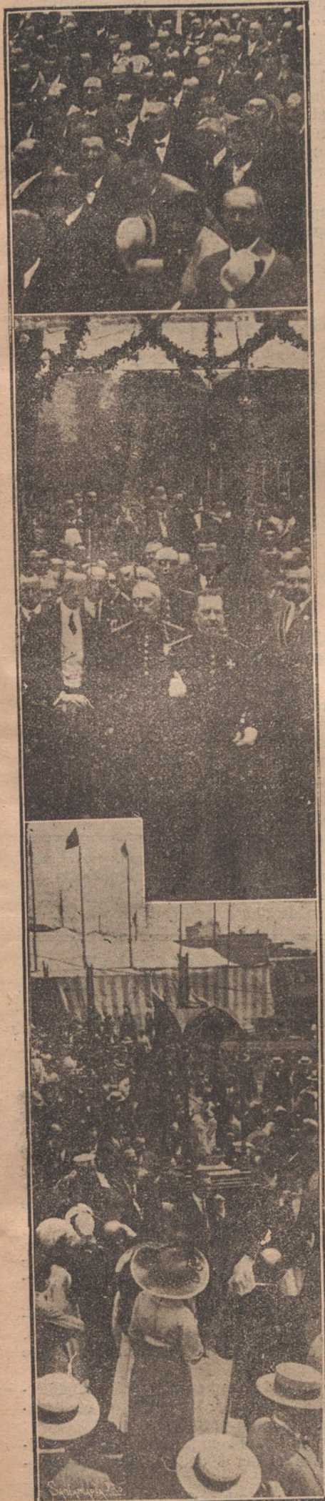
Los somatenes que asistieron al acto de la bendición de la bandera, celebrado en el popular barrio de la Salud.—El general Weyler durante la arenga a los somatenes. Un detalle de la procesión

Corte usted el cupón número 14 del arte de pagar bien al casero.