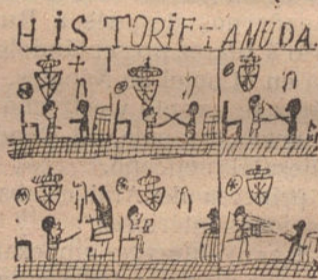
HISTORIA MUDA.—Por Emilio Gallart (nueve años).