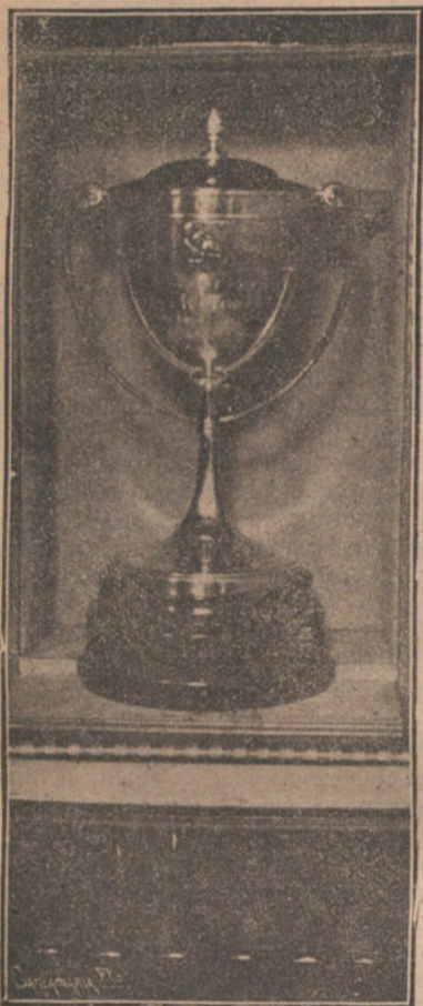
La copa ofrecida por «La Tribuna» de Barcelona al vencedor del torneo de lucha greco-romana, organizado por dicho periódico en el teatro de Novedades de la capital catalana

PARIS (9,05 mañana) del 13. Anoche partieron de la estación de los inválidos, para Tours, en donde asistirán las grandes maniobras del ejército francés, el gran duque Nicolawitch, tío del zar, y su esposa, la gran duquesa Anastasia. Con los grandes duques marcharon las