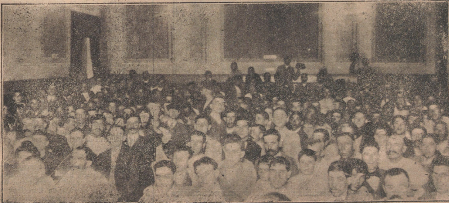
Aspecto del salón de la Casa del Pueblo, durante la celebración del mitin de obreros municipales.

los faroles? ¿Por vagancia? ¿Por filosofía? Lo cierto es que en Londres ó en Nueva York, en París ó en Berlín no hay medio de arrimarse á un farol. De un lado, se lo impide á uno el clima; de otro, el guardia. En España el clima es benigno y los guardias son tolerantes. Los guardias, ellos mismos, se apoyan también contra los faroles, porque la autoridad tiene muy poca fuerza entre nosotros. ¿Que nos hablen de revolución! ¿Que nos digan que España va á cambiar! Por mi parte, yo miraré las últimas fotografías de España y diré: —No. Mis queridos compatriotas, los españoles, no tienen ganas de molestar. Siguen todavía arrimados á los faroles.