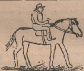
PINTURAS A CABALLO.—Por Félix Alvarez (nueve años).