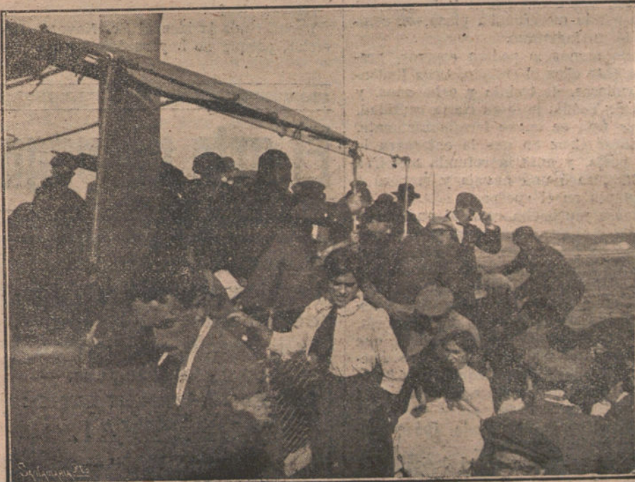
NUESTRO RAPIDO A SANTANDER.—Algunos de los excursionistas de LA TRIBUNA, durante la jira á La Pedrosa.

Las corridas de novillos han tenido lugar en medio de la mayor animación. Pino y Araujito estuvieron bien sus dos tardes, especialmente el primero, cuya valentía y estilo de matador ha entusiasmado á la afición. La primera corrida cortó Pino la oreja de uno de los bichos lidiados, y la segunda tarde estuvo colosal con la muleta y el estoque, recibiendo, en premio á su valentía y arte, colosales ovaciones.—Corresponsal.