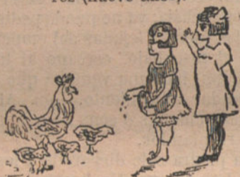
MIS HERMANITAS DANDO DE COMER A LOS POLLITOS.—Por Elena López García (doce años).