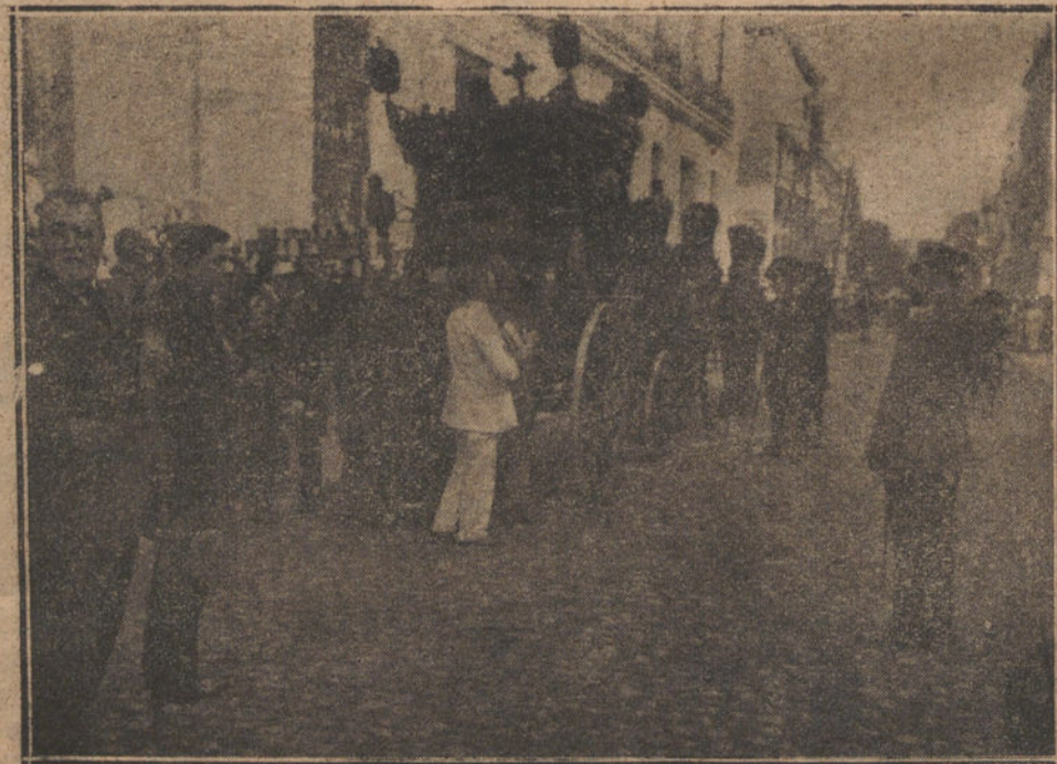
EL ENTIERRO DEL EMBAJADOR DE MEJICO.—Momento de sacar el féretro de la casa mortuoria.

El «leader» del socialismo belga, Emilio Vandervelde, se propone visitar estos días Córdoba, Sevilla y Granada y marchar a Tánger, regresando seguidamente a Madrid, con objeto de presidir el próximo día 25 la sesión inaugural del Congreso socialista; atención que con él ha tenido el jefe de los socialistas españoles, Pablo Iglesias.