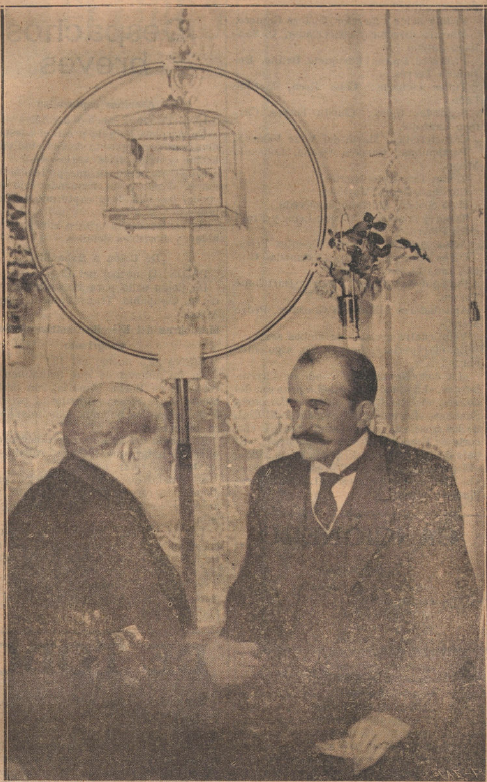
El conde de Romanones, murmurando del Sr. Canals con el Sr. Eguilior (Nos lo ha cantado un pajarito.)