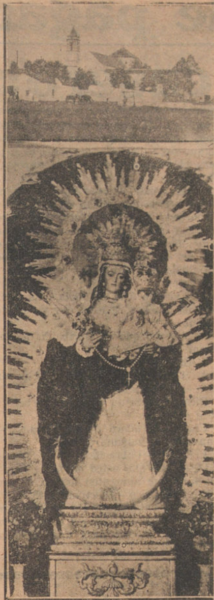
LAS FIESTAS DE UTRERA.—La ermita y la imagen de la popular Virgen de Utrera, en cuyo honor se están celebrando en aquella localidad típicos festejos.

PARA VENDER NO HAY MEJOR PROCEDIMIENTO QUE ANUNCIARSE EN «LA TRIBUNA».