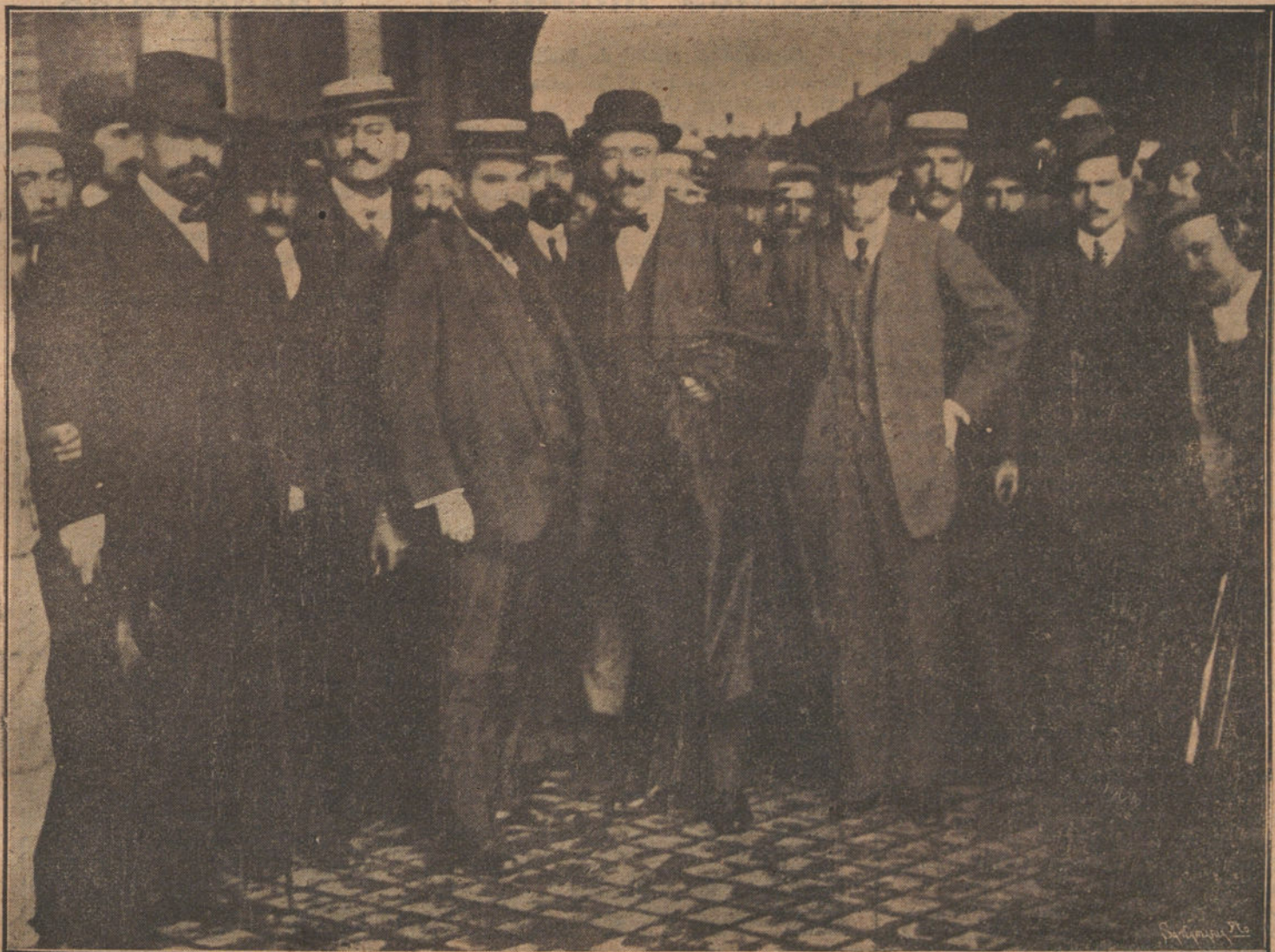
La Comisión de ferroviarios catalanes, que ha llegado a Madrid, para conferenciar con el ministro de Fomento y el director de los ferrocarriles M. Z. A.

Esta tarde, de seis y media a siete, han sido recibidos por el ministro de Fomento los comisionados catalanes.