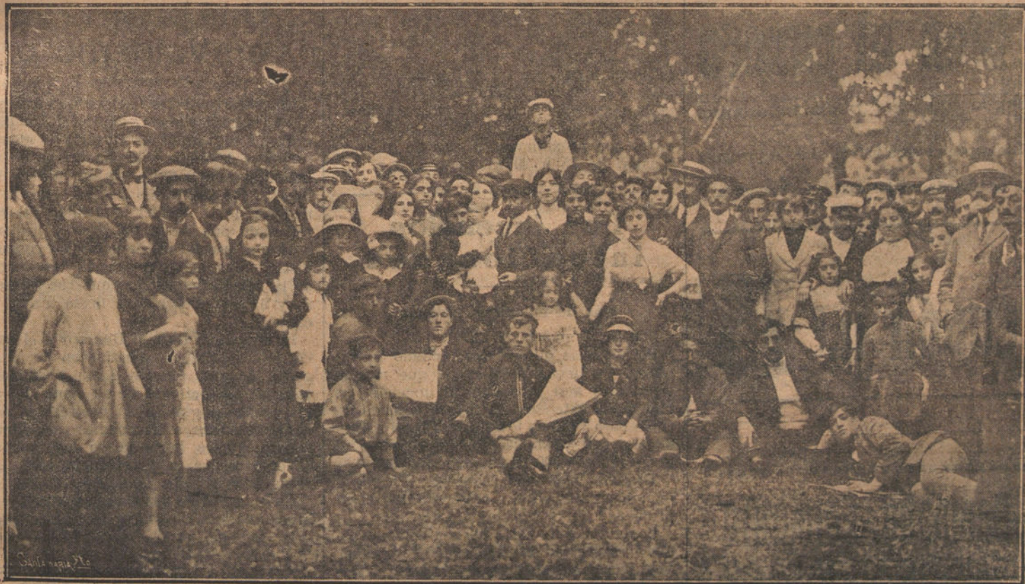
NUESTRO RAPIDO A SANTANDER.—Grupo de excursionistas de LA TRIBUNA en el bosque del rio Cubas.