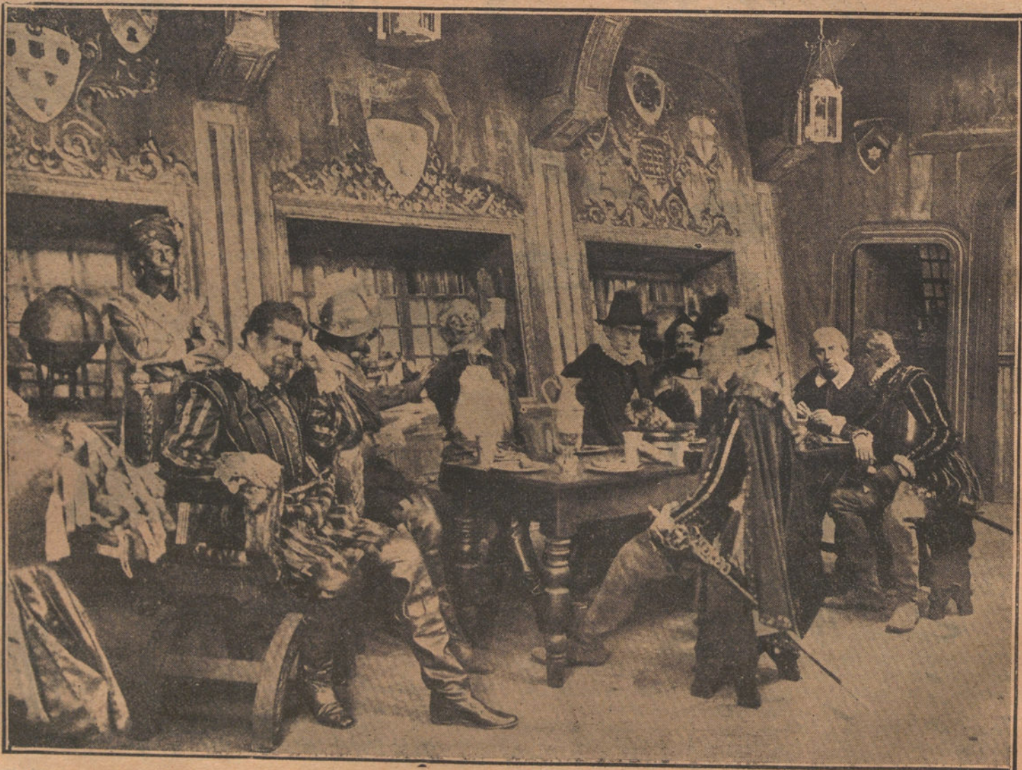
Drake y sus oficiales, á bordo del navío «Golden Hind», en el que hizo sus correrías por el Pacífico, en el Puerto de San Julián

Fueron recaudados 1.125 francos, cuya suma quedó en poder del cónsul de España, el cual la distribuirá entre las familias de los que perecieron víctimas de las iras del Cantábrico.