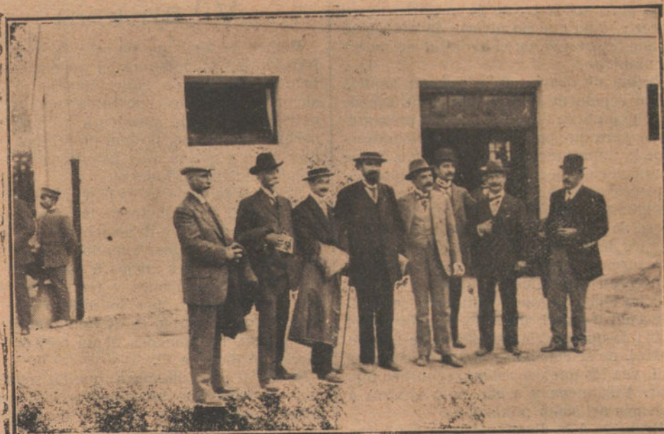
EL CONGRESO ANTITUBERCULOSO DE SAN SEBASTIAN.—Grupo de delegados de la América latina, que asistieron al Congreso

las aspiraciones de los ferroviarios catalanes puedan estar reflejadas en las consideraciones que vamos a hacer, puesto que de una manera expresa no nos lo han manifestado; pero si creemos poder anticipar que la solución de la huelga está en conceder las tres peticiones siguientes: