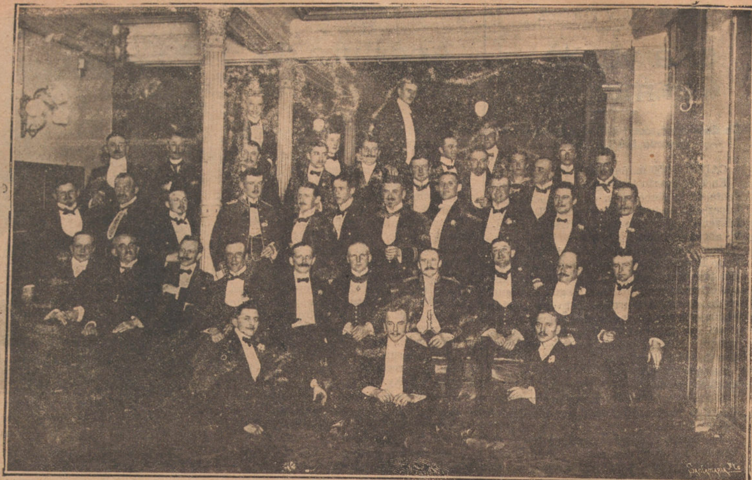
Banquete ofrecido en Bilbao por la colonia alemana a los jefes y oficiales del buque alemán «Hansa» (guardia de guardias marinas), que se encuentra actualmente en aquel puerto. Grupo de asistentes a la fiesta.

Algeciras. Salida de Algeciras para Tánger.