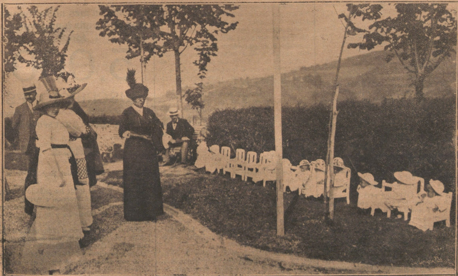
EL CONGRESO ANTITUBERCULOSO DE SAN SEBASTIAN.—Los niños de la Casa Cuna, durante la visita que a dicho establecimiento hicieron los congresistas.

He de manifestar a usted que cuanto tuve el gusto de comunicar al redactor del diario de su digna dirección es cierto, a pesar de la negativa del ministro. A la observación hecha por mí de que los ferroviarios se levantarían en el caso de que no se acce-