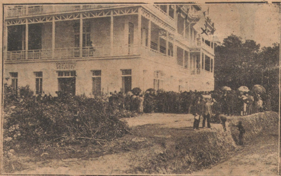
EL CONGRESO ANTITUBERCULOSO DE SAN SEBASTIAN.—Sanatorio inaugurado por los Reyes, con motivo del Congreso.

la Compañía hacer las manifestaciones siguientes: